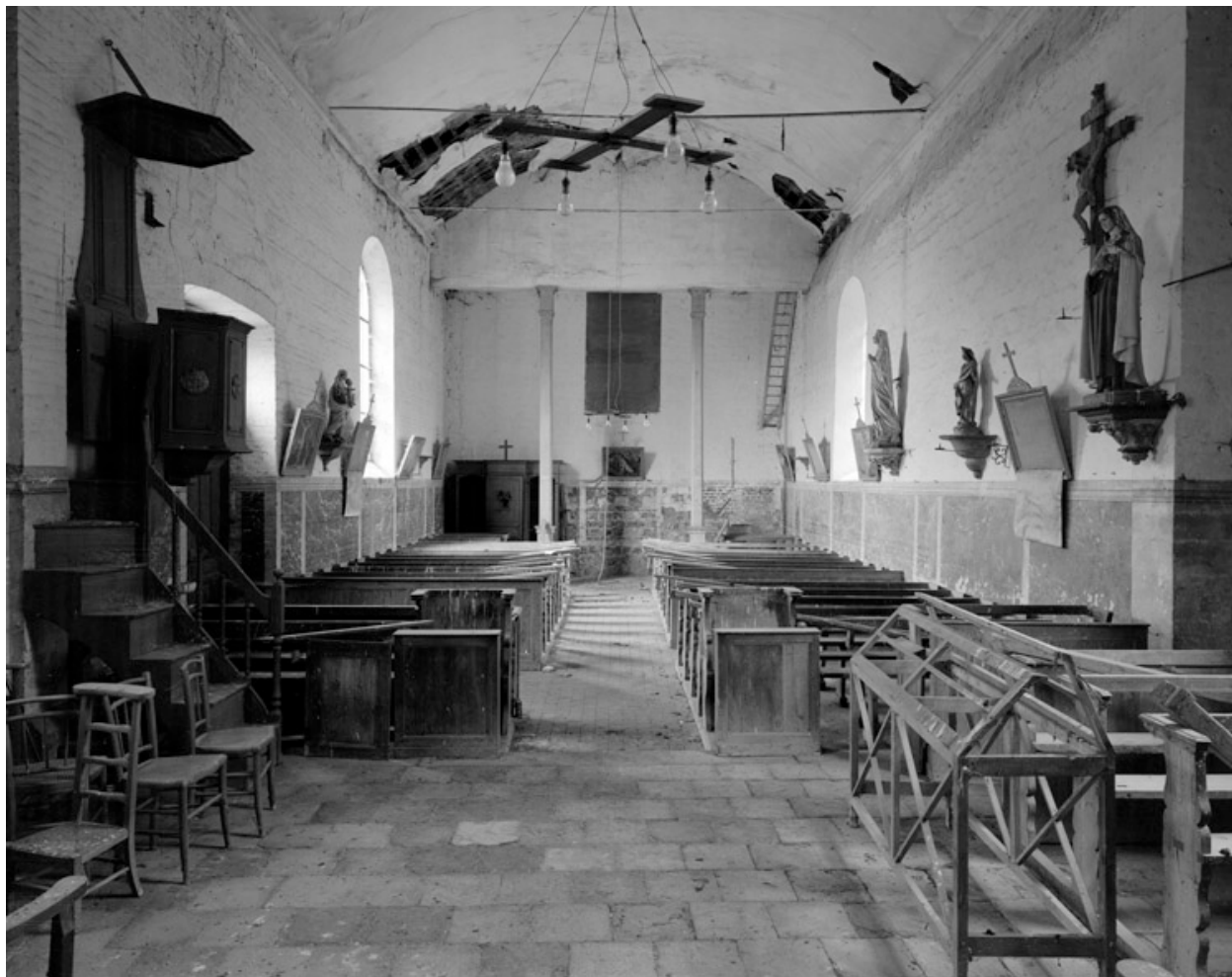
Vue intérieure, depuis le chœur.