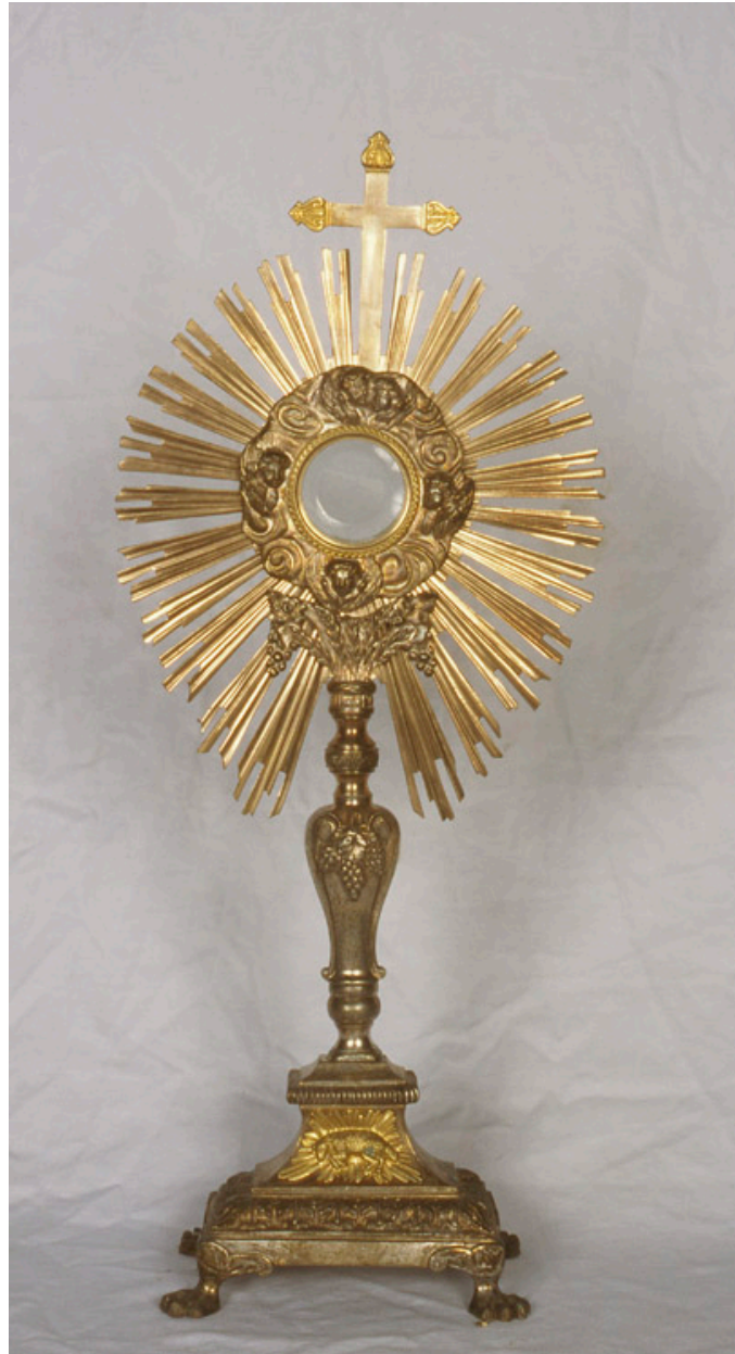
Ostensoir, par M. Chéret.