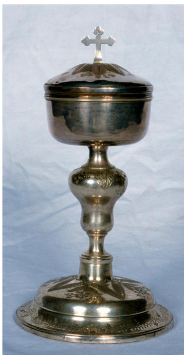
Ciboire. IVR22_19998001028ZA