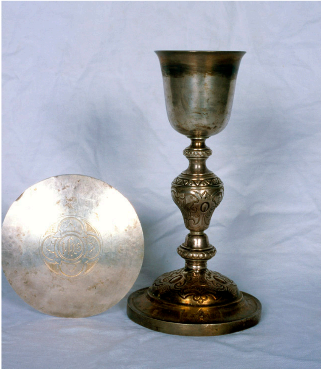
Calice (Armand-Calliat) et patène (Jamain et Chevron).