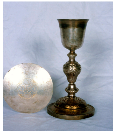
Calice (Armand-Calliat) et patène (Jamain et Chevron).