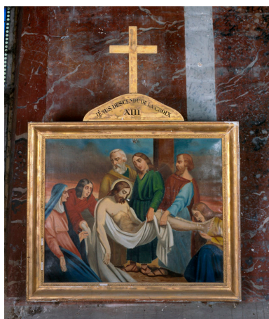
Chemin de croix, station 13.