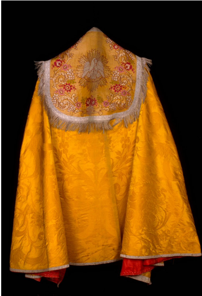
Chape dorée, Deprez-Sueur (Amiens).