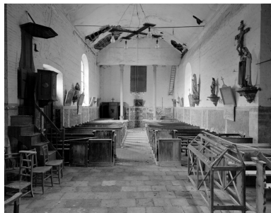
Vue intérieure, depuis le chœur. IVR22_19998001073V