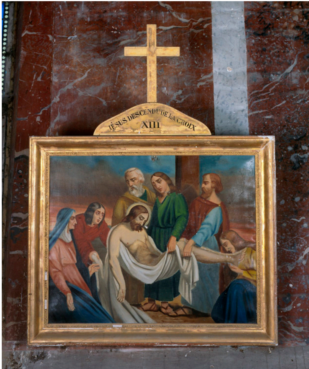
Chemin de croix, station 13.