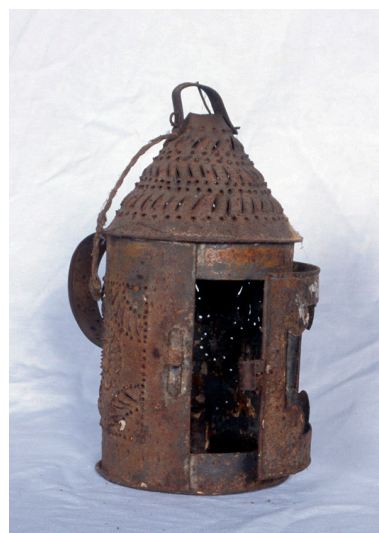
Petite lanterne. IVR22_19998001032ZA