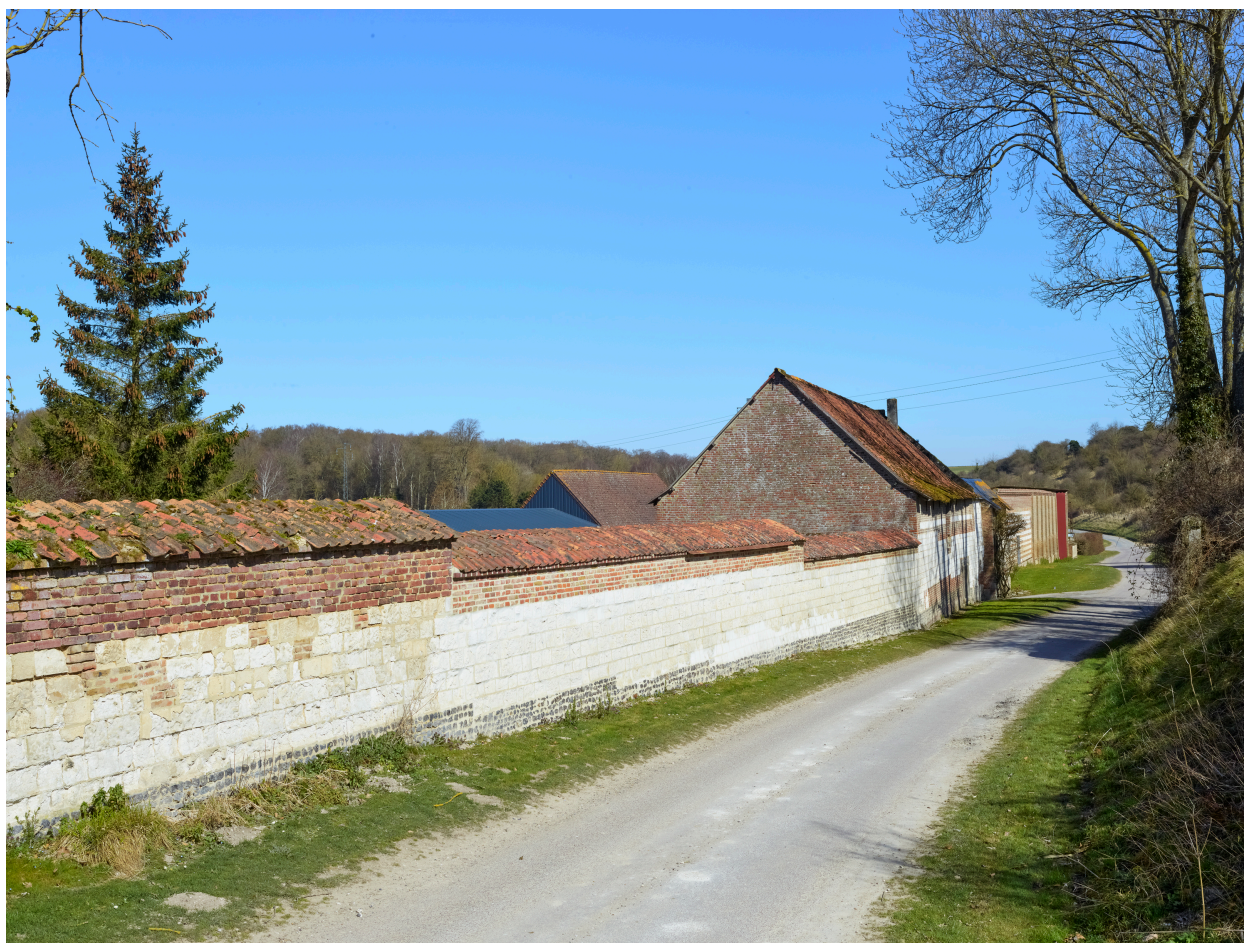
Mur de clôture de la ferme, depuis le sud.