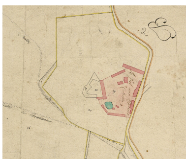
Plan masse de la ferme du Val, extrait du plan parcellaire de la commune de Grand-Laviers, dit cadastre napoléonien Section C, [s.d.] (AD Somme ; 3 P 1376/2). IVR32_20258005556NUCA