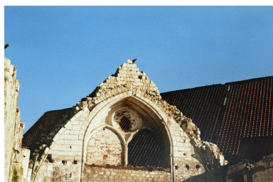
Détail de la baie de l'ancienne chapelle (coll. part). IVR32_20258000222NUCA