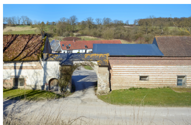
Entrée de la ferme du Val aux Lépreux, depuis l'est. IVR32_20258000280NUCA