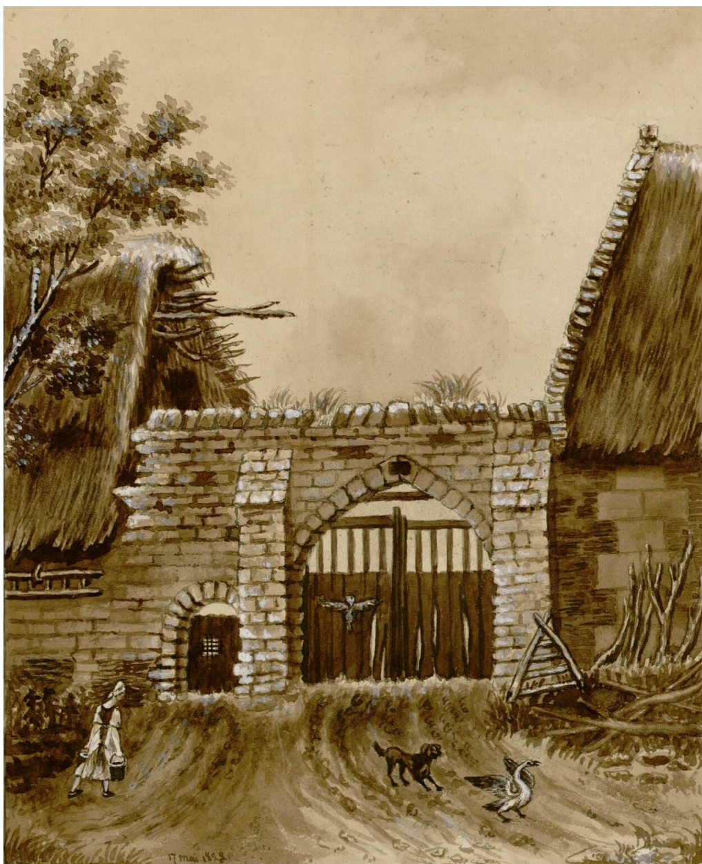
Entrée de la maladrerie du Val aux Lépreux, aquarelle, d'après nature, 17 mai 1828 (Archives et Bibliothèque patrimoniale d'Abbeville ; albums Delignières de Bommy de Saint-Amand, Vol 3, 98 bis).