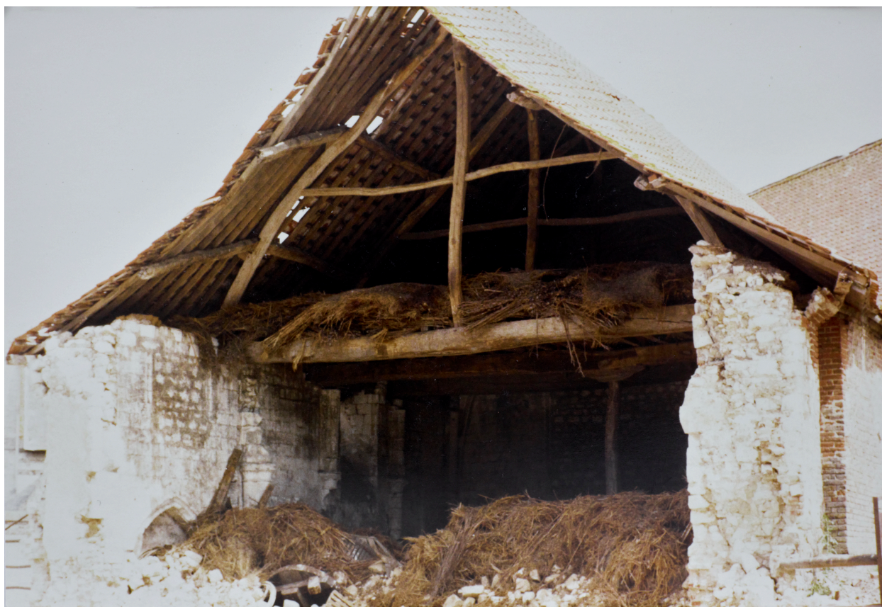
L'ancienne chapelle de la léproserie (détruite) (coll. part).