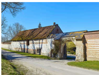
Entrée de la ferme et grange depuis le nord-est. IVR32_20258000285NUCA