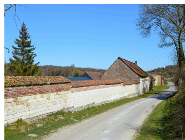
Mur de clôture de la ferme, depuis le sud.