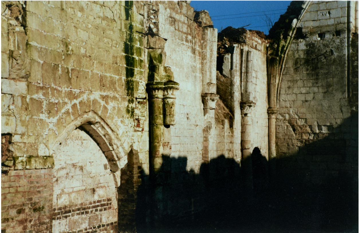
Détail des chapiteaux à l'intérieur de la chapelle (coll. part).