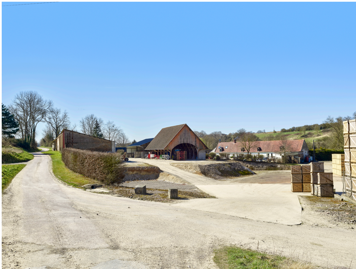
Vue d'ensemble de la ferme, depuis le nord.