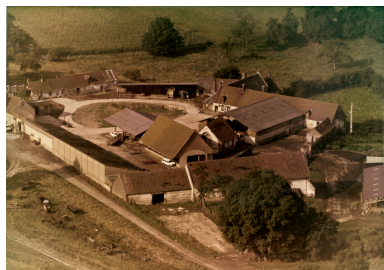
Vue aérienne de la ferme, deuxième moitié du XXe siècle (coll. part). IVR32_20258000220NUCA