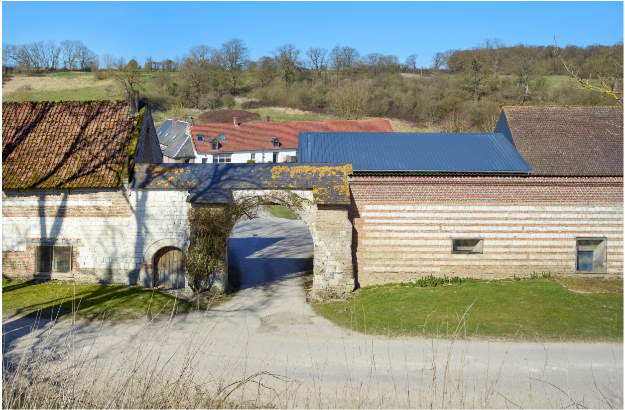
Entrée de la ferme du Val aux Lépreux, depuis l'est.