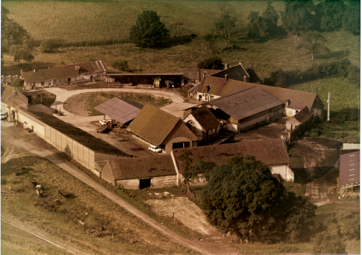
Vue aérienne de la ferme, deuxième moitié du XXe siècle (coll. part).