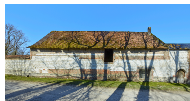
Grange, depuis l'est.