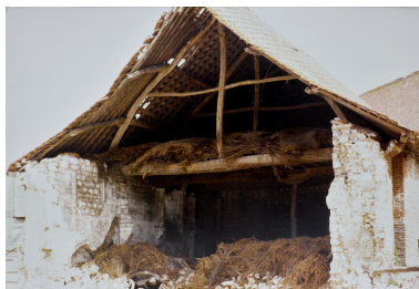
L'ancienne chapelle de la léproserie (détruite) (coll. part). IVR32_20258000224NUCA

Repro. Abbeville, archives et bibliothèque patrimoniale, IVR32_2025800554NUCA