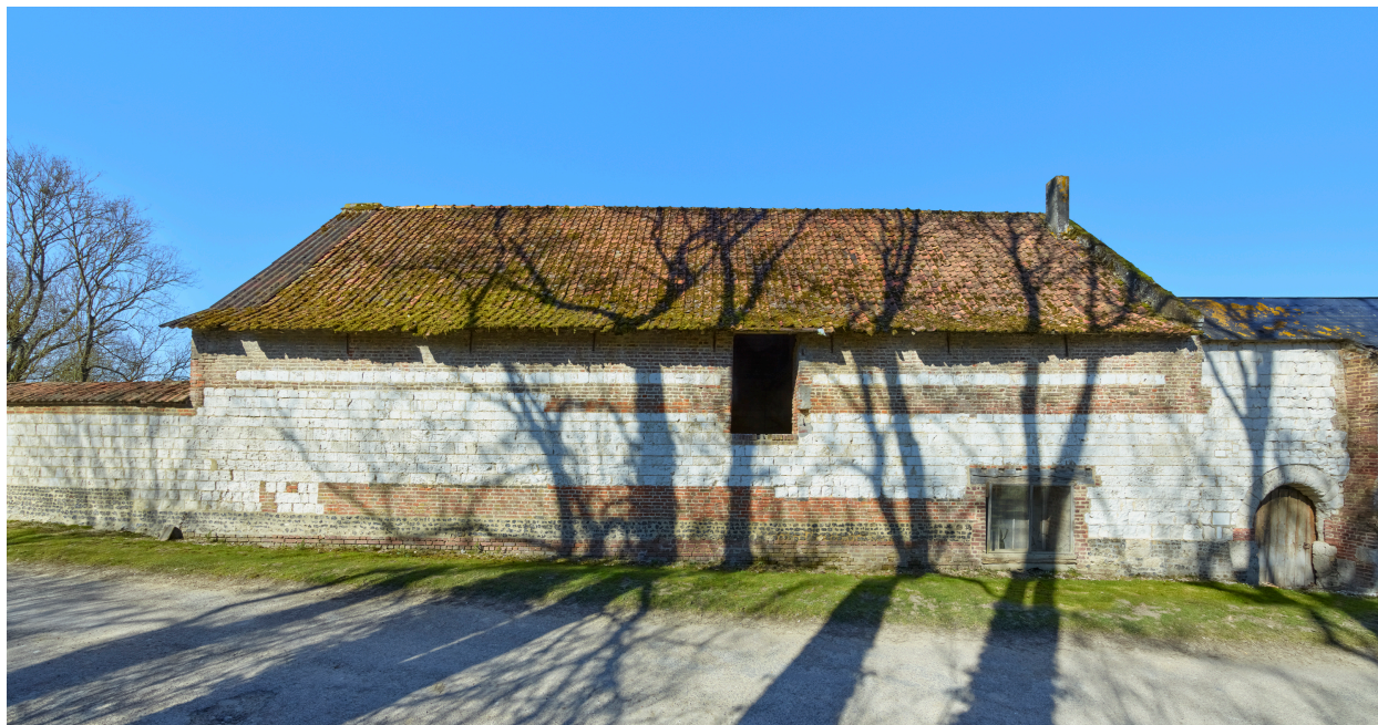
Grange, depuis l'est.