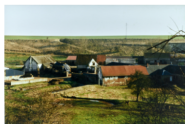
Photos de l'ensemble de la ferme, deuxième moitié du XXe siècle (coll. part). IVR32_20258000219NUCA