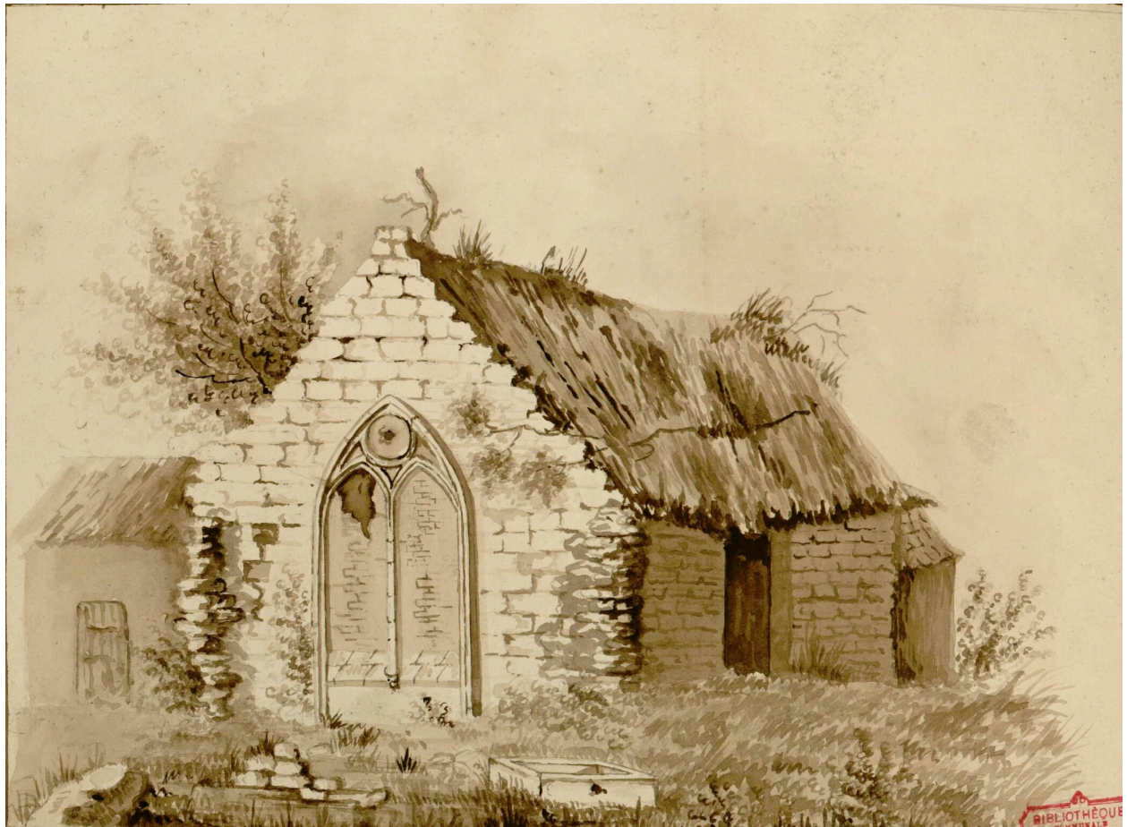
Vue extérieure de la chapelle de la maladrerie du Val aux Lépreux, aquarelle, d'après nature, 1828 (Archives et Bibliothèque patrimoniale d'Abbeville ; albums Delignières de Bommy de Saint-Amand, 4, 109).