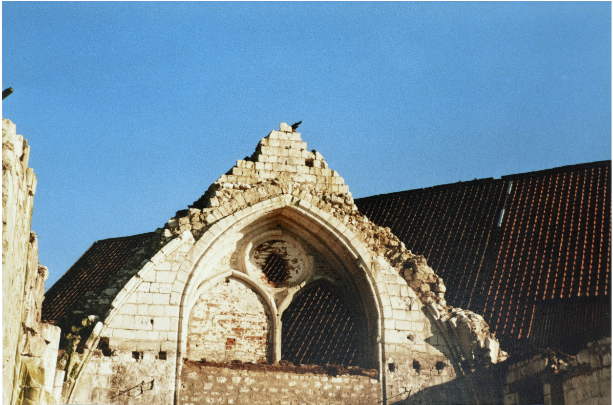
Détail de la baie de l'ancienne chapelle (coll. part).