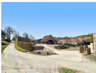
Vue d'ensemble de la ferme, depuis le nord.