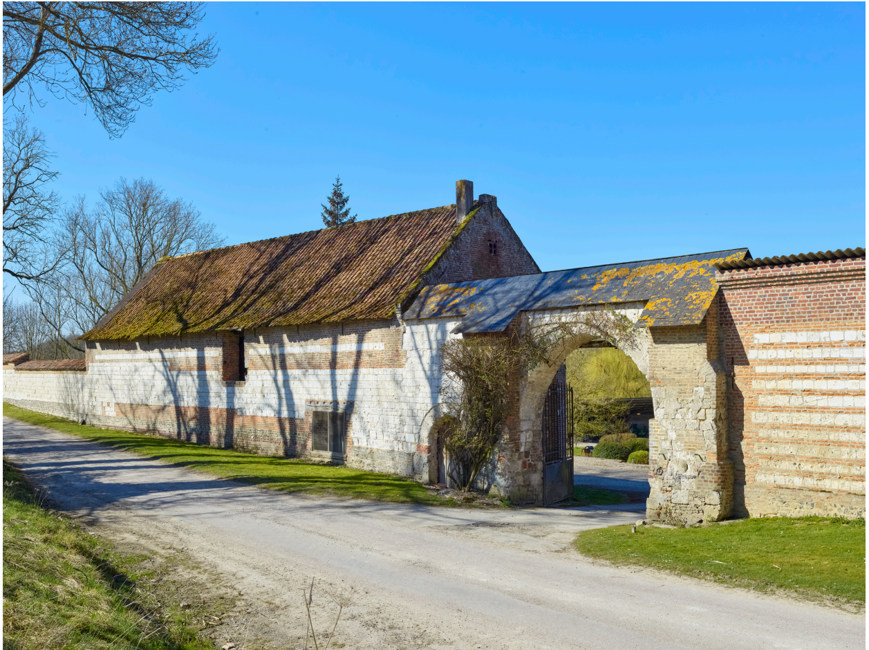
Entrée de la ferme et grange depuis le nord-est.