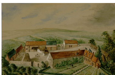
Ancienne maladrerie du Val aux Lépreux près de Laviers, convertie en ferme appartenant aux hospices d'Abbeville, aquarelle, par Oswald Macqueron, d'après nature, août 1849 (Archives et Bibliothèque patrimoniale d'Abbeville ; Ab. N65).