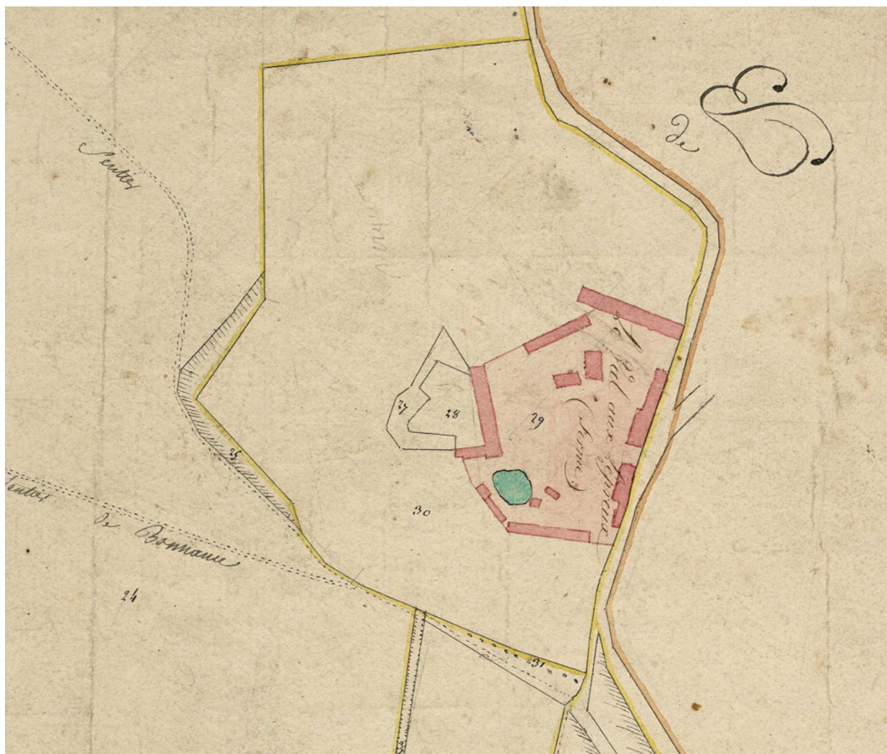
Plan masse de la ferme du Val, extrait du plan parcellaire de la commune de Grand-Laviers, dit cadastre napoléonien Section C, [s.d.] (AD Somme ; 3 P 1376/2).