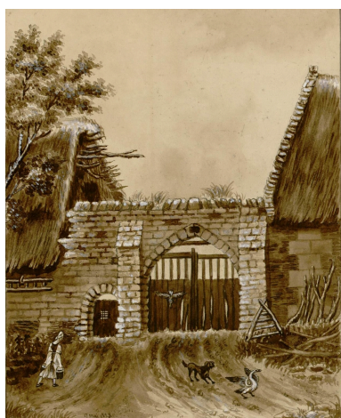
Entrée de la maladrerie du Val aux Lépreux, aquarelle, d'après nature, 17 may 1828