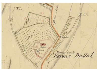
Plan de la ferme du Val, extrait du plan masses de cultures, 1804 (AD Somme ; 3 P 1010).