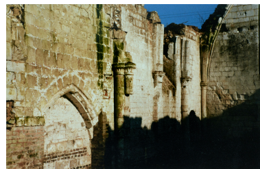
Détail des chapiteaux à l'intérieur de la chapelle (coll. part).