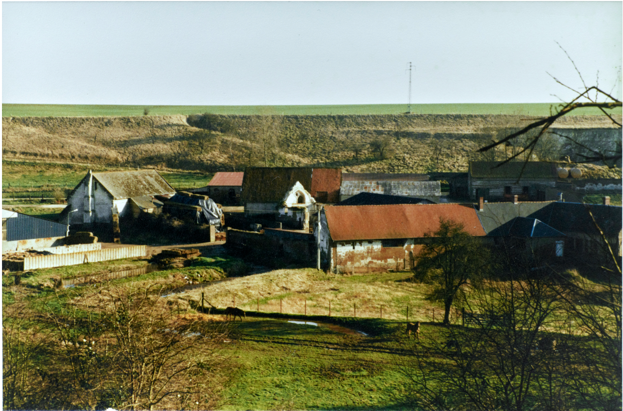
Photos de l'ensemble de la ferme, deuxième moitié du XXe siècle (coll. part).