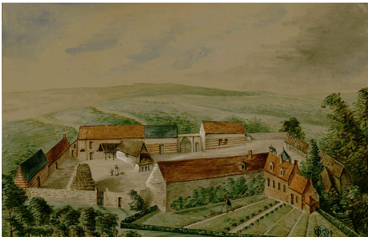
Ancienne maladrerie du Val aux Lépreux près de Laviers, convertie en ferme appartenant aux hospices d'Abbeville, aquarelle, par Oswald Macqueron, d'après nature, août 1849 (Archives et Bibliothèque patrimoniale d'Abbeville ; Ab. N65).