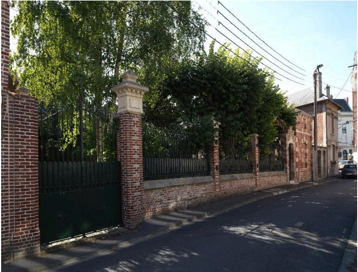
Portail et mur de clôture, rue Vadé.