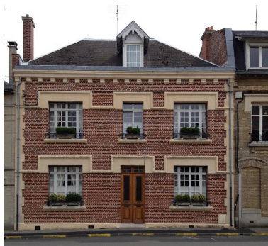
Vue générale. IVR22_20158006113NUCA