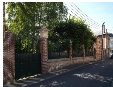
Portail et mur de clôture, rue Vadé. IVR22_20158000876NUC2A