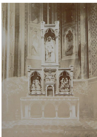
Vue d'une photographie de l'autel Sainte-Anne, antérieure à 1914. IVR22_20110201014NUCA