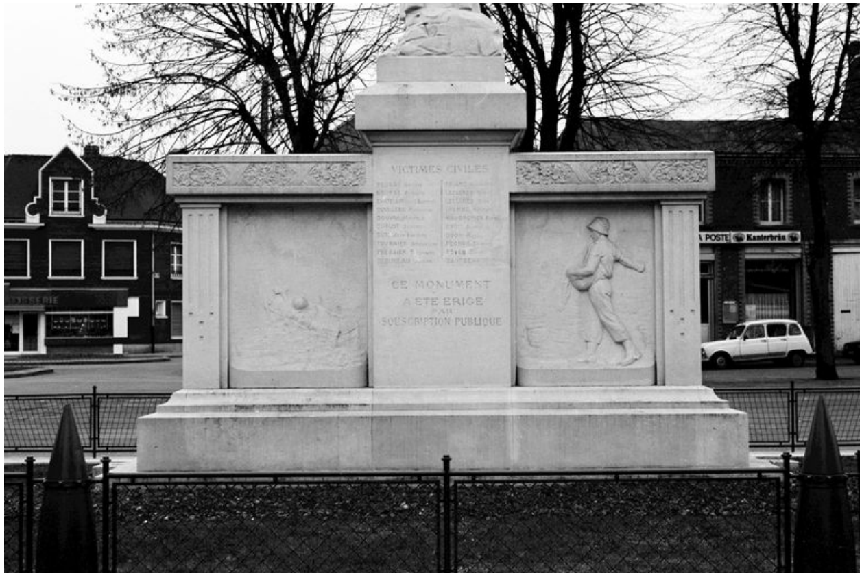
Vue postérieure des stèles.