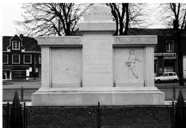
Vue postérieure des stèles. IVR22_19968000094Z