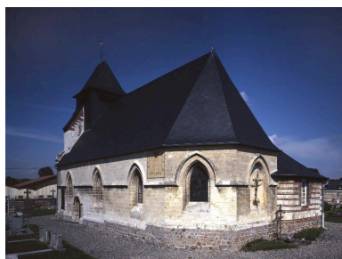
Vue générale du cimetière autour de l'église. IVR22_19988000812VA