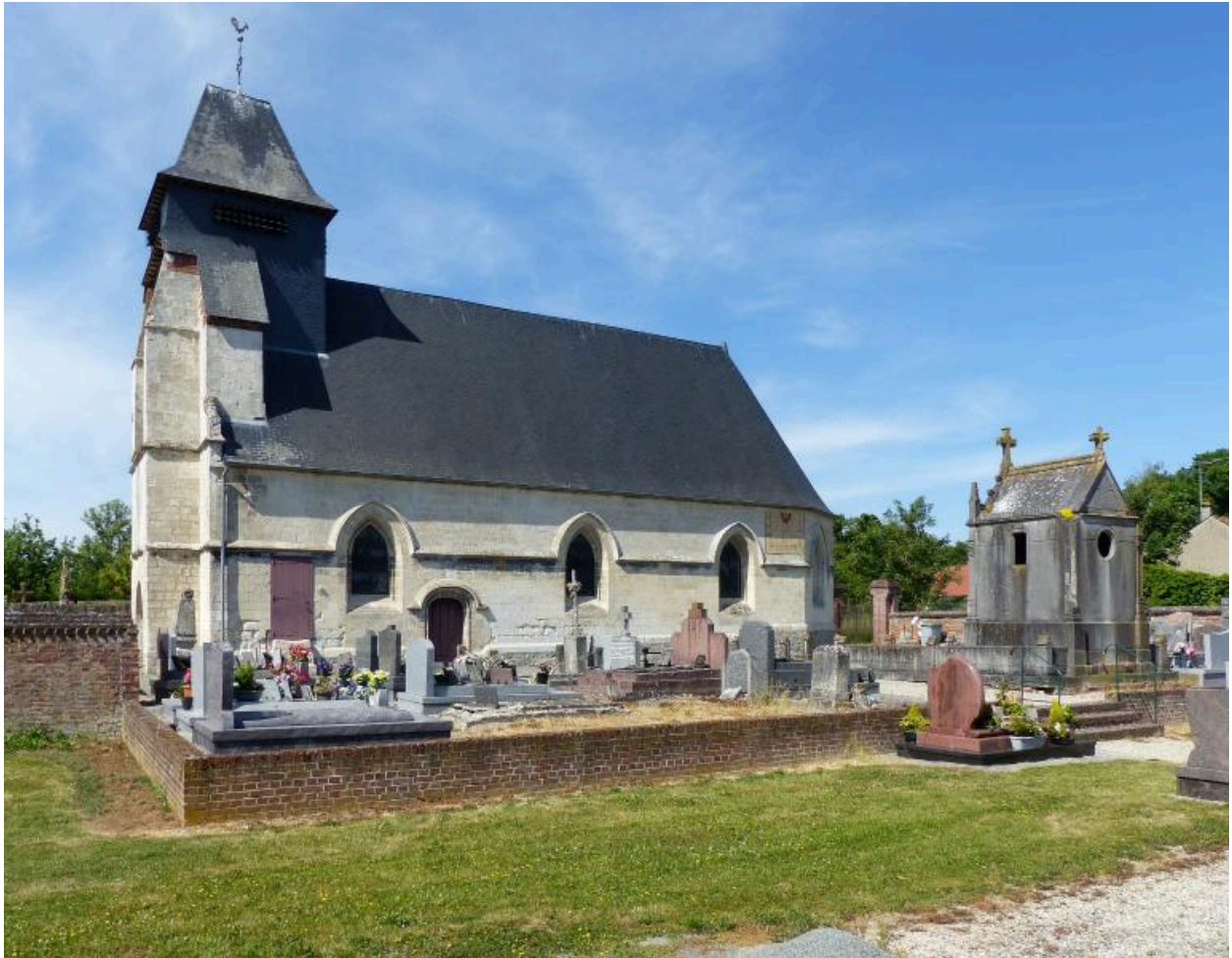
Vue depuis le sud.