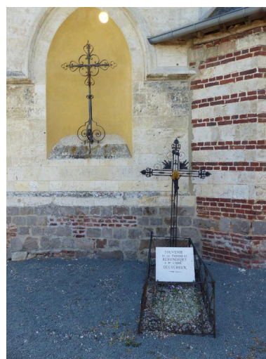
Tombeau de prêtre, au chevet de l'église.