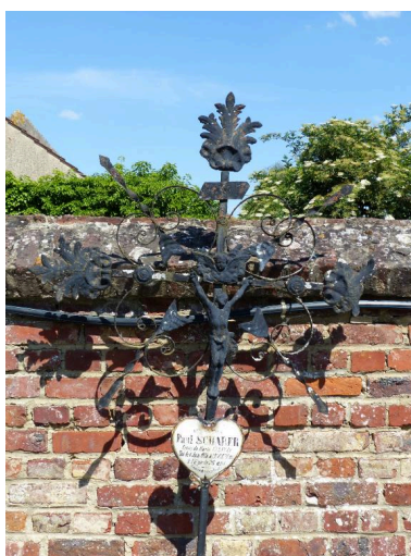
Croix funéraire.