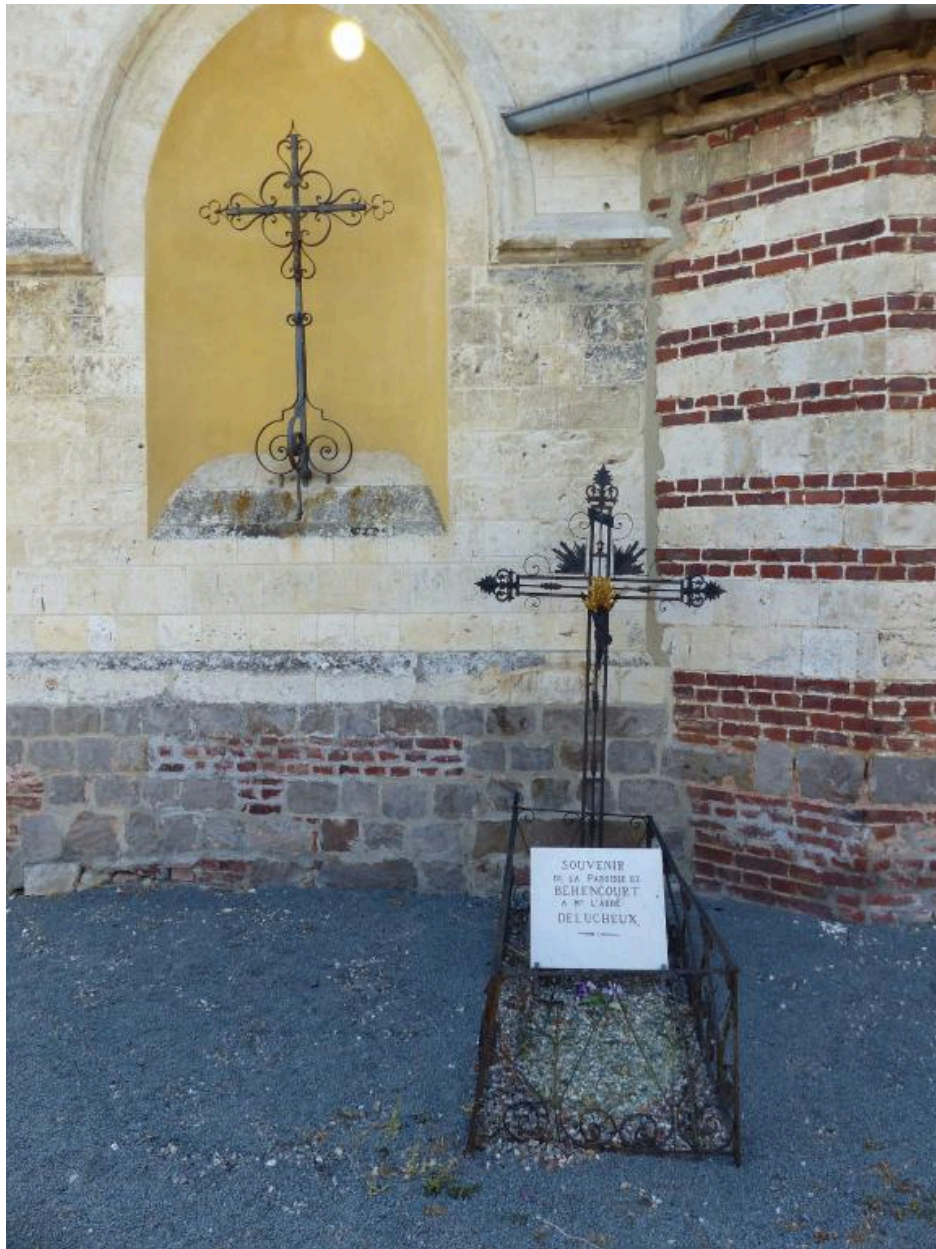
Tombeau de prêtre, au chevet de l'église.