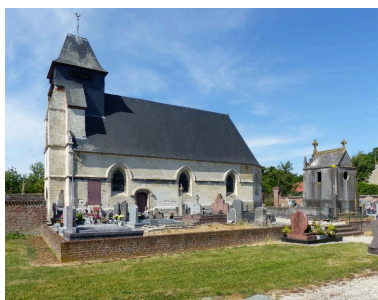
Vue depuis le sud. IVR32_20208005273NUCA