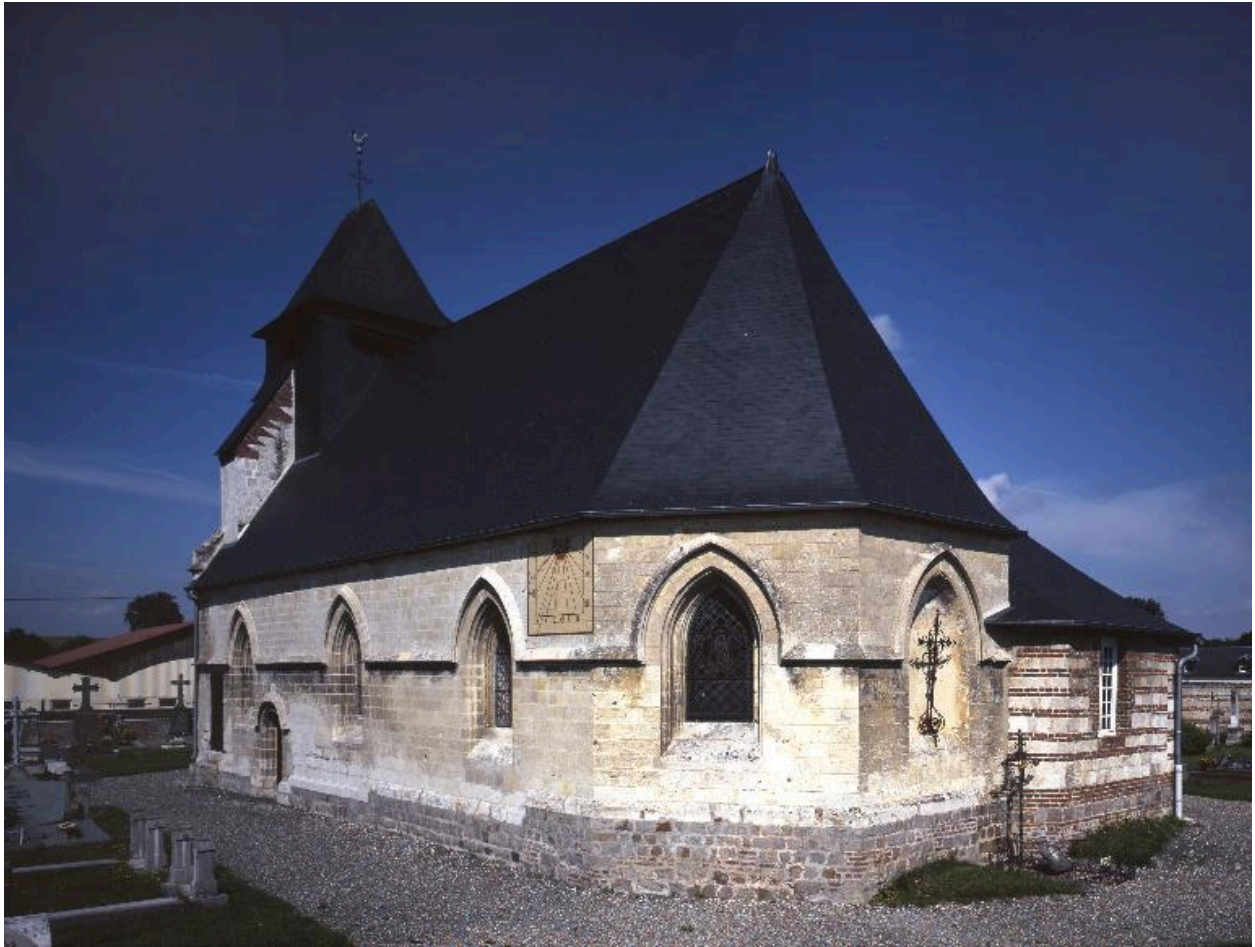
Vue générale du cimetière autour de l'église.