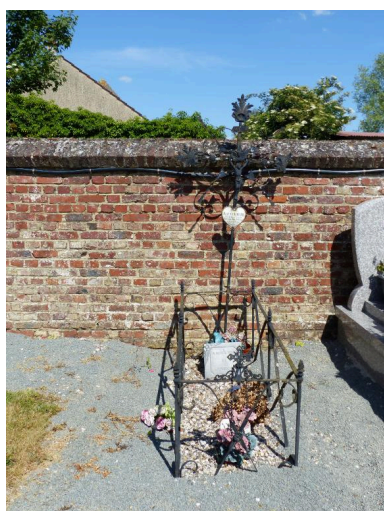
Croix funéraire.