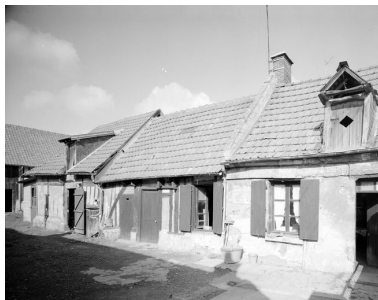
Vue générale. IVR22_19856001409V