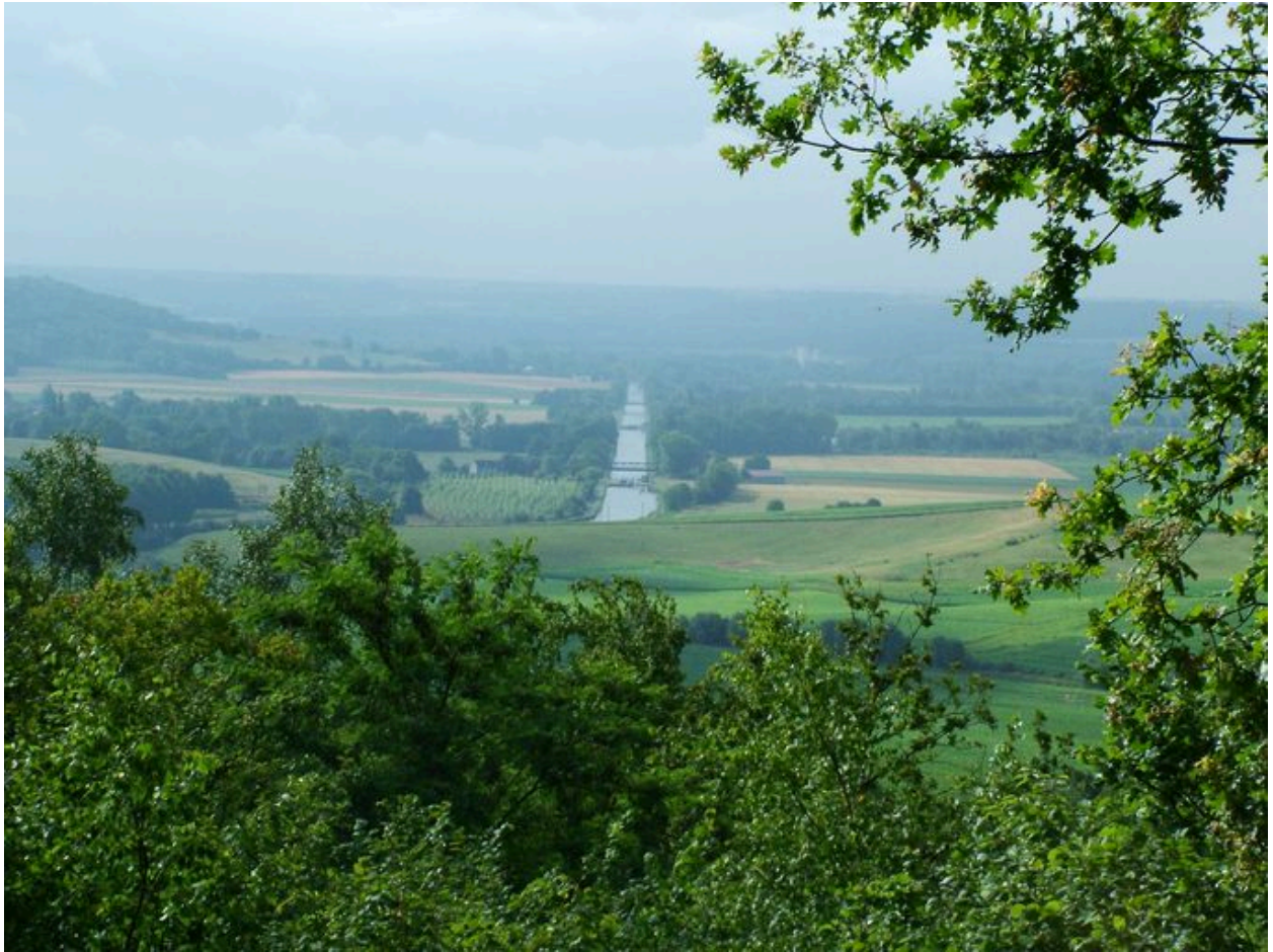
Vue depuis l'éperon.