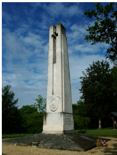
Vue générale. IVR22_20030202184NUCA