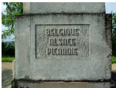
Détail des inscriptions.