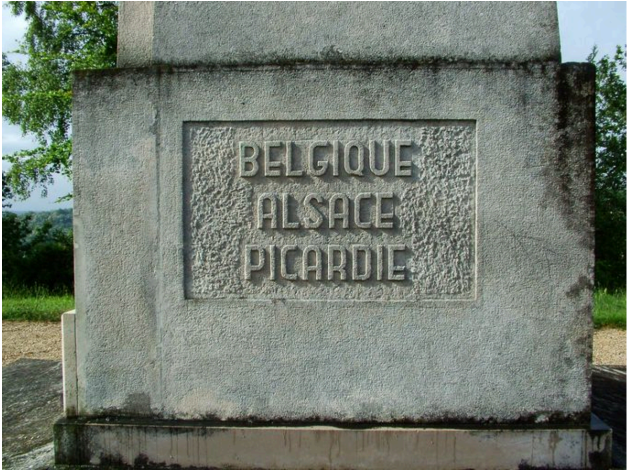
Détail des inscriptions.