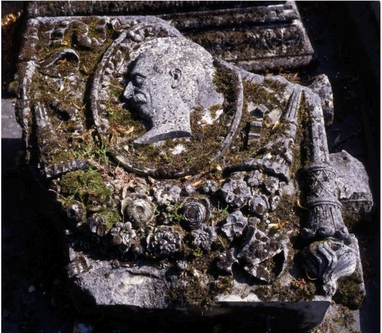
Vue de détail sur le décor sculpté du couronnement.