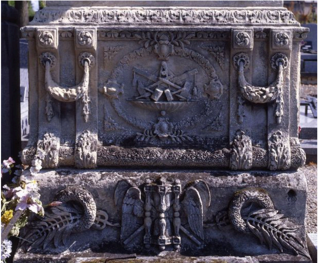
Vue de détail sur le décor sculpté de la partie supérieure du tombeau.