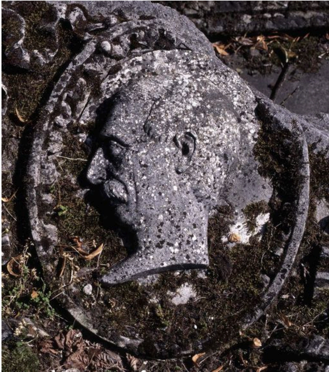
Vue de détail sur le médaillon.