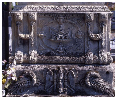
Vue de détail sur le décor sculpté de la partie supérieure du tombeau.