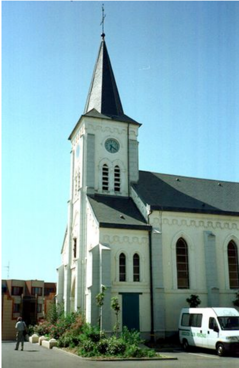
Vue générale de trois quarts de la chapelle en 1996.