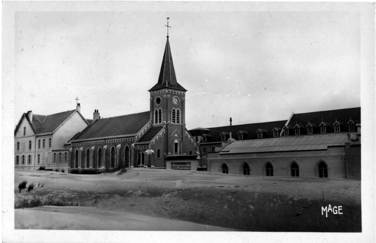
La chapelle et l'hôpital à laquelle elle se rattachait, carte postale ancienne, sans date (collection particulière).