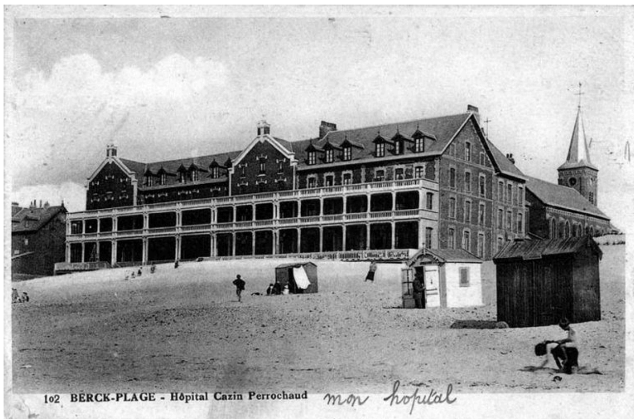
Façade de l'hôpital Cazin-Perrochaud (détruit) à laquelle se rattachait la chapelle, carte postale ancienne, sans date (collection particulière).