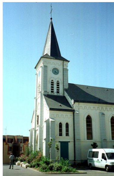
Vue générale de trois quarts de la chapelle en 1996. IVR31_19966201487ZE