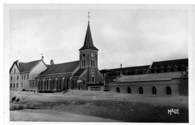
La chapelle et l'hôpital à laquelle elle se rattachait, carte postale ancienne, sans date (collection particulière).