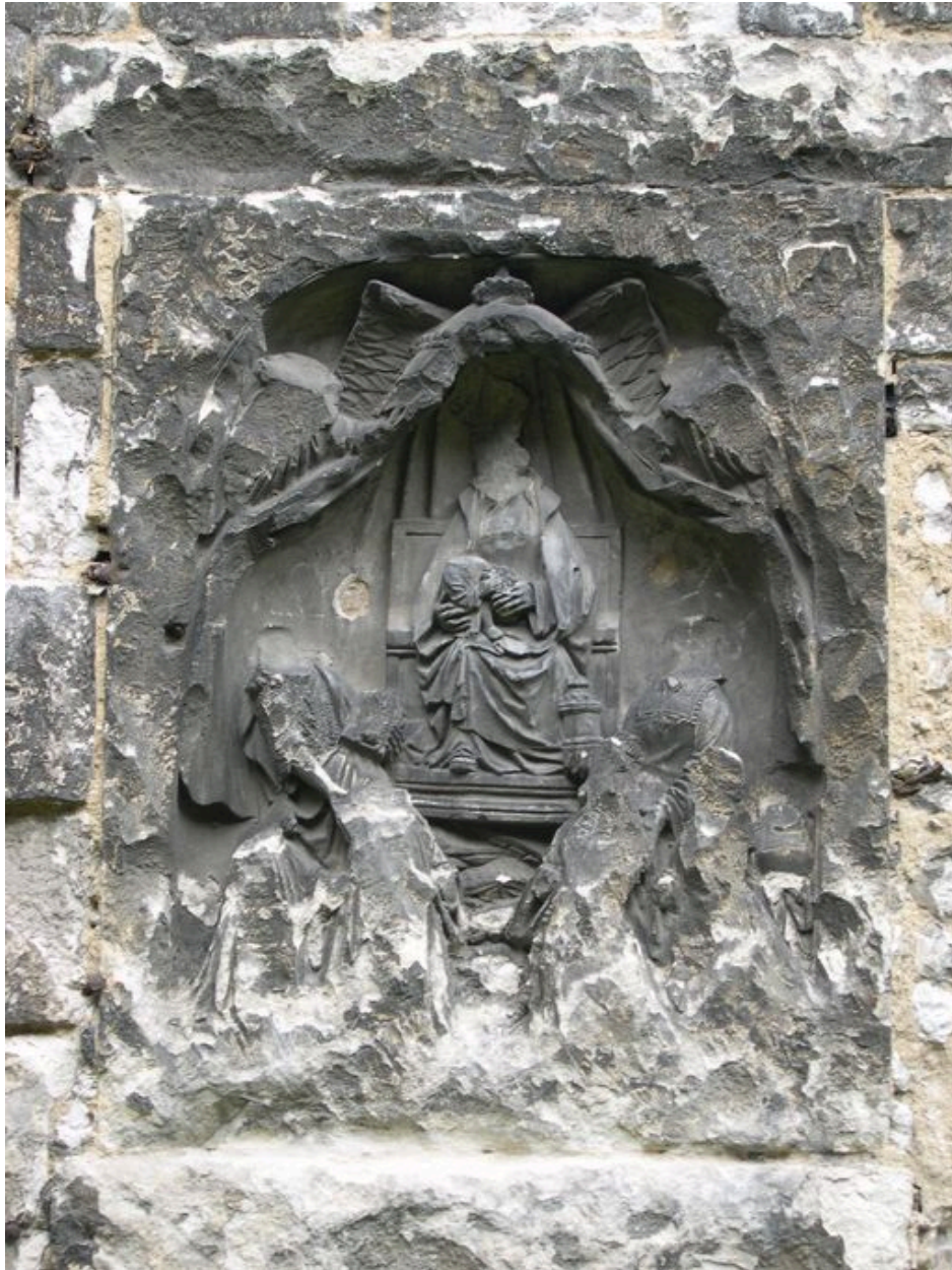
Bas-relief (mur sud de l'ancienne église conventuelle).