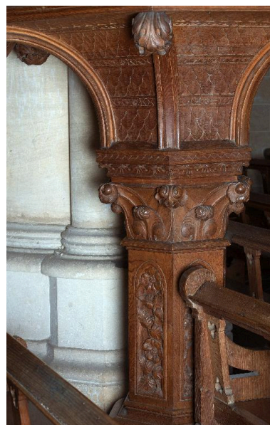
Détail du pied.

IVR22_20148000309NUC2A