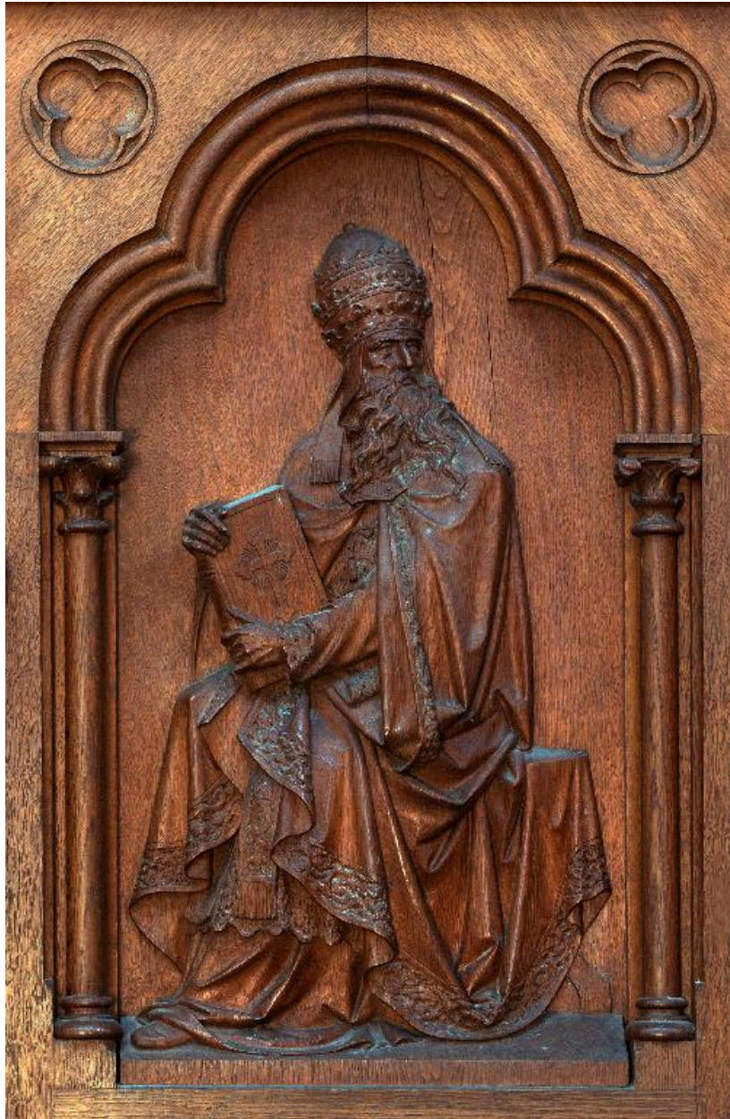
Détail d'un bas-relief de la cuve : saint Grégoire le Grand.