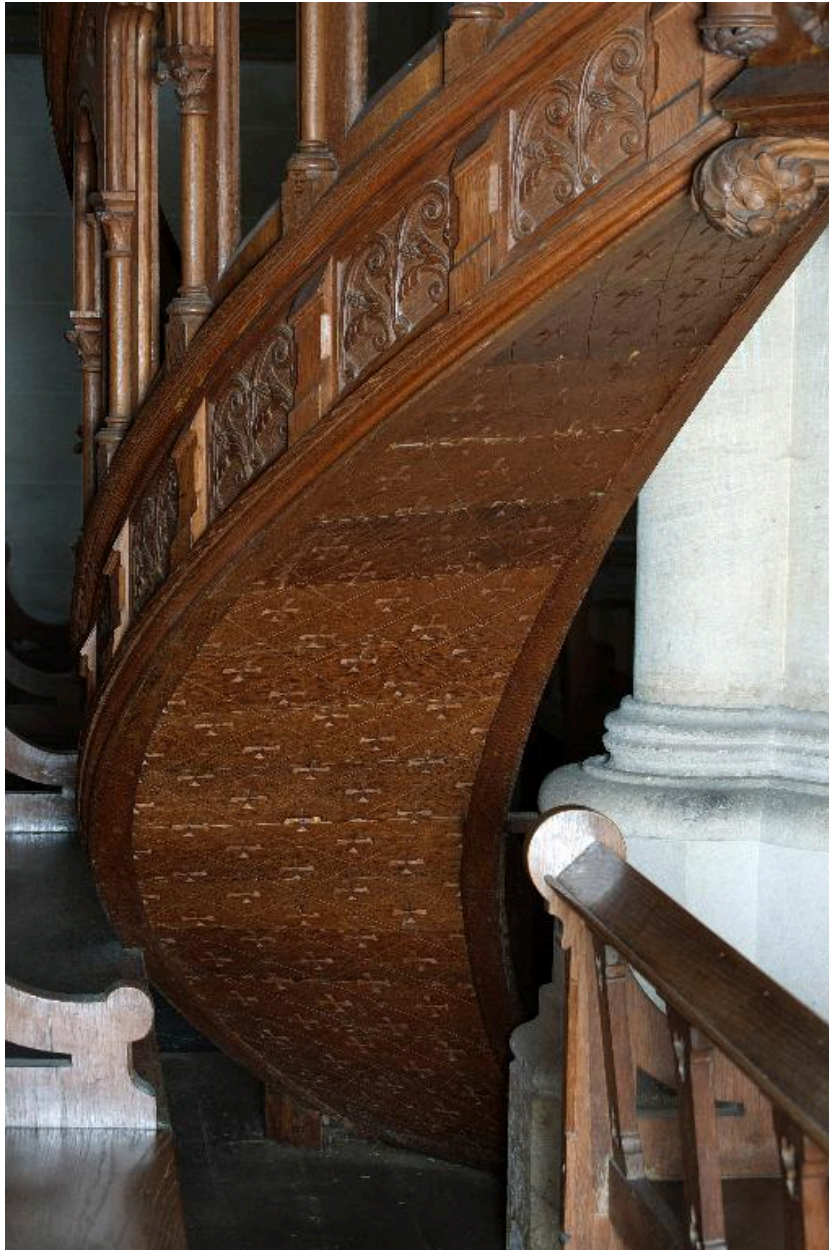
Détail de l'escalier.