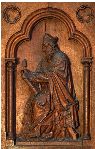
Détail d'un bas-relief de la cuve : saint Ambroise.

IVR22_20148000305NUC2A