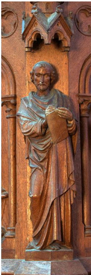
Détail d'une statuette de la cuve : saint Pierre. IVR22_20148000306NUC2A