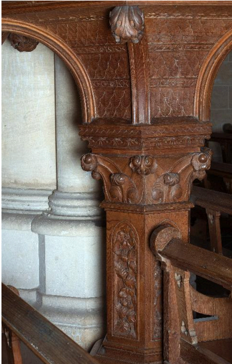
Détail du pied.