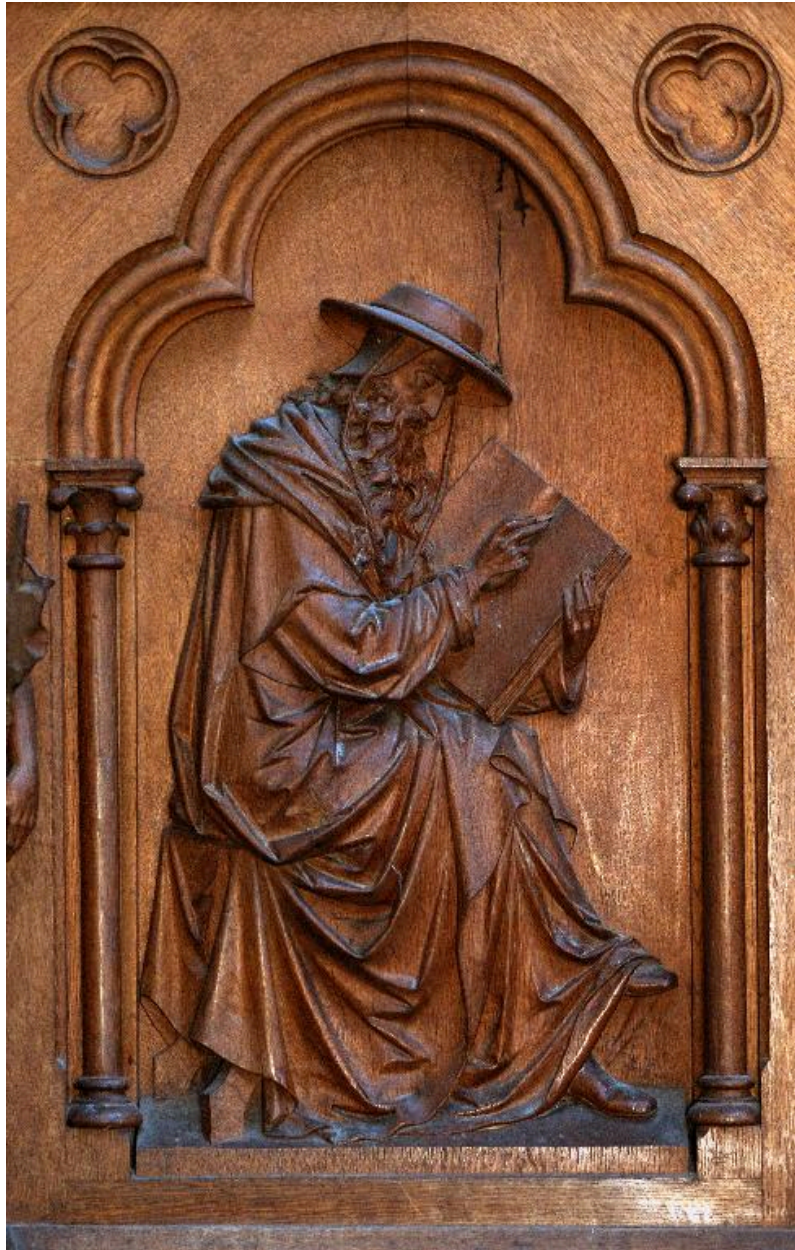
Détail d'un bas-relief de la cuve : saint Jérôme.