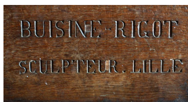
Détail de la signature sous la cuve : BUISINE RIGOT/ SCULPTEUR-LILLE.

IVR22_20148000207NUC2A