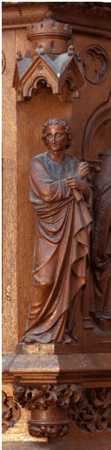
Détail d'une statuette de la cuve : saint Jean l'Évangéliste.