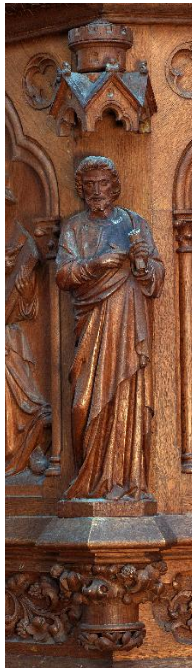
Détail d'une statuette de la cuve : saint Paul.