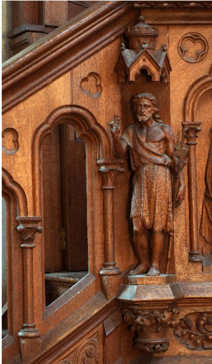
Détail d'une statuette de la cuve : saint Jean-Baptiste.