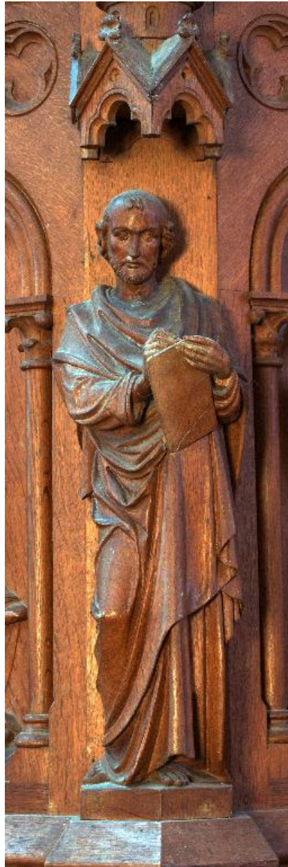
Détail d'une statuette de la cuve : saint Pierre.