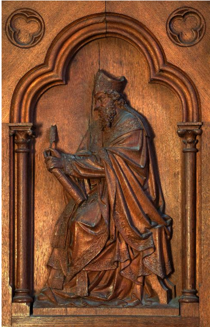
Détail d'un bas-relief de la cuve : saint Ambroise.