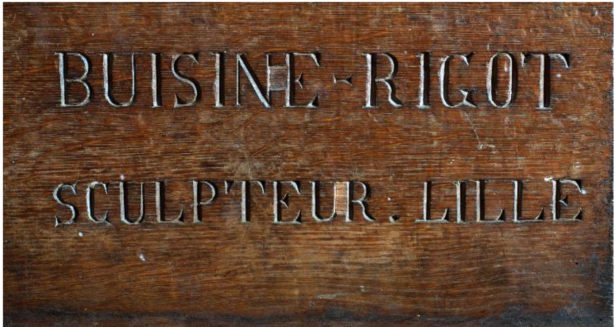
Détail de la signature sous la cuve : BUISINE RIGOT/SCULPTEUR-LILLE.