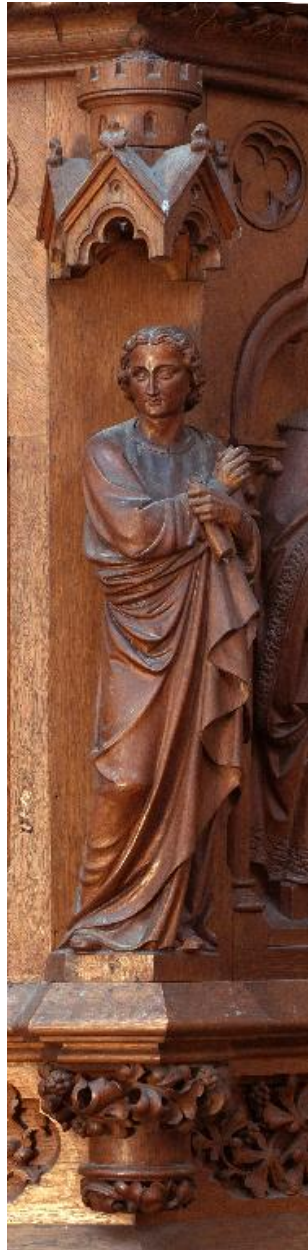
Détail d'une statuette de la cuve : saint Jean l'Évangéliste.