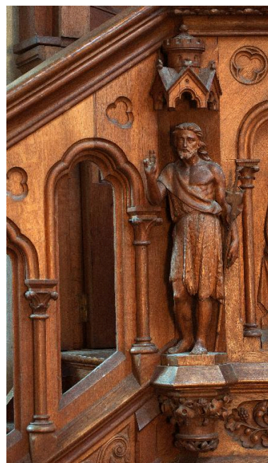
Détail d'une statuette de la cuve : saint Jean-Baptiste.

Phot. Marie-Laure Monnehay-Vulliet IVR22_20148000307NUC2A