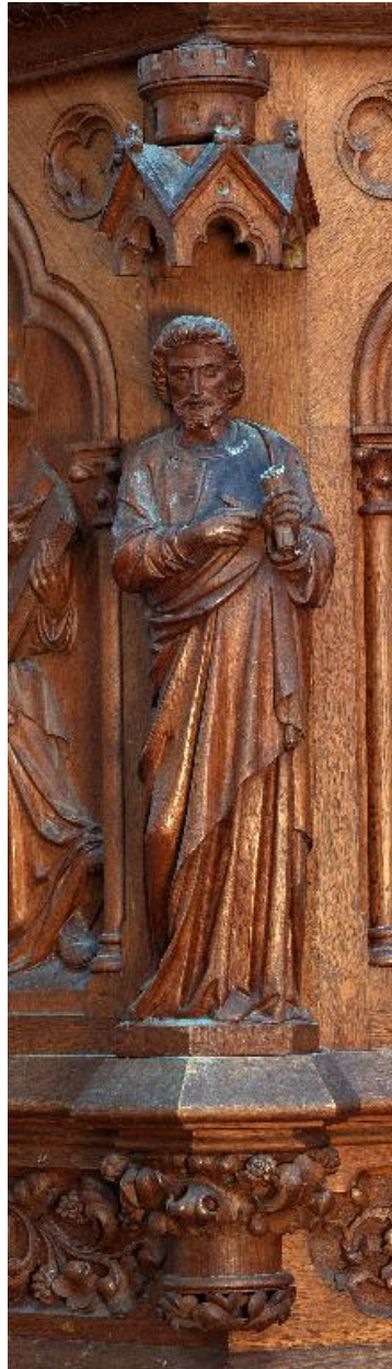
Détail d'une statuette de la cuve : saint Paul.