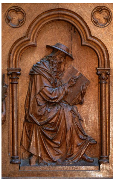
Détail d'un bas-relief de la cuve : saint Jérôme.

Phot. Marie-Laure Monnehay-Vulliet IVR22_20148000310NUC2A