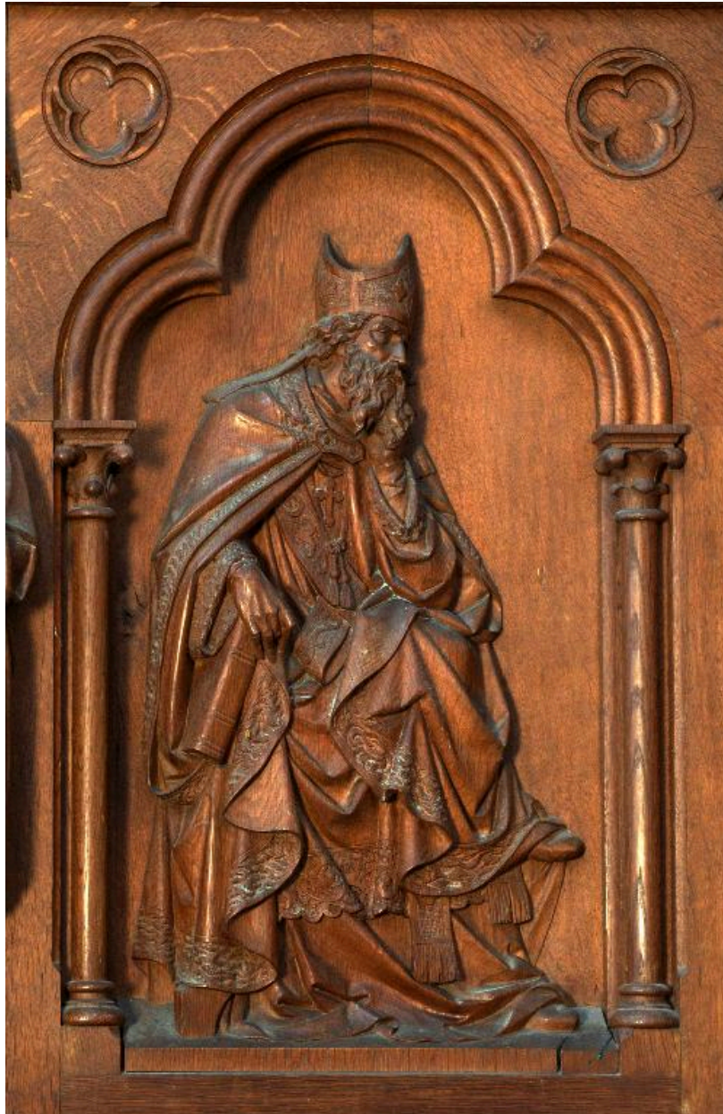
Détail d'un bas-relief de la cuve : saint Augustin.