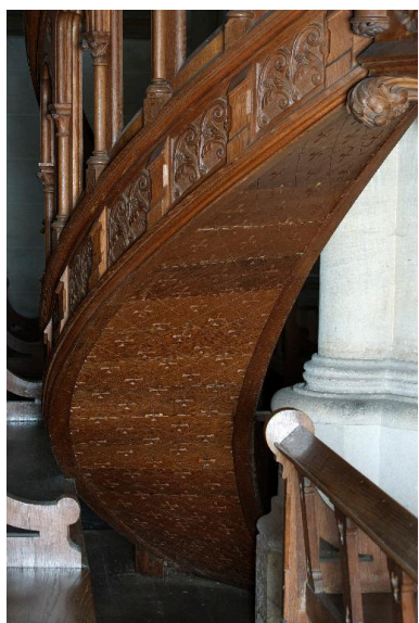
Détail de l'escalier.

Phot. Marie-Laure Monnehay-Vulliet IVR22_20148000310NUC2A