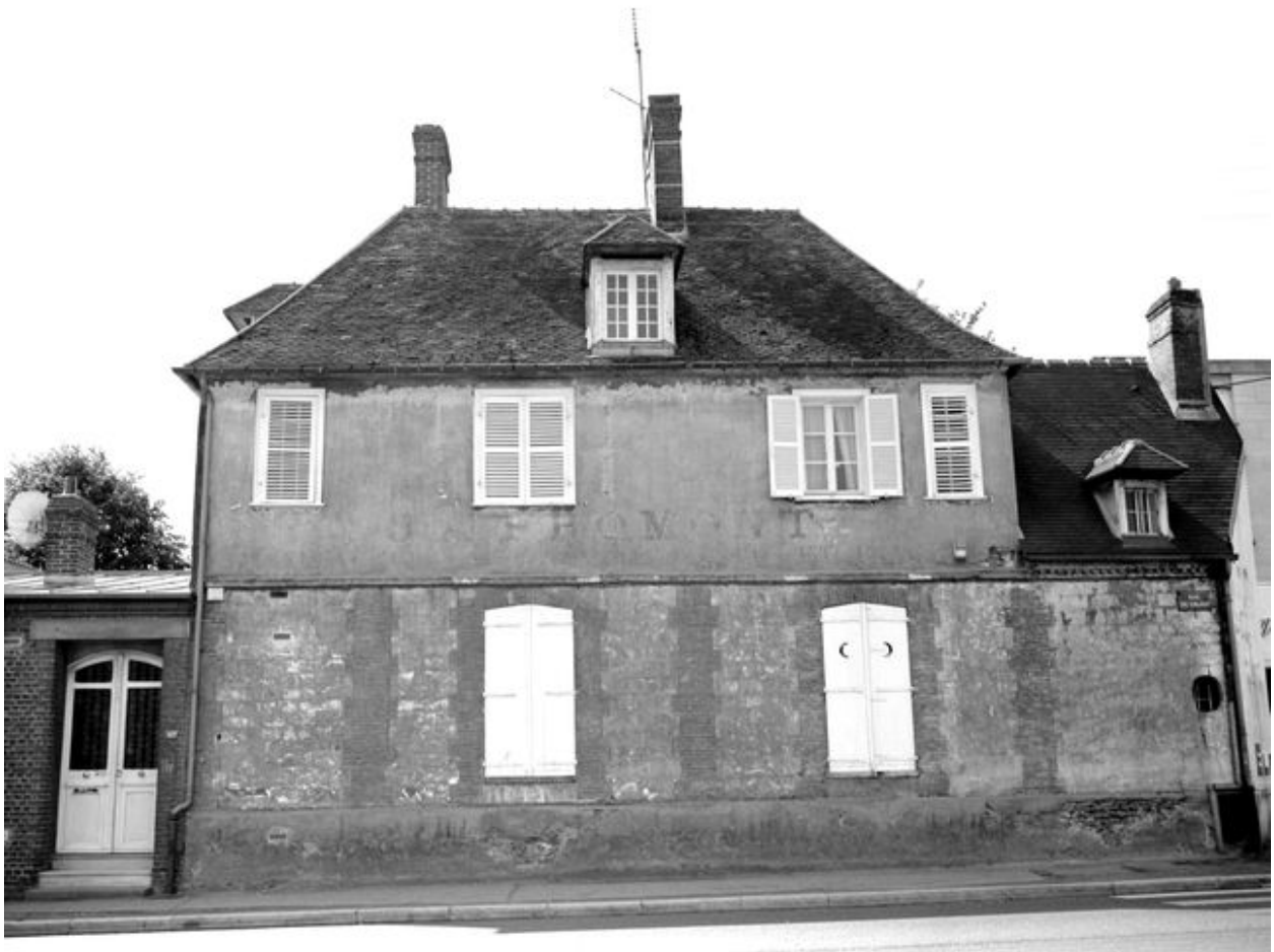
Façade sur rue du logement et du bureau de l'usine.