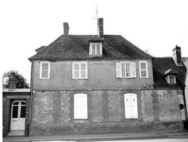
Façade sur rue du logement et du bureau de l'usine. IVR22_19966002708X