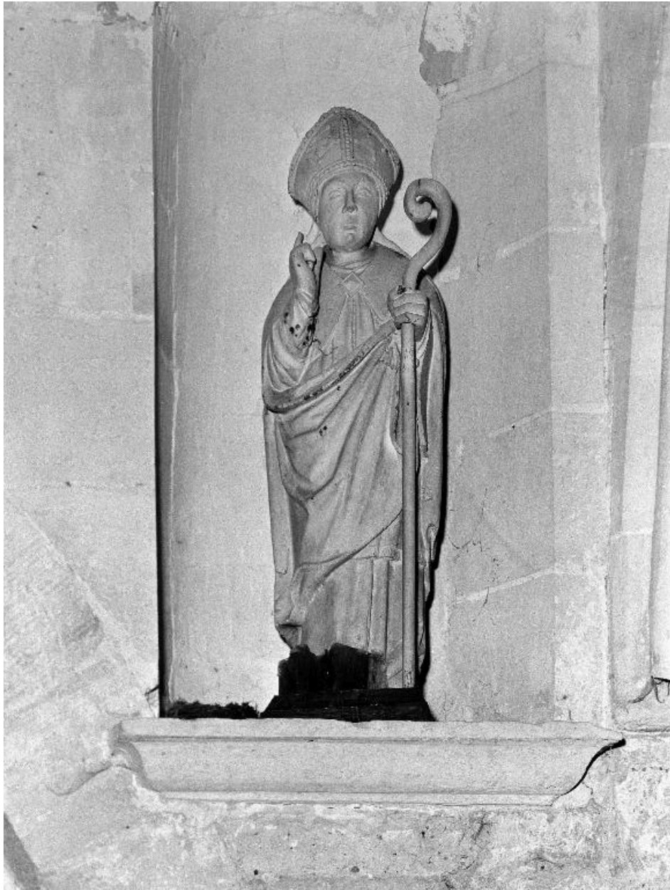
Vue générale de la statue.