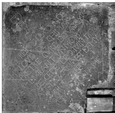
Vue d'une dalle funéraire de Louis de Chimay, décédé en 1703.