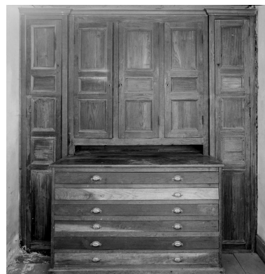
Vue d'ensemble d'un meuble de sacristie.