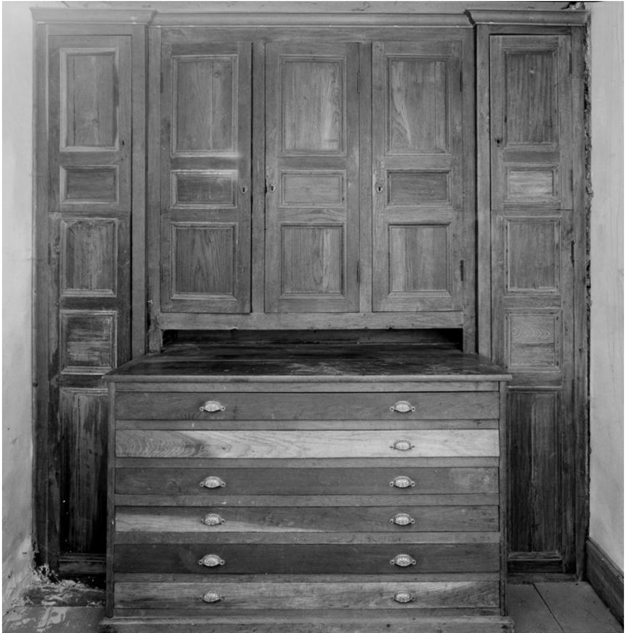
Vue d'ensemble d'un meuble de sacristie.