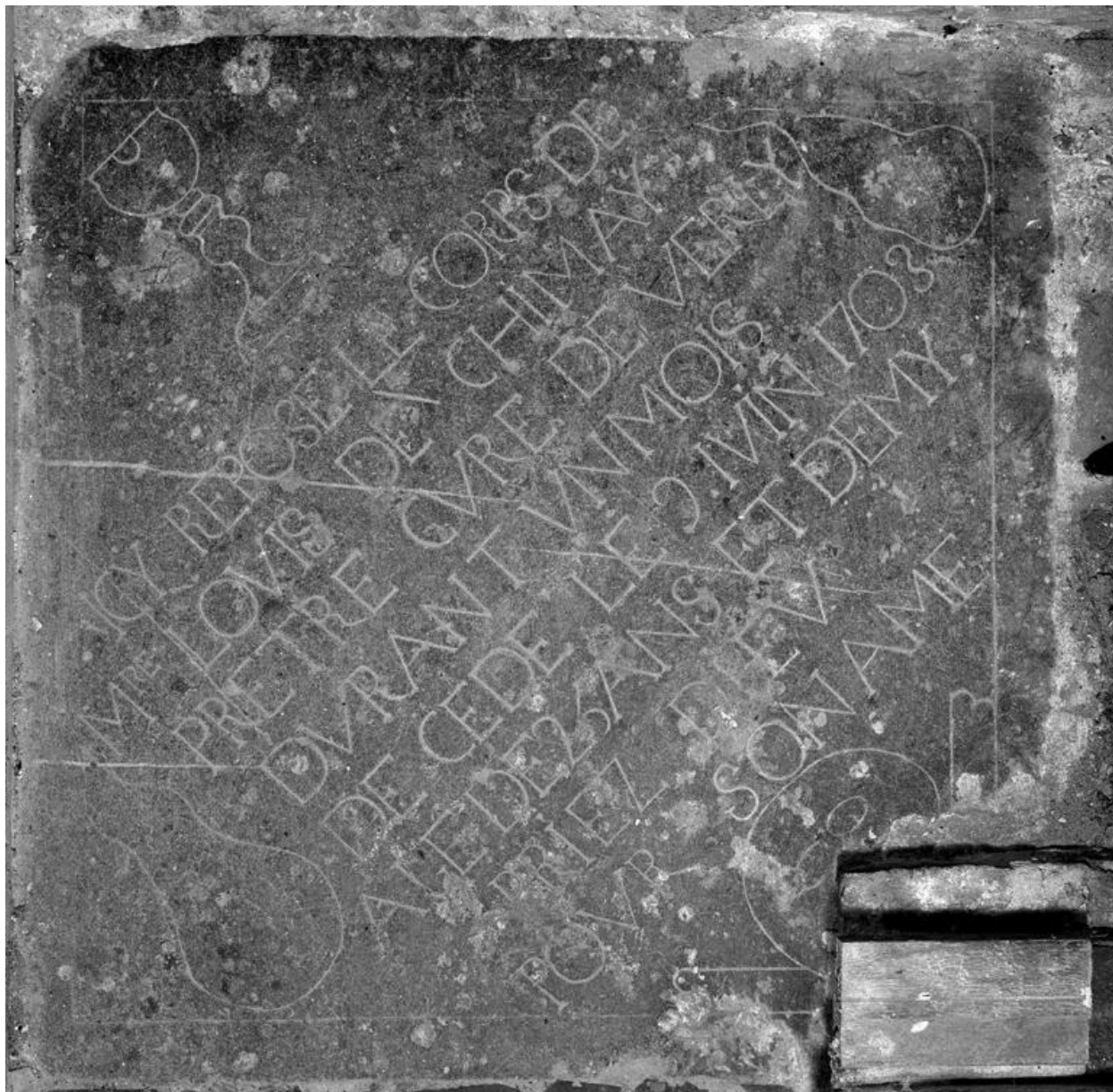
Vue d'une dalle funéraire de Louis de Chimay, décédé en 1703.