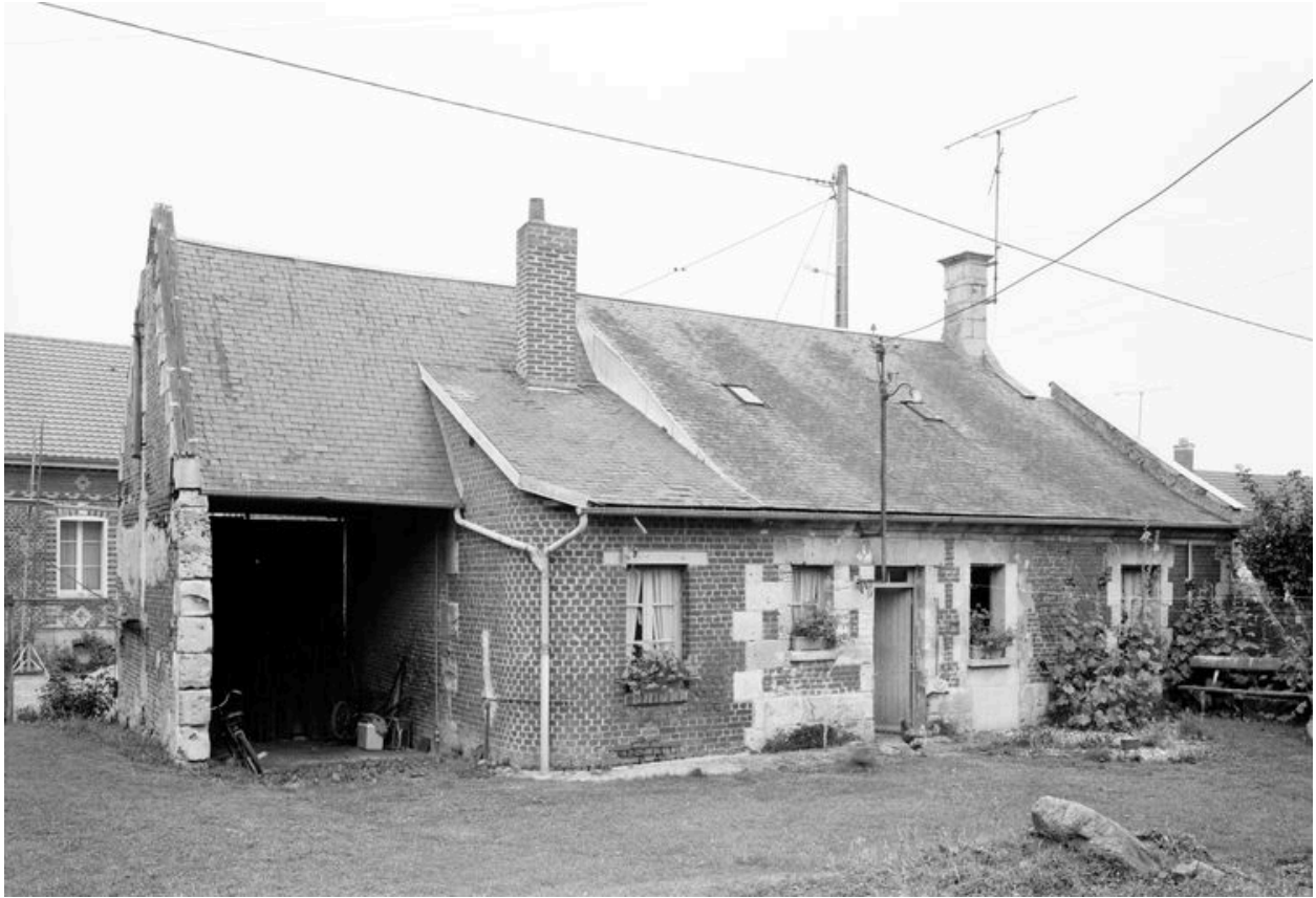
Logis. Élévation postérieure.