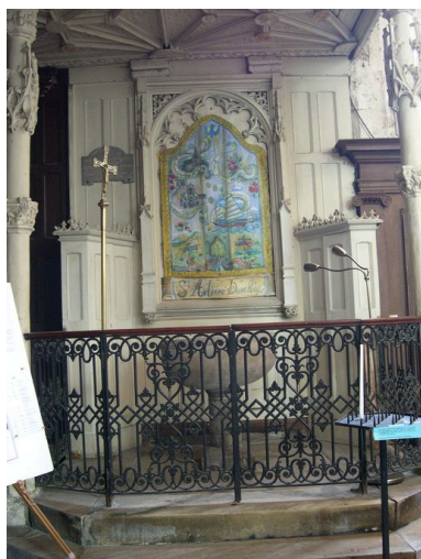
Chapelle des Fonts.