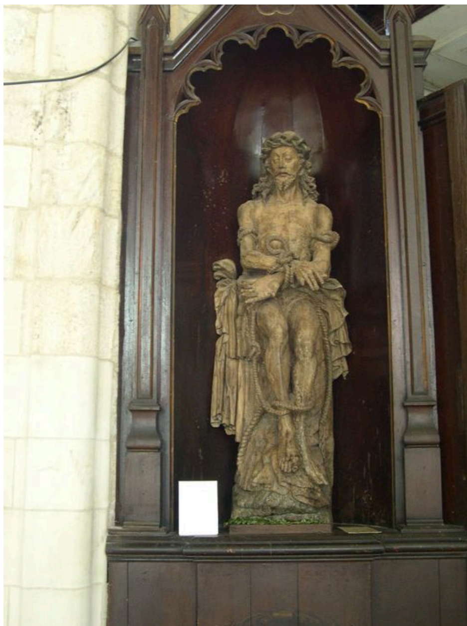
Statue du Christ aux liens (Cl. MH).