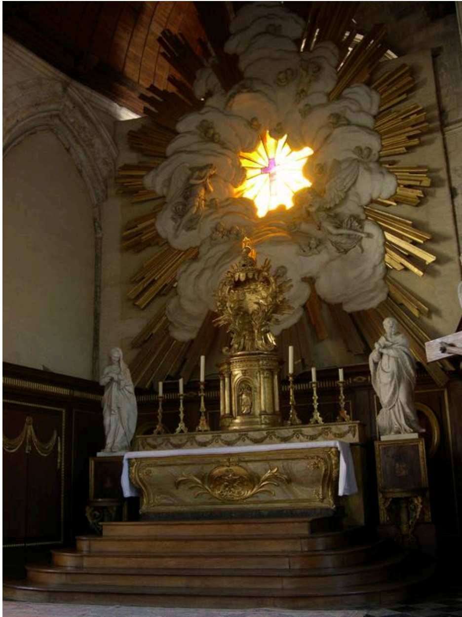
Vue du maître-autel.