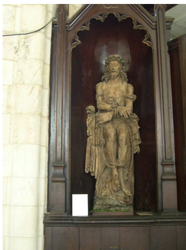
Statue du Christ aux liens (Cl. MH).