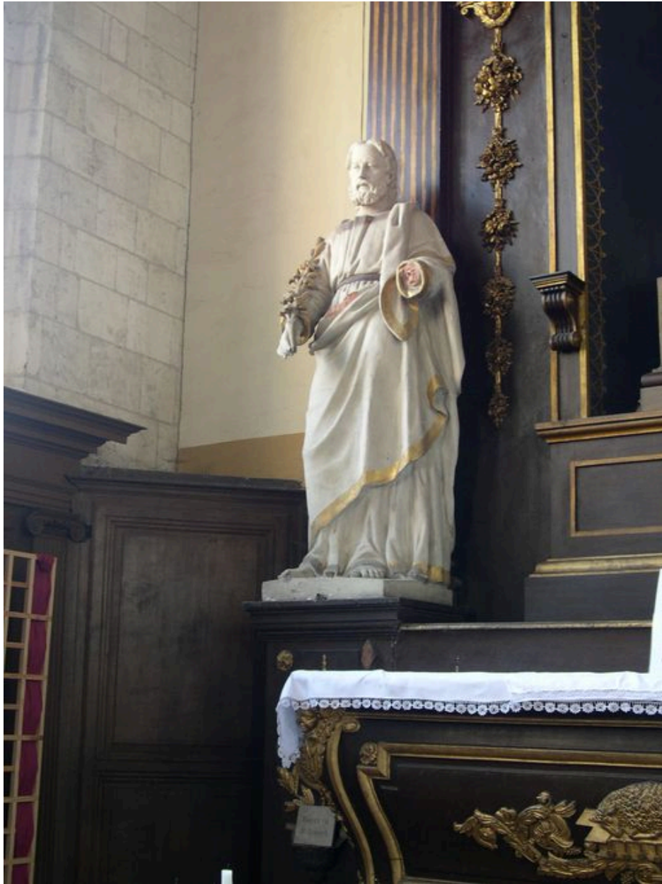
Statue de saint Joseph.