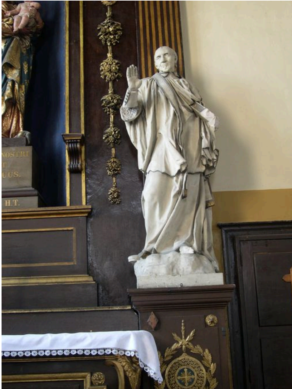
Statue de saint Vincent de Paul.