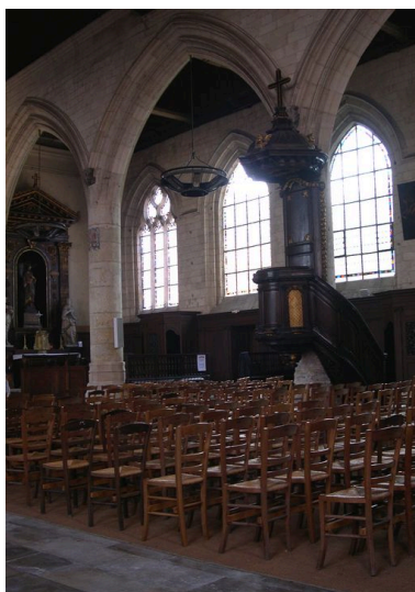
La chaire à prêcher. IVR22_20068010674NUCA