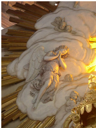
Détail de la gloire.