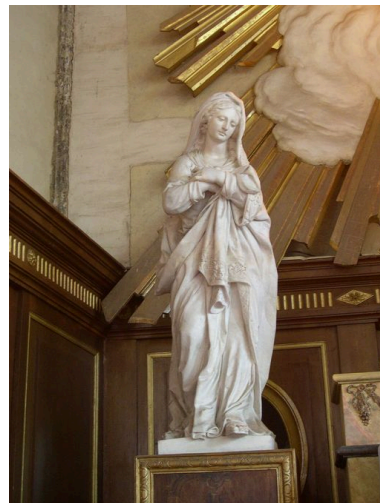
Statue de la Vierge