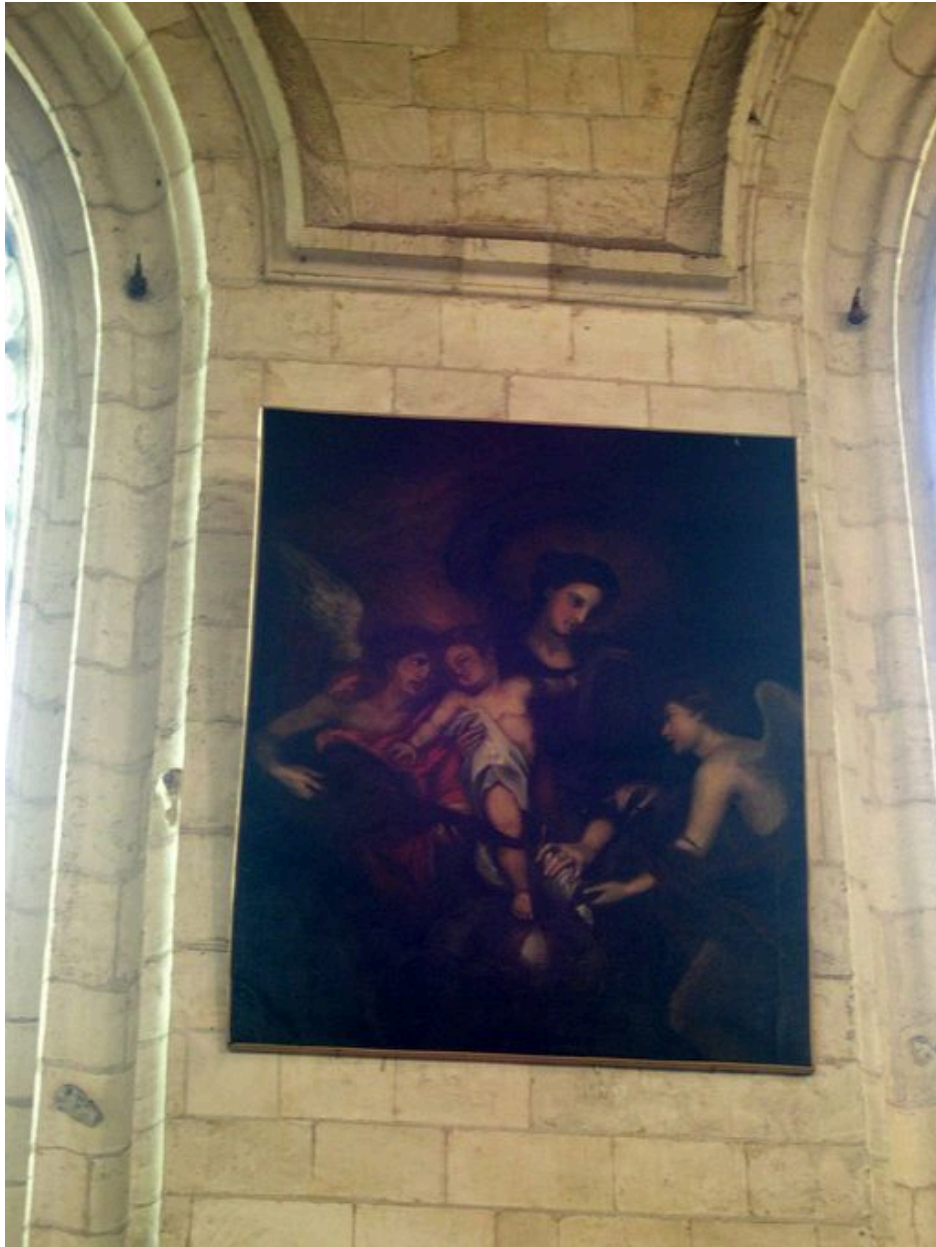
Tableau : Vierge et anges musiciens, copie d'après Anton Van Dyck.