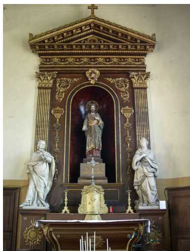
Autel du Sacré-Coeur.