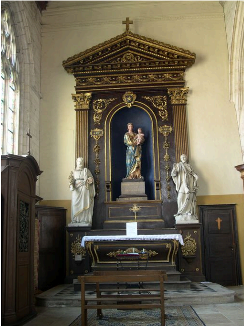
Autel de la Vierge.