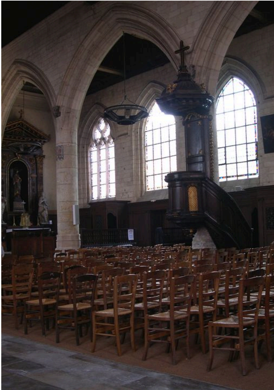
La chaire à prêcher.