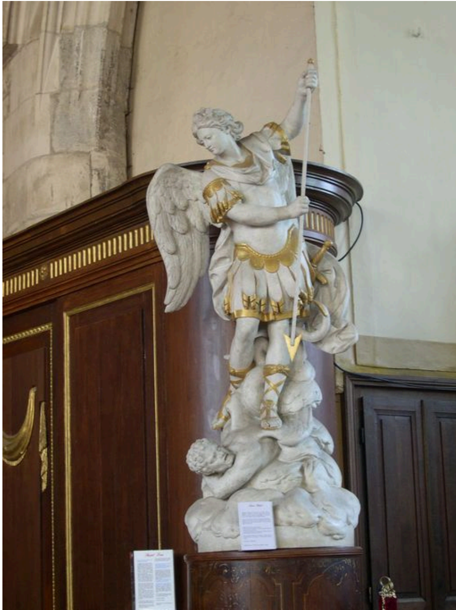
Statue de saint Michel.