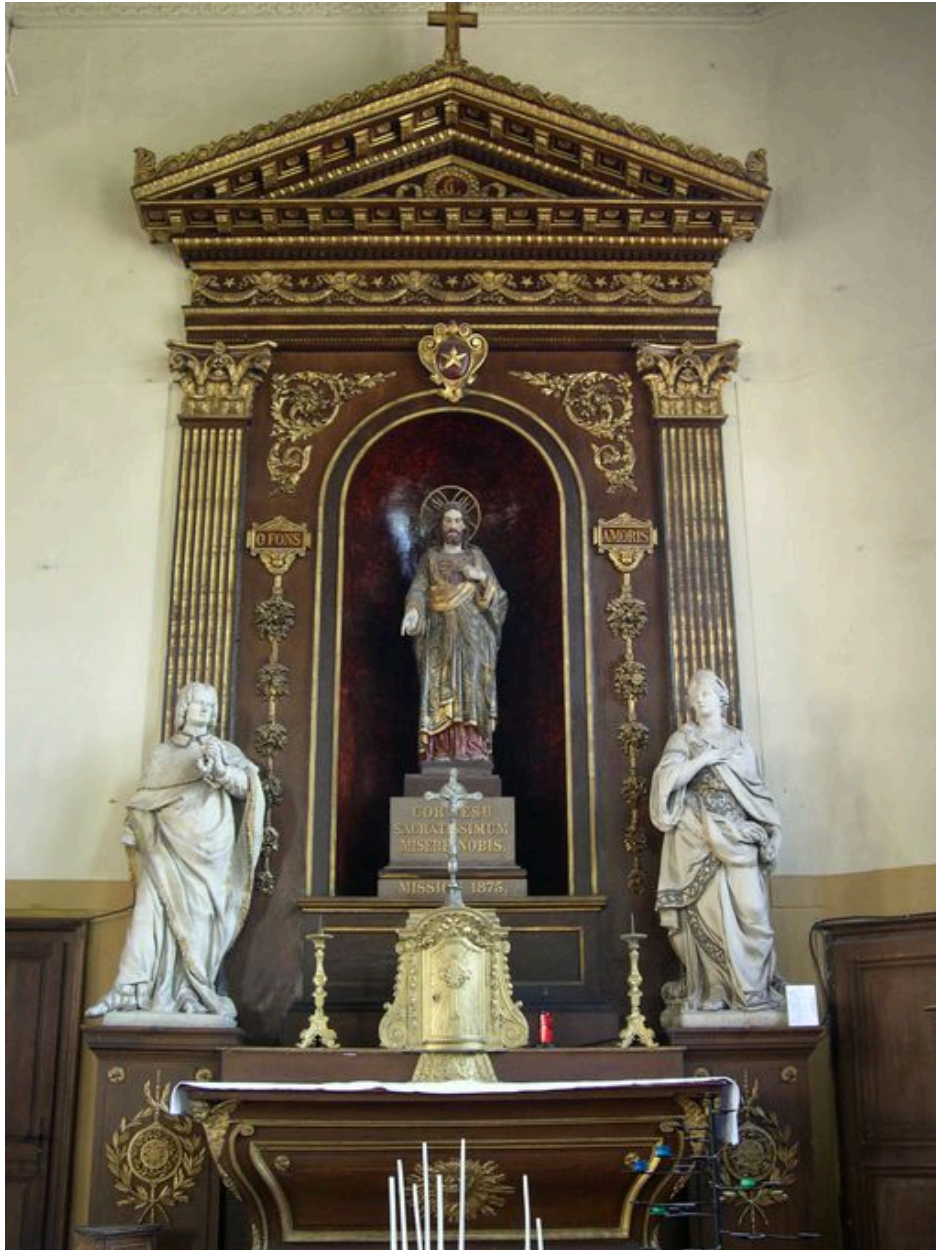
Autel du Sacré-Coeur.