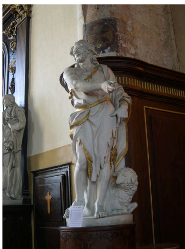
Statue de saint Jean-Baptiste (Cl. MH). IVR22_20068010665NUCA