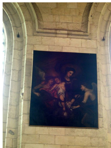
Tableau : Vierge et anges musiciens, copie d'après Anton Van Dyck. IVR22_20068010672NUCA