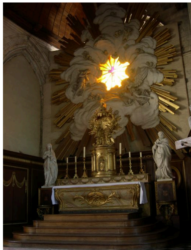
Vue du maître-autel. IVR22_20068010661NUCA