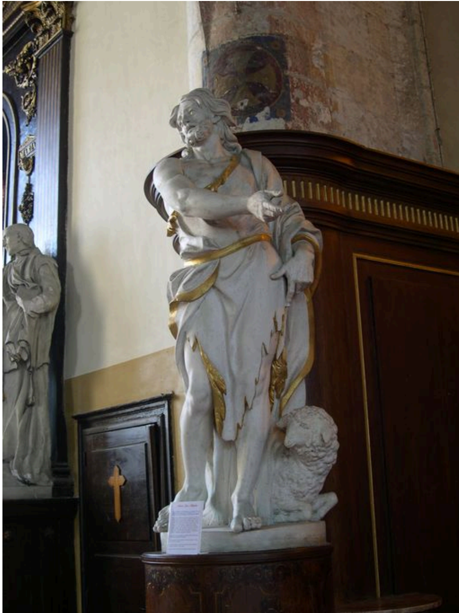
Statue de saint Jean-Baptiste (Cl. MH).