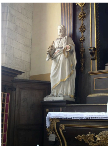
Statue de saint Joseph.