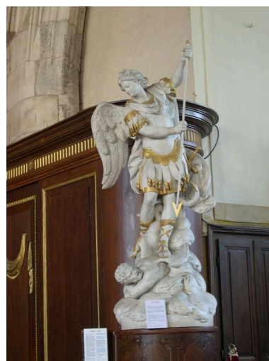
Statue de saint Michel (Cl. MH). IVR22_20068010666NUCA