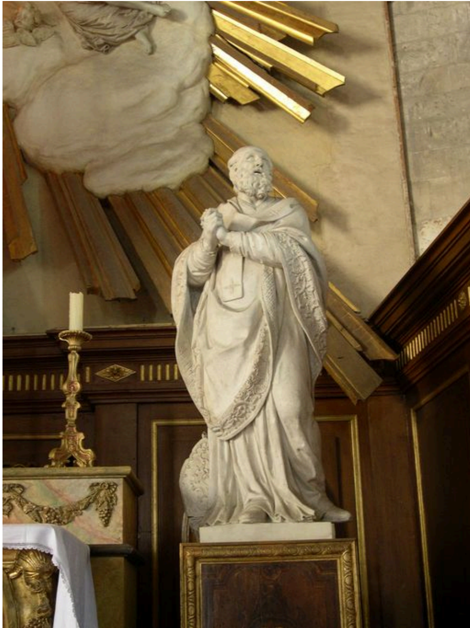
Statue de saint Augustin (Cl. MH).