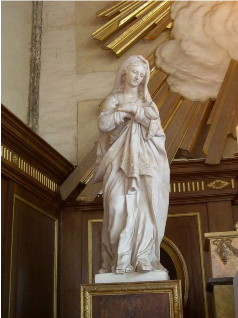
Statue de la Vierge (Cl. MH).