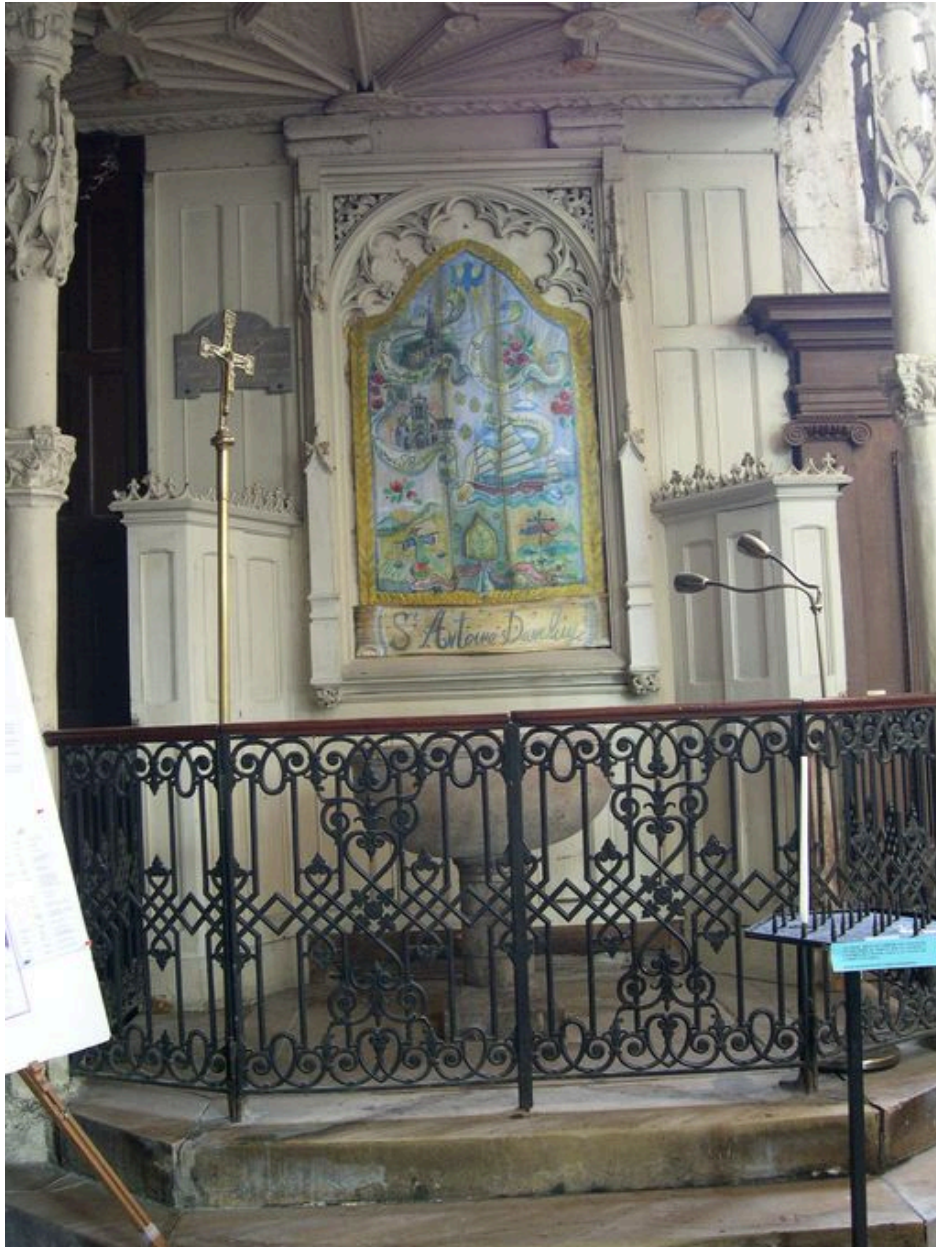
Chapelle des Fonts.