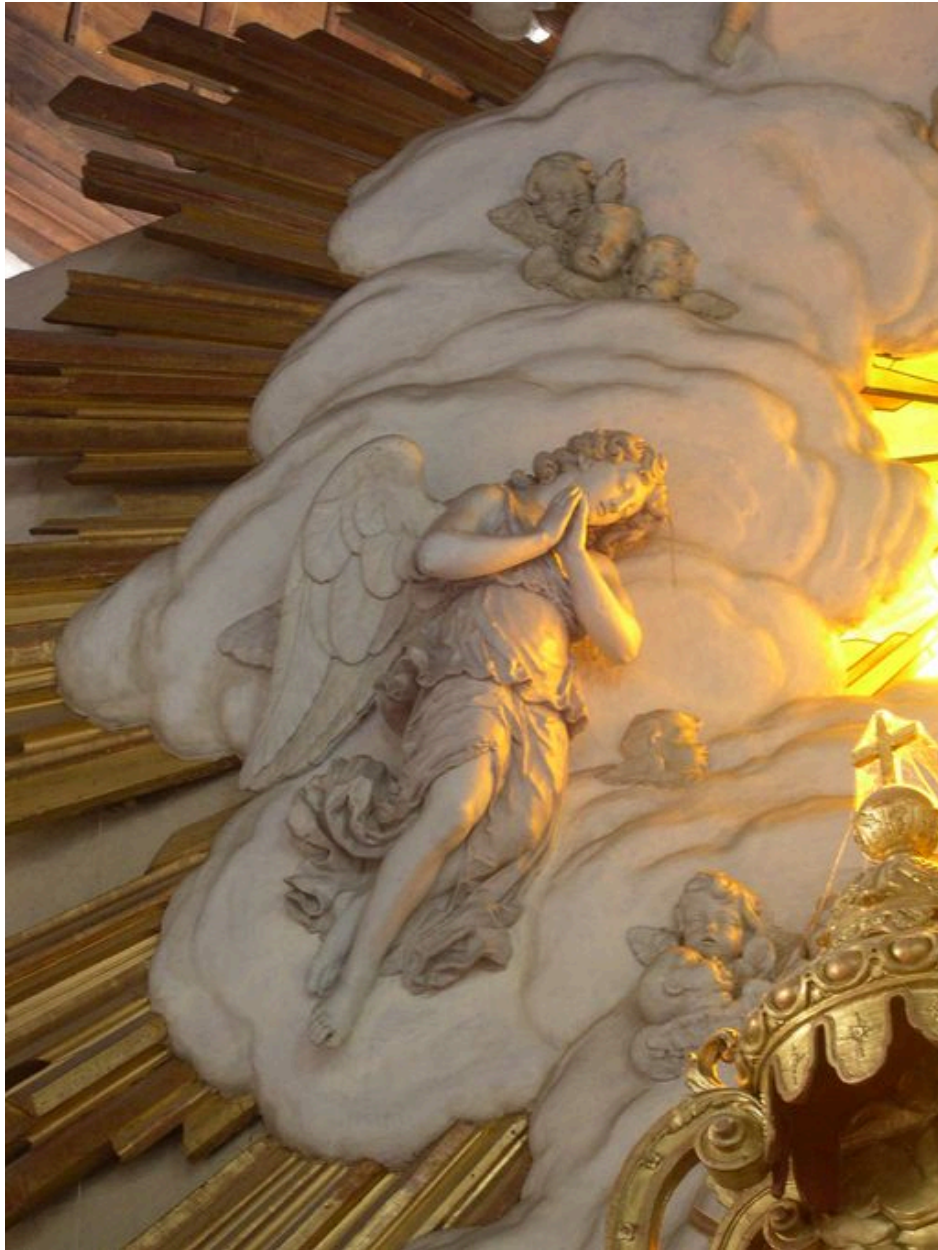
Détail de la gloire.