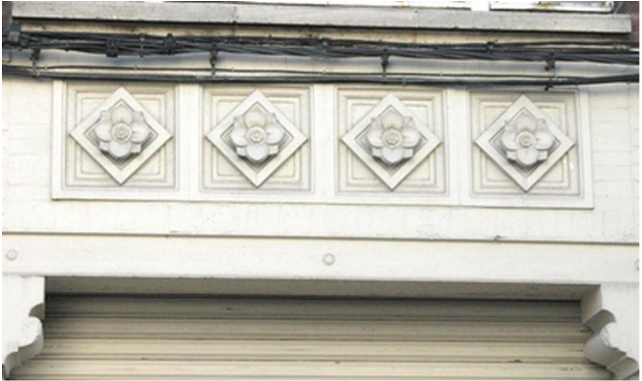
Détail de la façade de la coopérative.