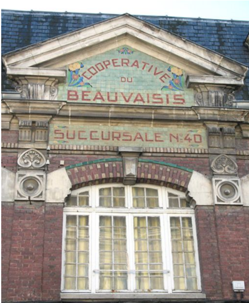
Fronton de la coopérative du Beauvaisis.