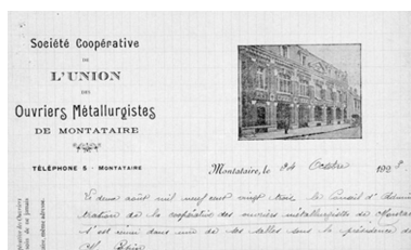
Papier à lettre à en-tête de la coopérative, 1923.