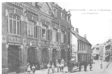
Le magasin coopératif porte la mention du siège social du syndicat des ouvriers métallurgistes de l'Oise (AC Montataire). IVR22_20086005121NUCAB