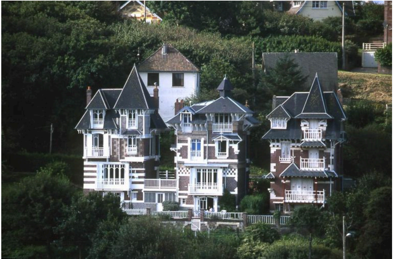
Vue générale des 'Trois chalets' avec Les Garamantes à droite.