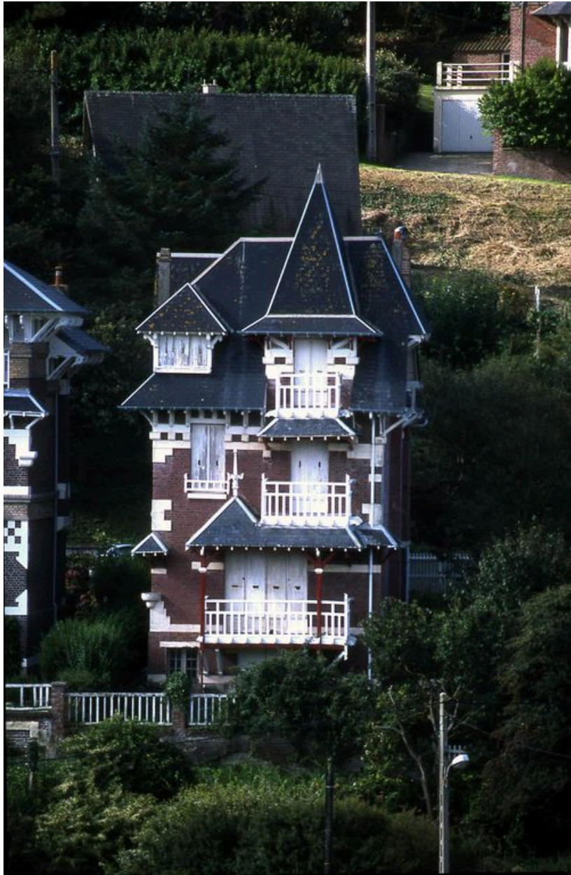
Elévation côté mer.