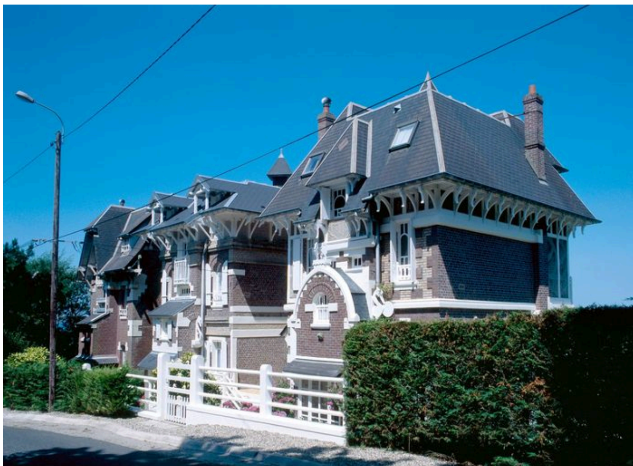
Vue d'ensemble des 'Trois chalets', élévations postérieures.