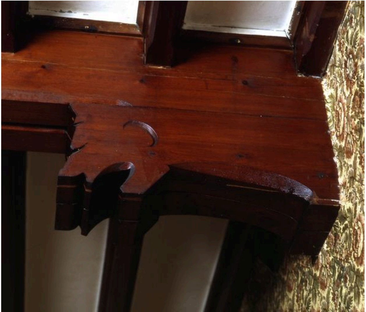
Détail d'une console du 'hall' figurant un animal.