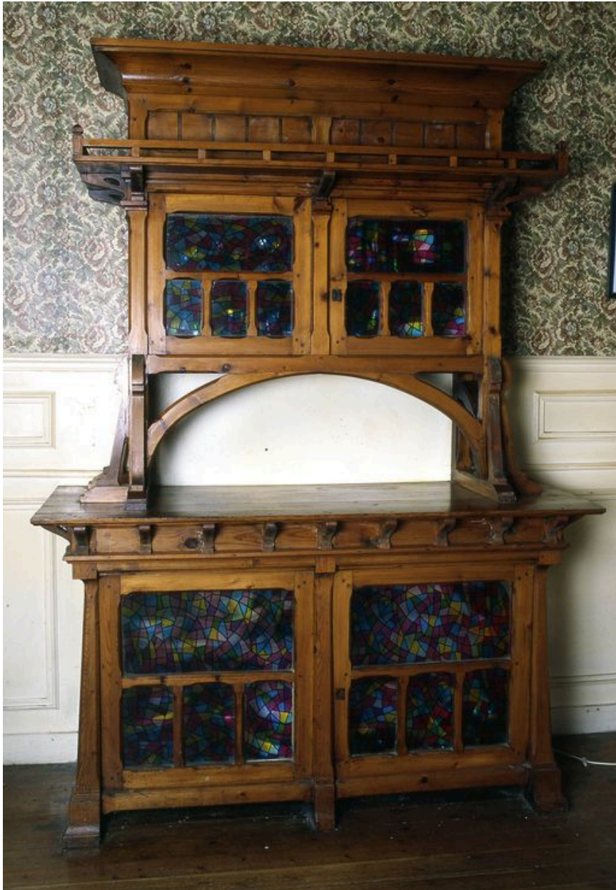
Buffet du 'hall'.