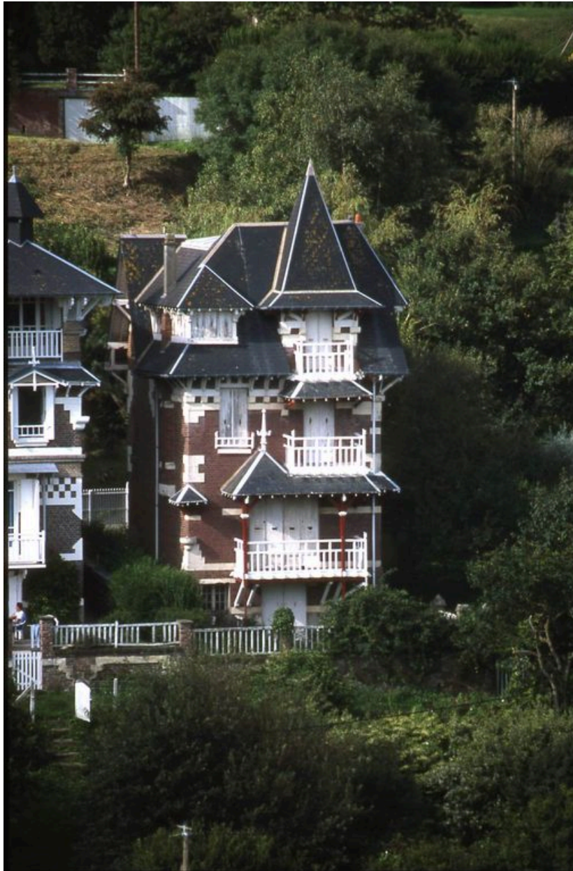
Elévation côté mer.