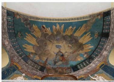
Cul-de-four. IVR22_20128001315NUC2A