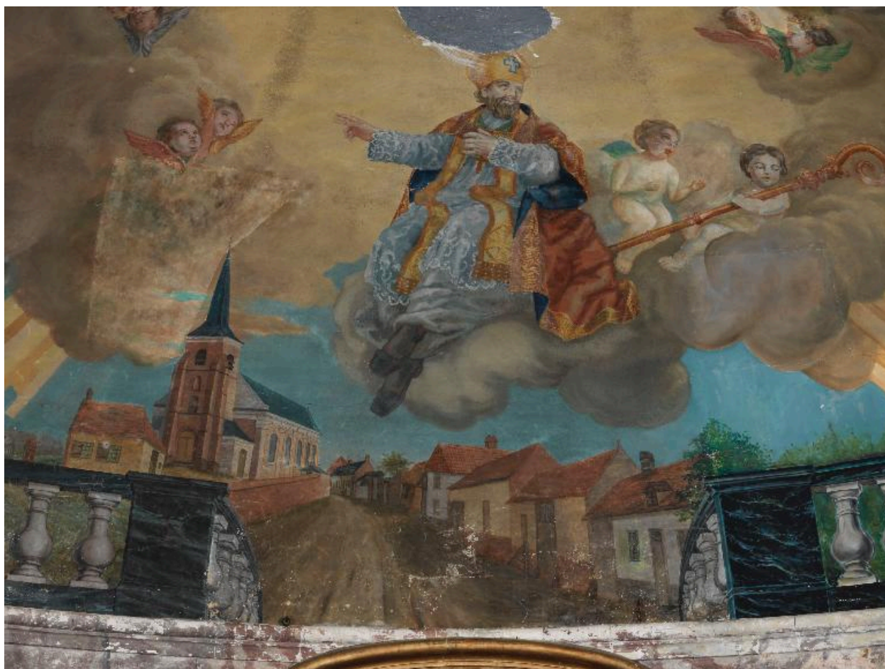
Détail du cul-de-four : Saint-Martin en gloire bénissant le village de Bettencourt-Saint-Ouen.