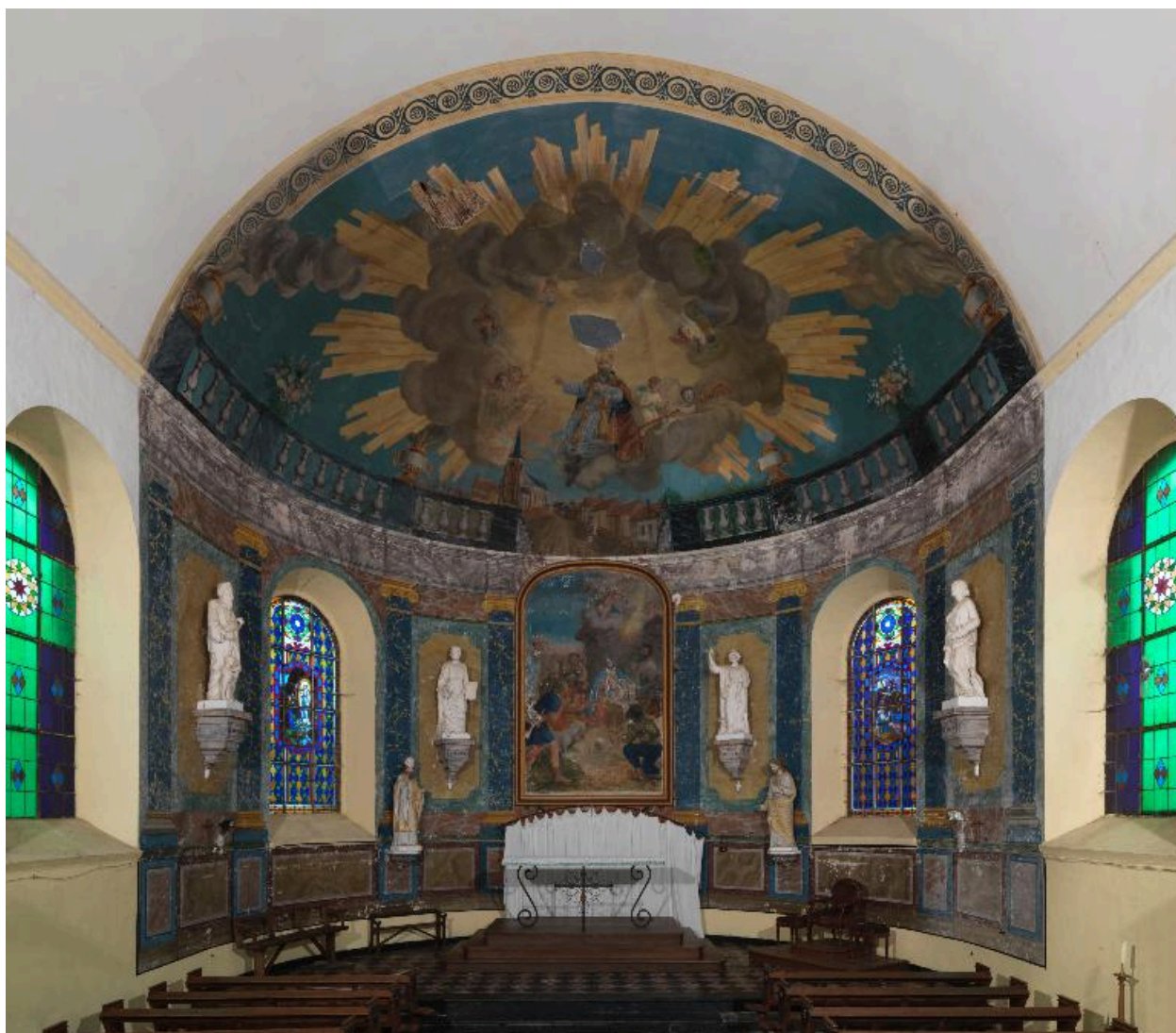
Vue générale du choeur.