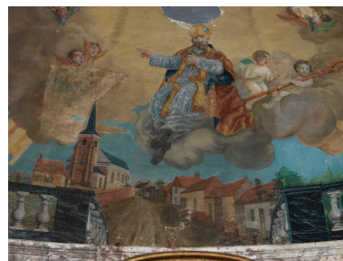
Détail du cul-de-four : Saint- Martin en gloire bénissant le village de Bettencourt-Saint-Ouen.