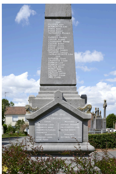
Détail du monument, côté droit. IVR32_20235901203NUCA