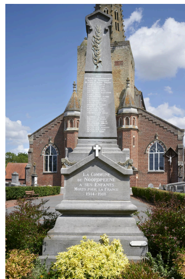
Face avant.