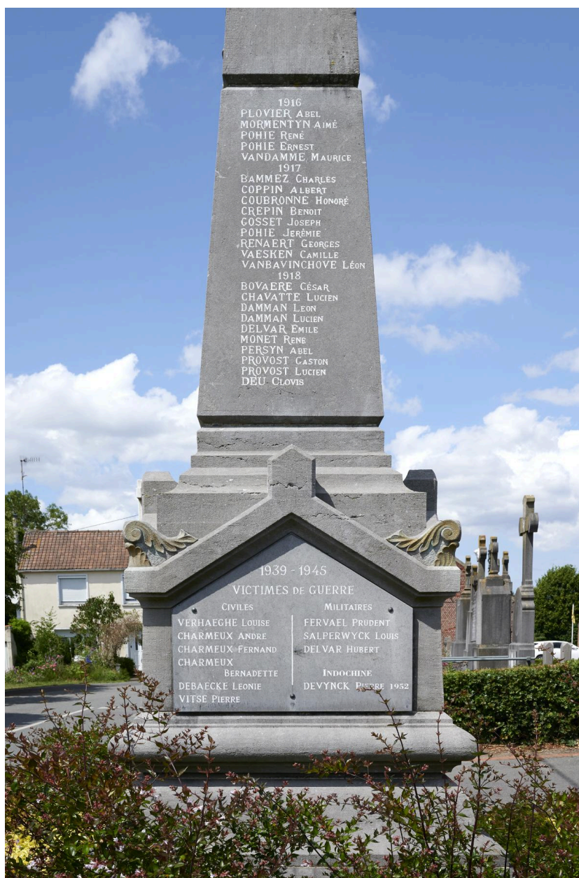
Détail du monument, côté droit.