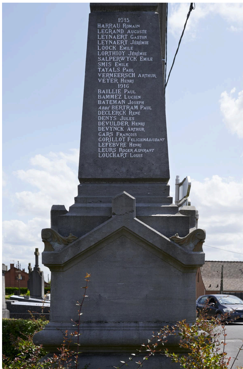
Détail du côté gauche.