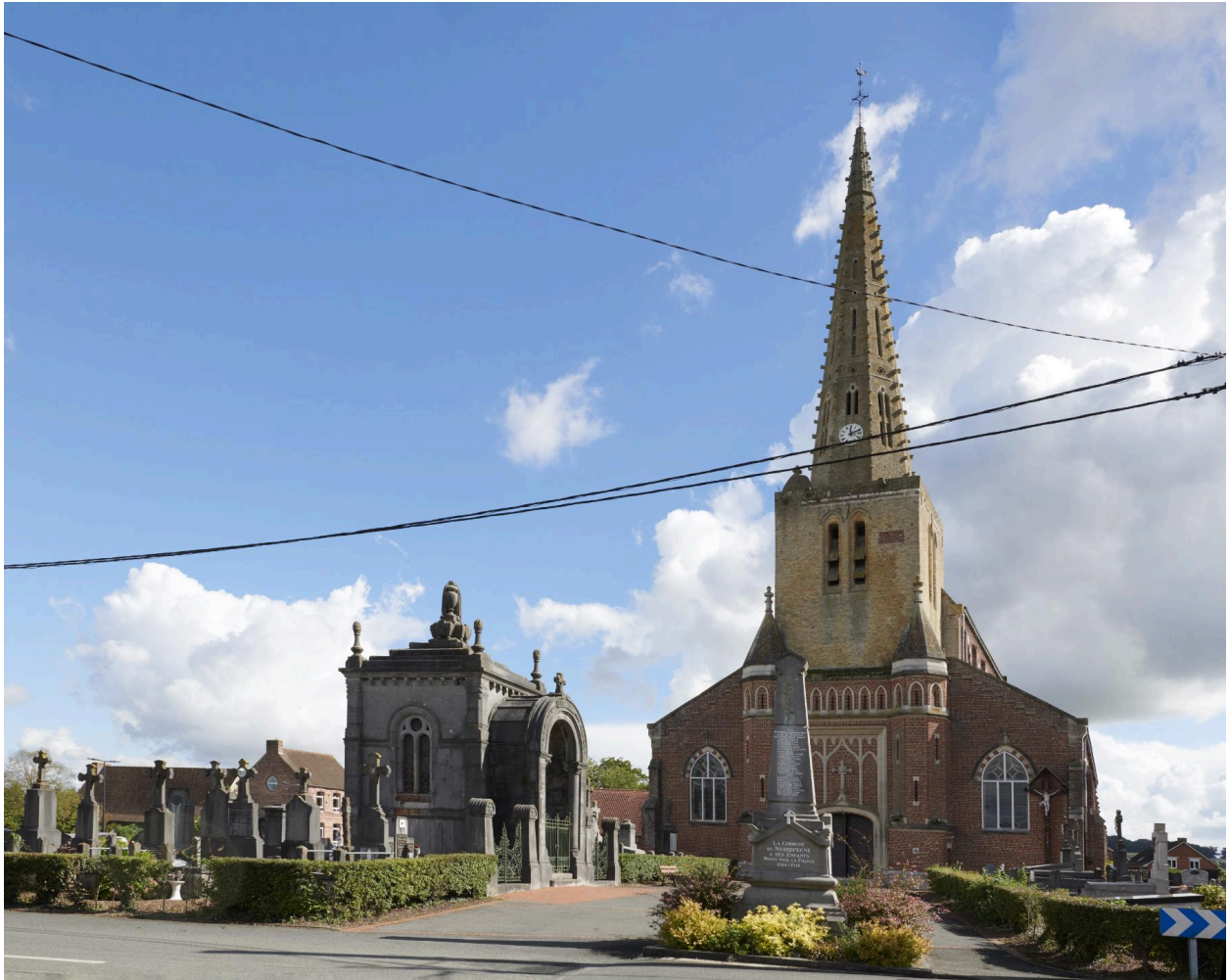
Monument dans son environnement direct.