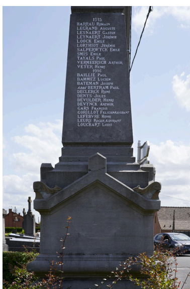
Détail du côté gauche. IVR32_20235901204NUCA