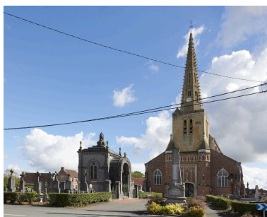
Monument dans son environnement direct.