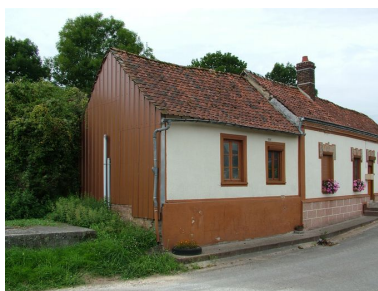
Vue générale. IVR22_20098005261NUCA