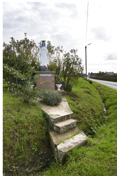
Détail de la structure générale de l'oratoire. IVR32_20255900837NUCA