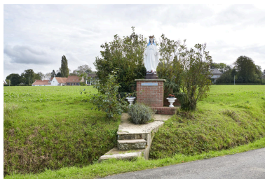
Oratoire et ponceau qui enjambe le fossé. IVR32_20255900836NUCA