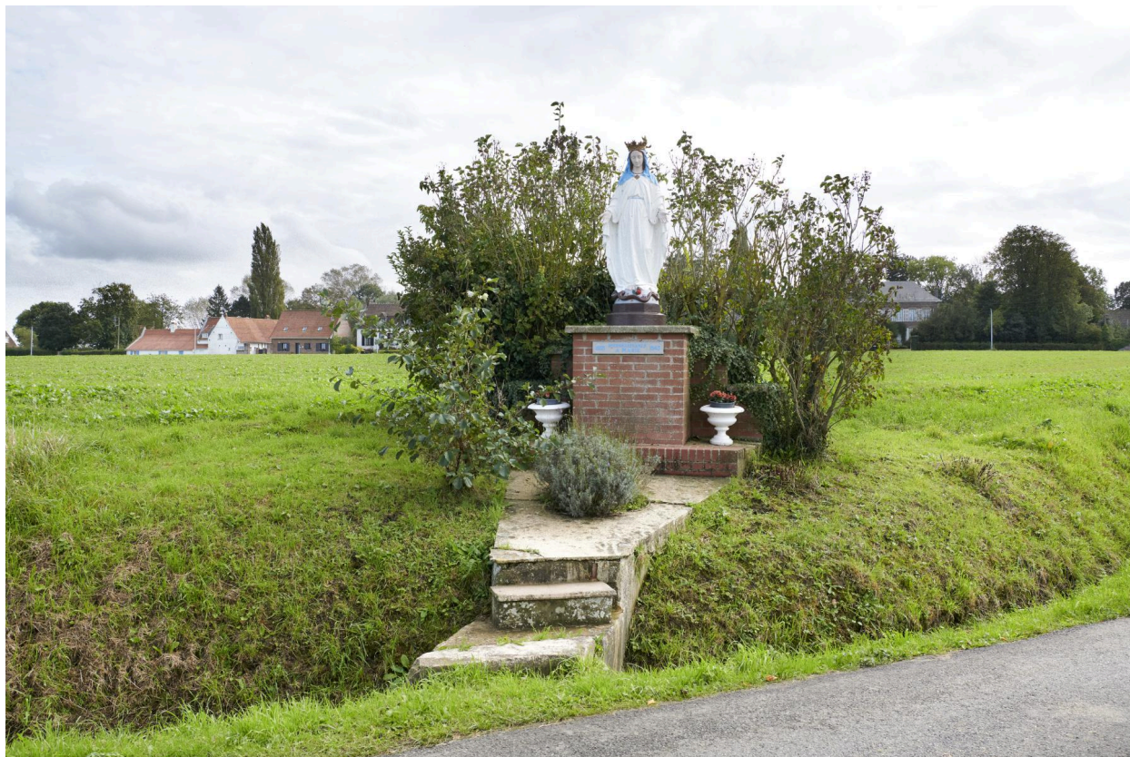
Oratoire et ponceau qui enjambe le fossé.