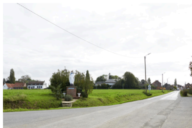
Environnement de l'oratoire. IVR32_20255900835NUCA