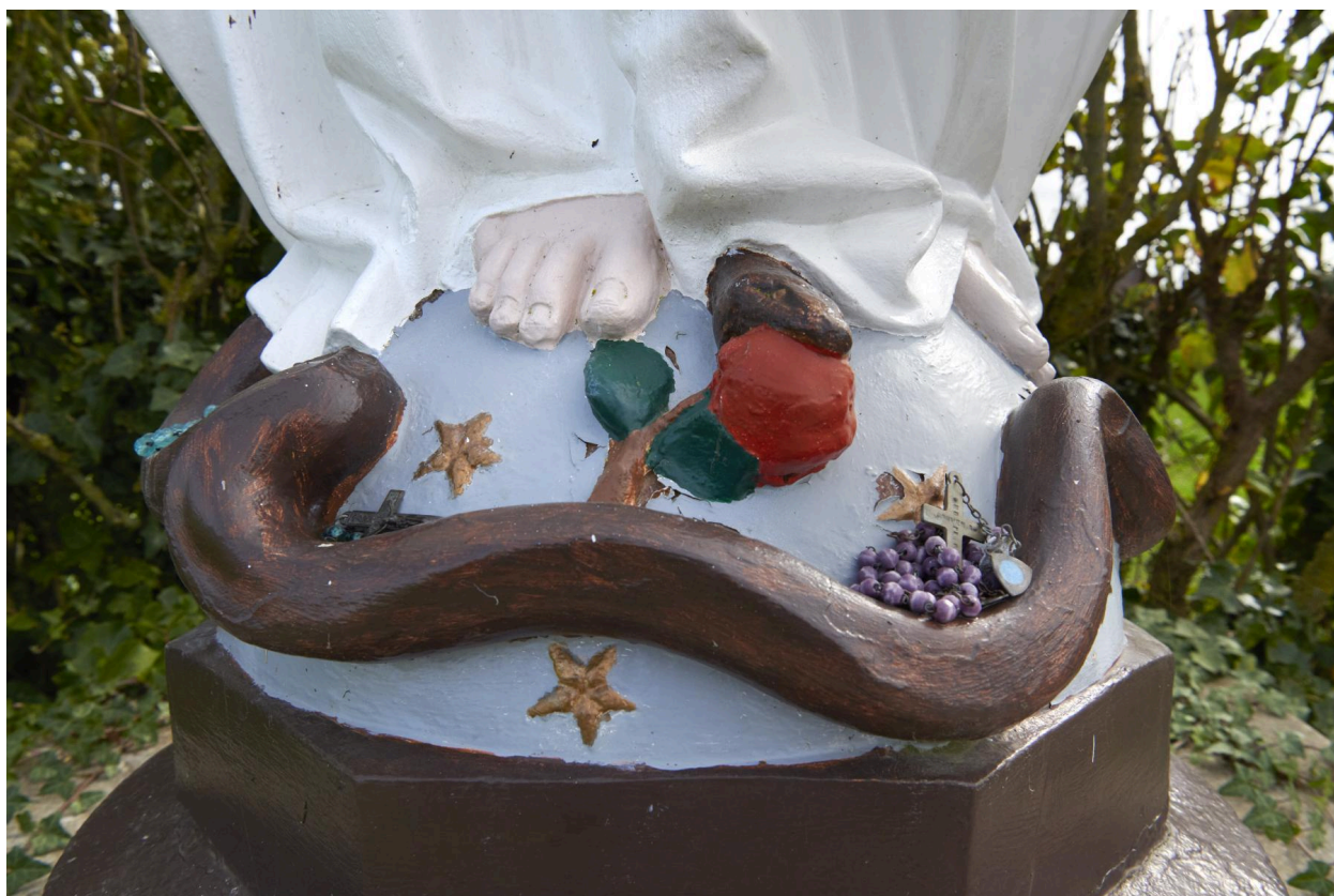
Détail de la partie inférieure de la statue.