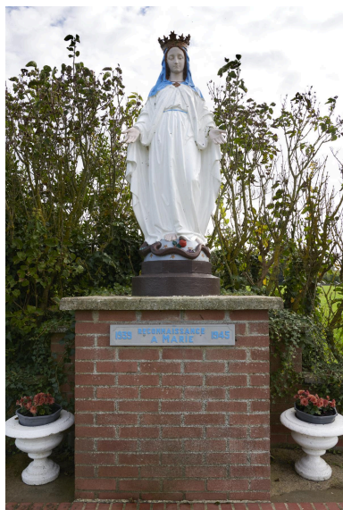
Détail du socle en brique et de la statue mariale. IVR32_20255900838NUCA