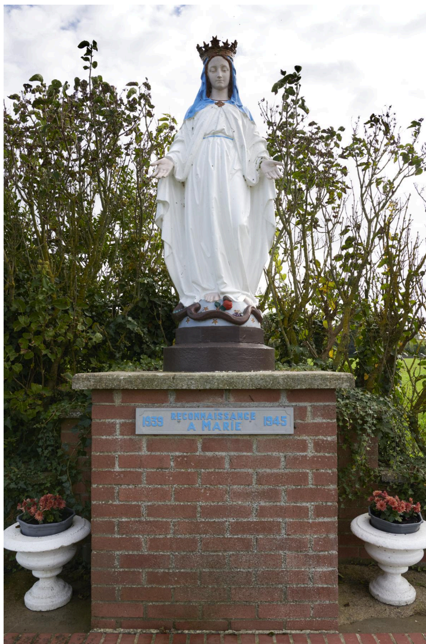
Détail du socle en brique et de la statue mariale.