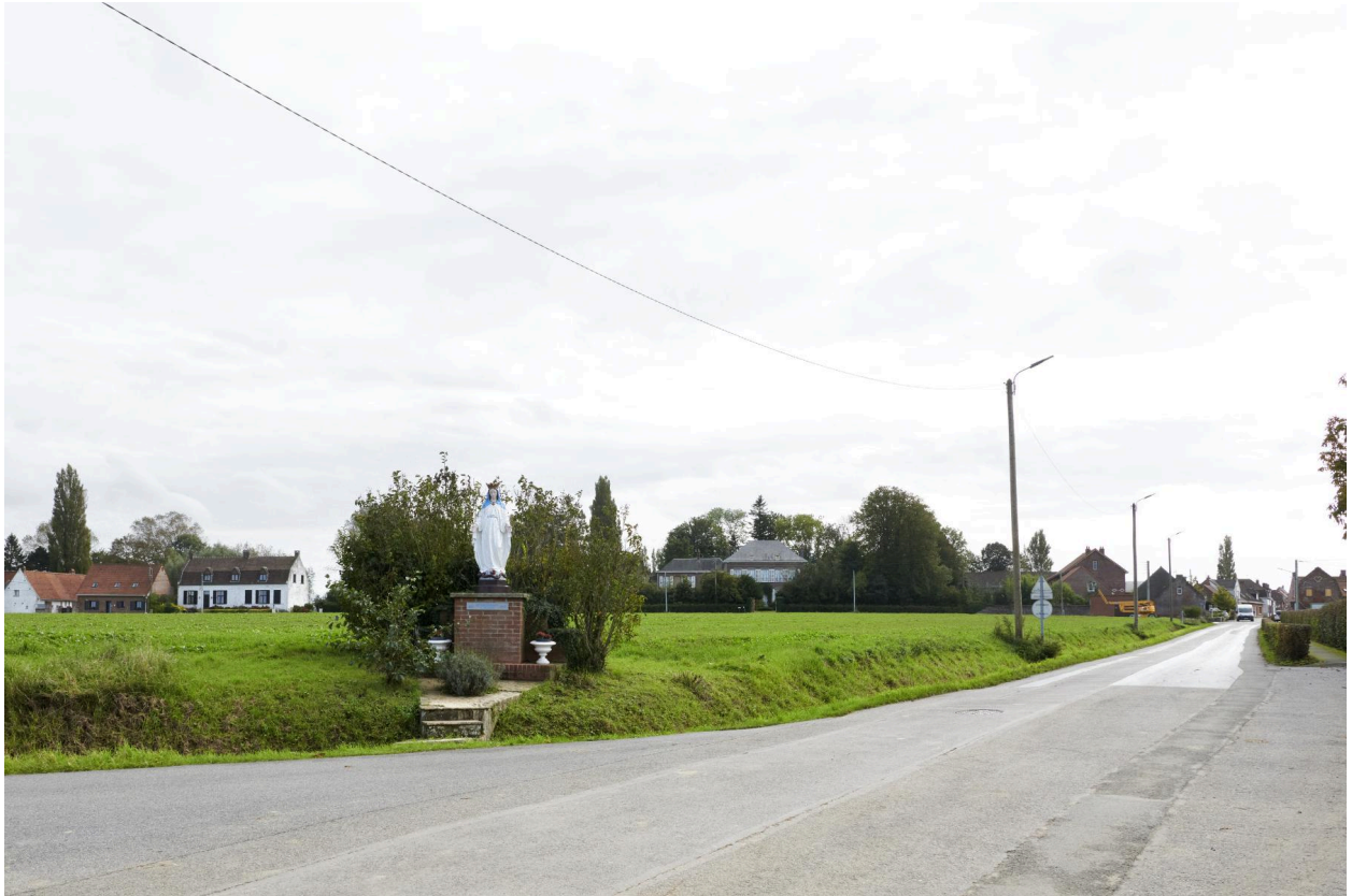
Environnement de l'oratoire.