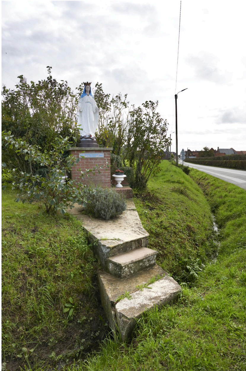
Détail de la structure générale de l'oratoire.