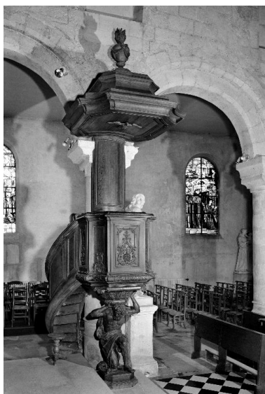
La chaire, vue de trois-quarts. IVR22_19860200289X