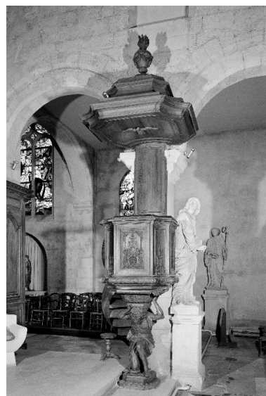
La chaire, vue de trois-quarts. IVR22_19860200290X