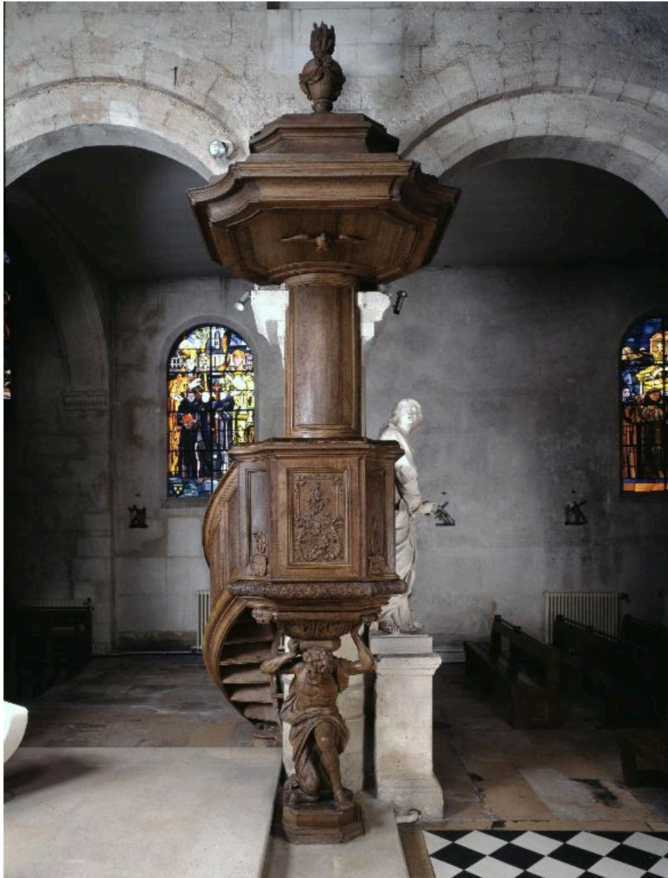
La chaire, vue de face.