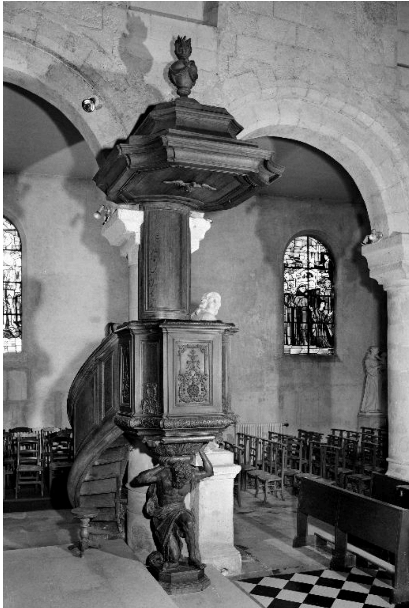
La chaire, vue de trois-quarts.