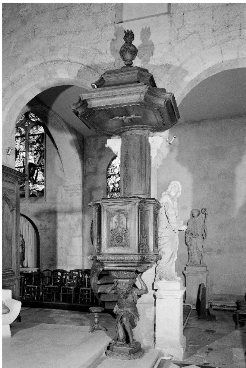
La chaire, vue de trois-quarts.