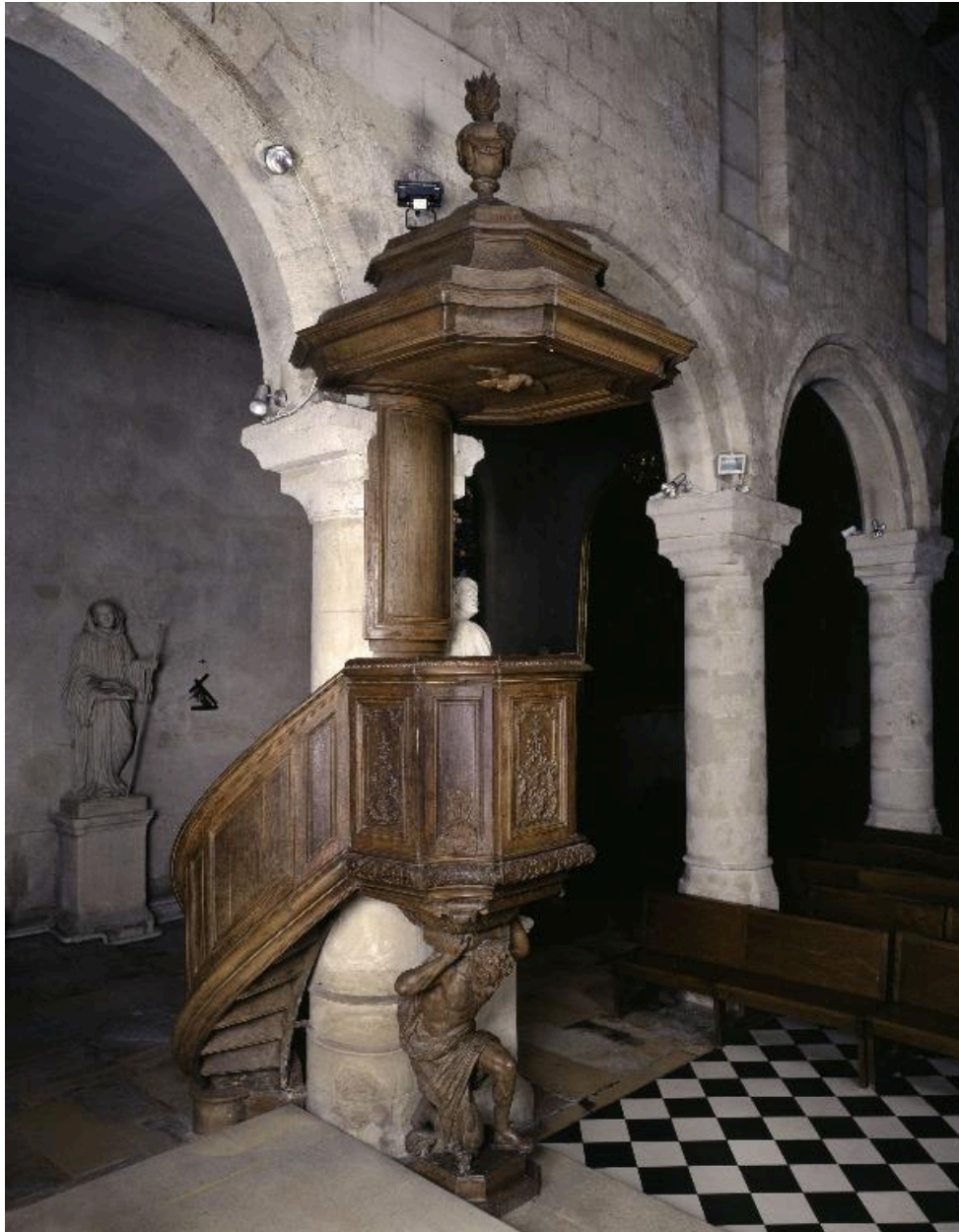
La chaire, vue de trois-quarts.