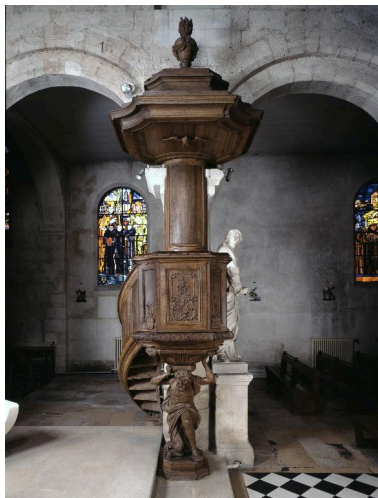
La chaire, vue de face.