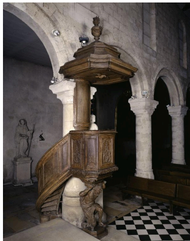
La chaire, vue de trois-quarts.