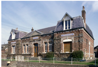
Vue générale sud-est. IVR22_19960200463ZA

IVR22_19930200363XB