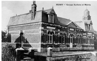
Vue sud-ouest, carte postale, [2e quart 20e siècle] (coll. part.).

Phot. Thierry Lefébure IVR22_19930200363XB