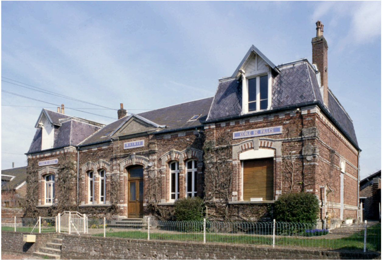
Vue générale sud-est.