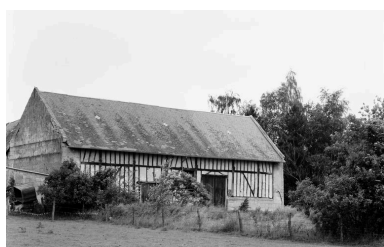
Grange.