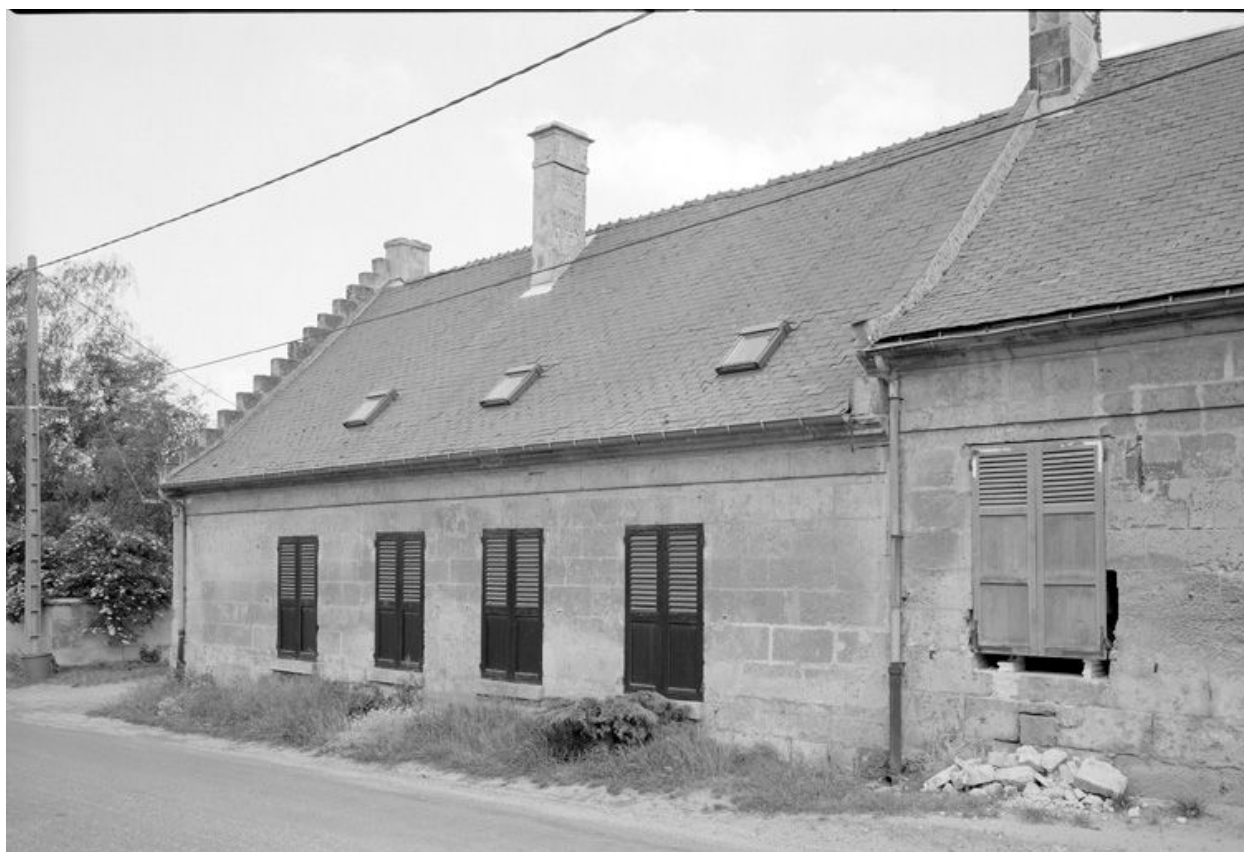
Logis. Elévation sur rue.