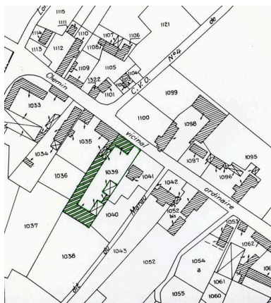
Plan de situation. Extrait du plan cadastral de 1962, section B4 1039.