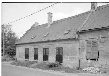
Logis. Elévation sur rue. IVR22_19856000787X