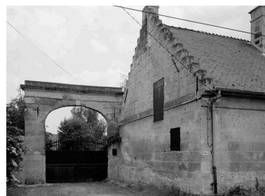
Portail. IVR22_19856000792X