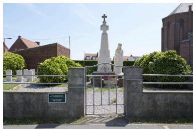
Le monument aux morts et son enclos.