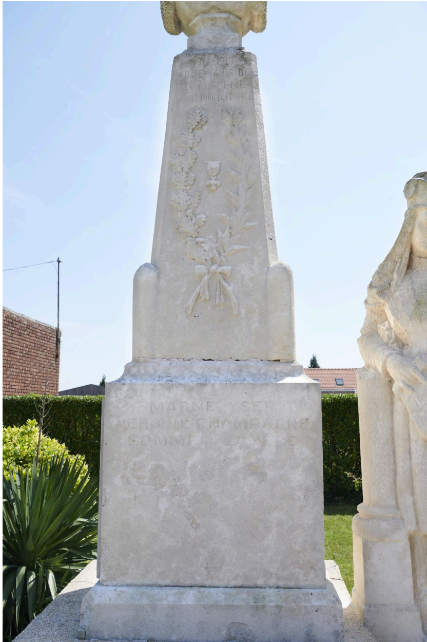
Détail de l'obélisque.