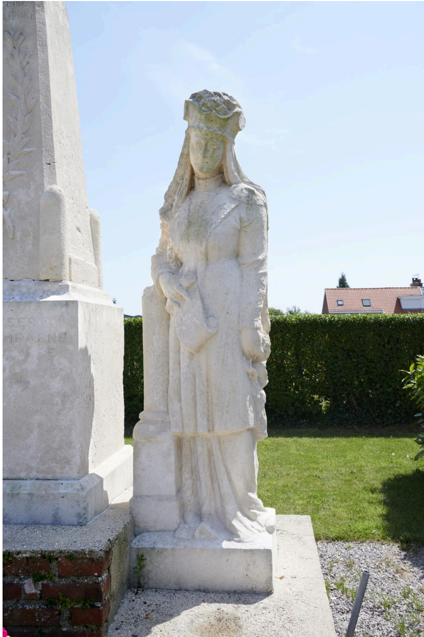
Détail de la statue.