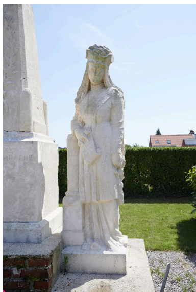
Détail de la statue. IVR32_20245902810NUCA