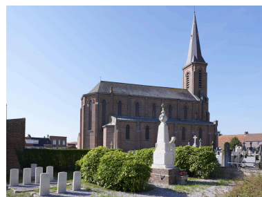
Contexte général d'implantation du monument aux morts. IVR32_20245902772NUCA