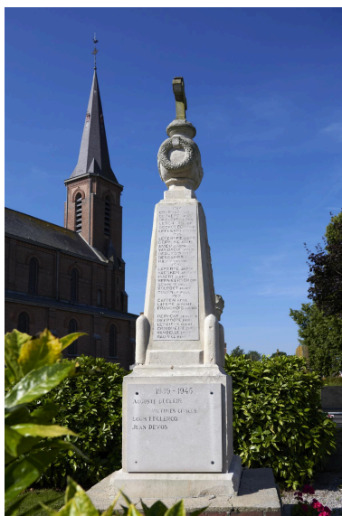
Côté gauche du monument.