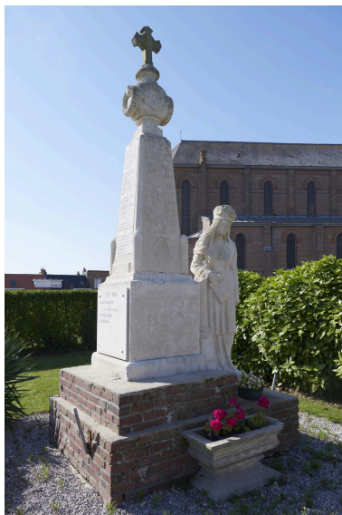
Monument aux morts de Zuytpeene. Obélisque et statue. IVR32_20245902774NUCA