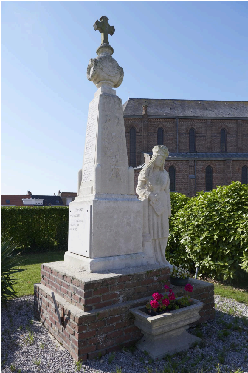
Monument aux morts de Zuytpeene. Obélisque et statue.