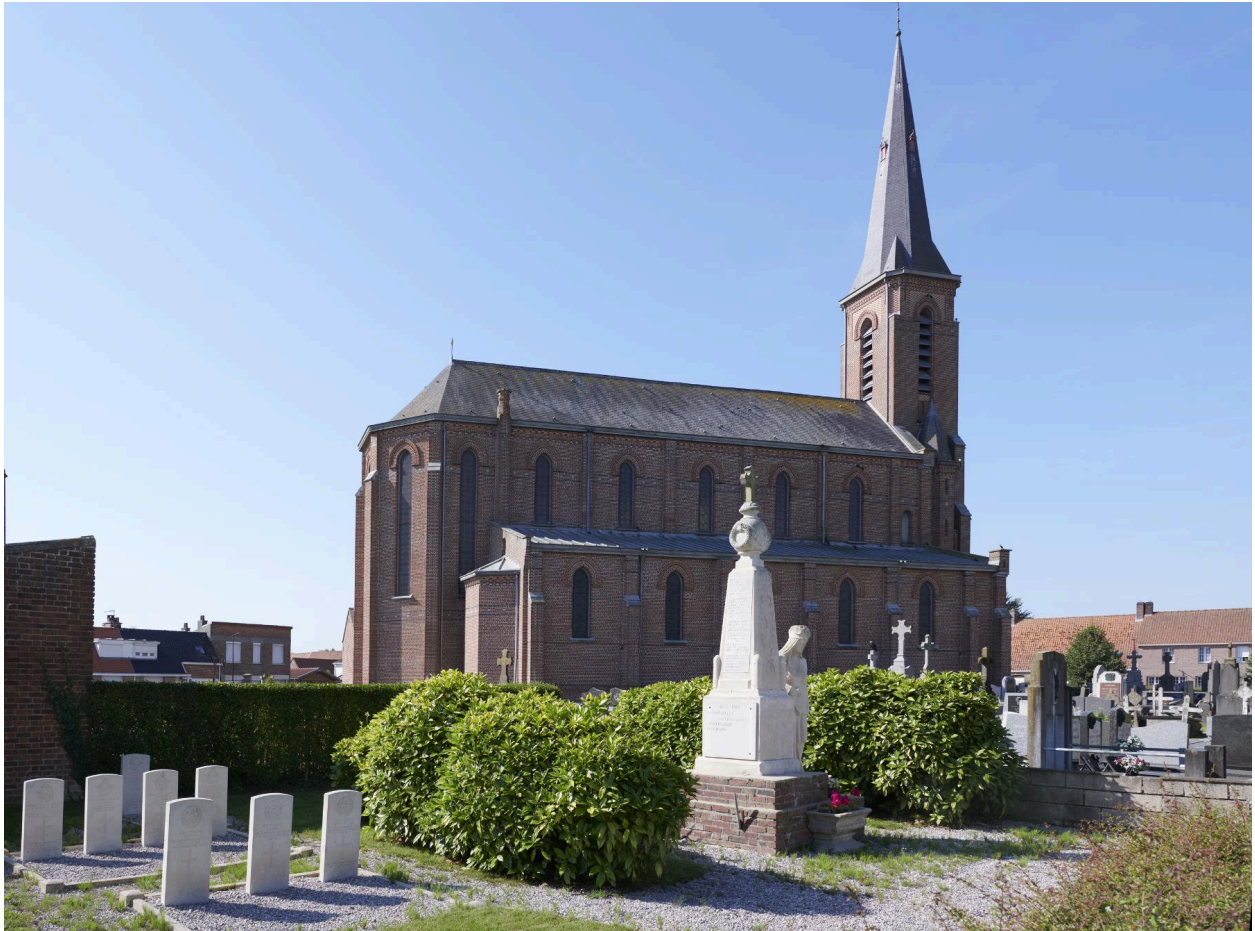
Contexte général d'implantation du monument aux morts.