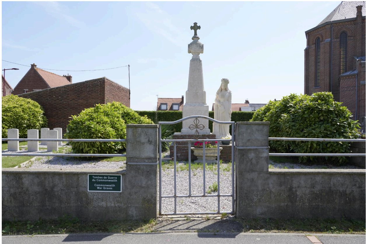
Le monument aux morts et son enclos.