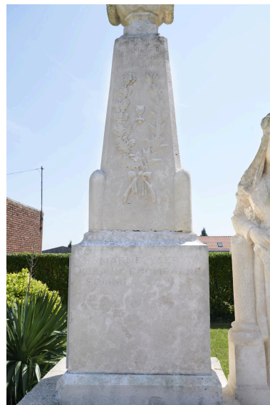
Détail de l'obélisque. IVR32_20245902809NUCA