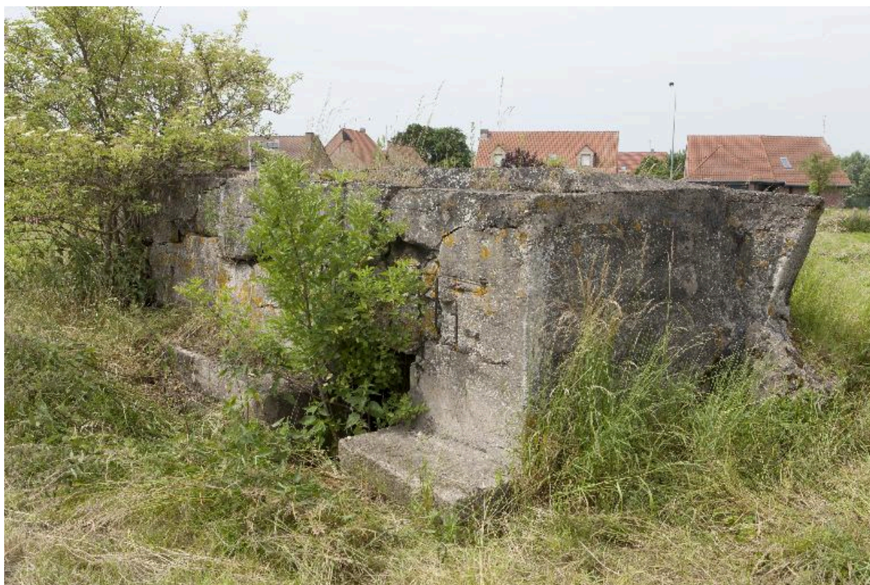
Casemate b. Banquette de tir, vers sud-ouest