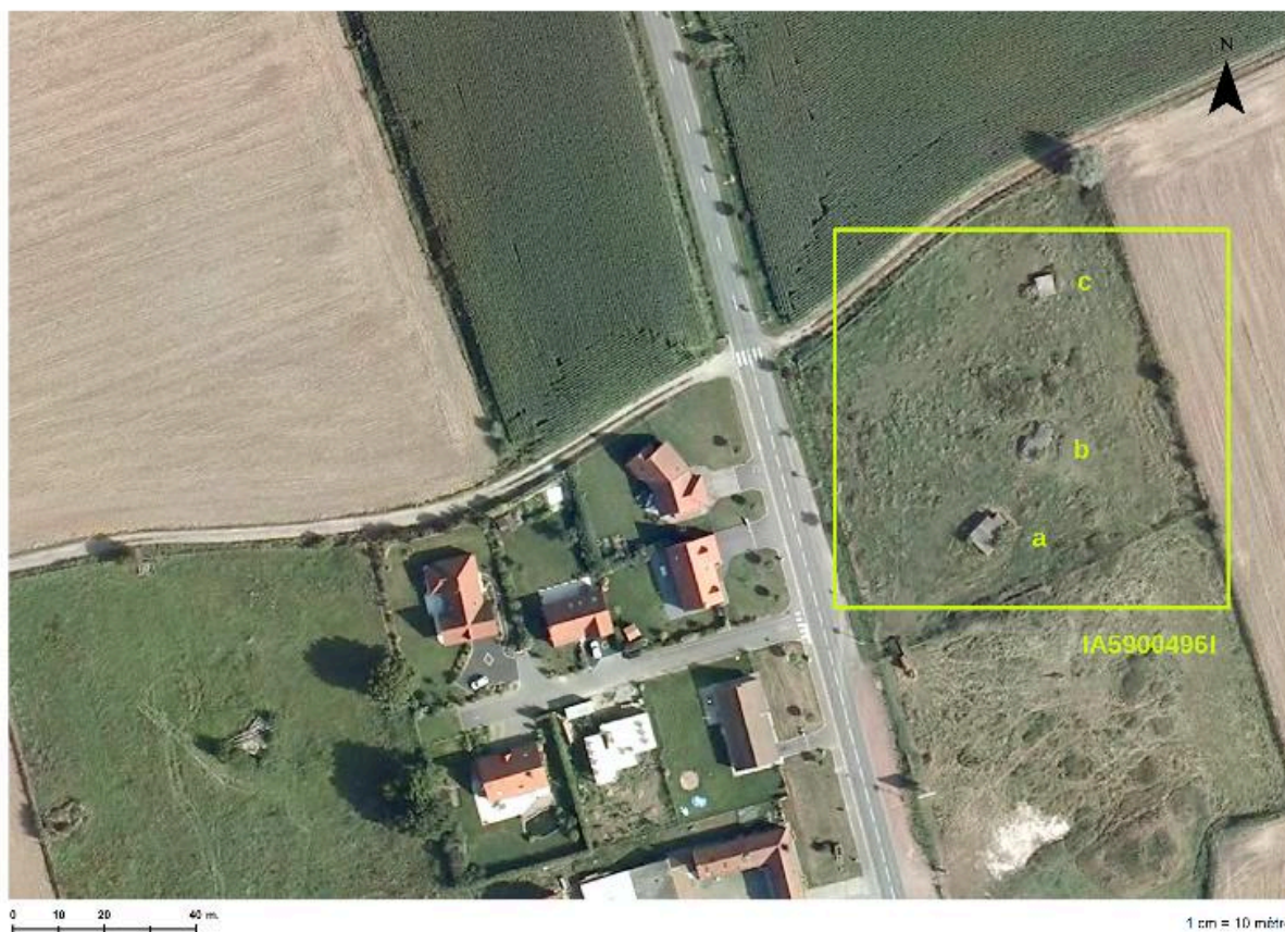
Situation des 3 casemates (a, b et c) sur une photographie aérienne de 2009