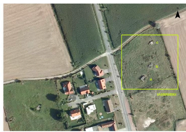
Situation des 3 casemates (a, b et c) sur une photographie aérienne de 2009 IVR32_20175900947NUCA