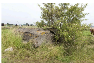
Casemate b, vue de trois-quarts vers le nord-ouest. IVR31_20145905598NUCA