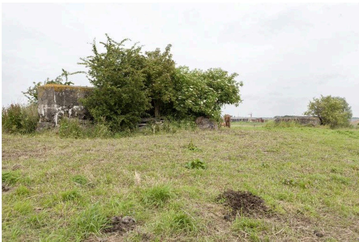
Casemates a, à gauche et b, vers le nord