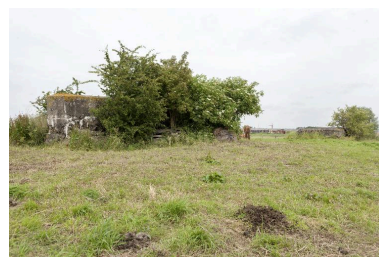
Casemates a, à gauche et b, vers le nord