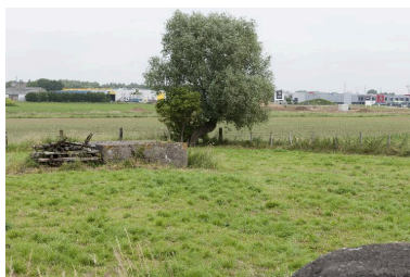
La casemate c, depuis le couvrement de la casemate b, vers le nord. IVR31_20145905589NUCA