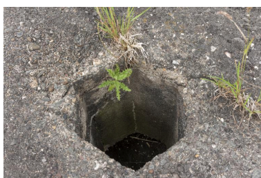
Casemate b. Cheminée du périscopes sur le couvrement IVR31_20145905596NUCA