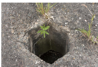
Casemate b. Cheminée du périscopie sur le couvrement IVR31_20145905596NUCA