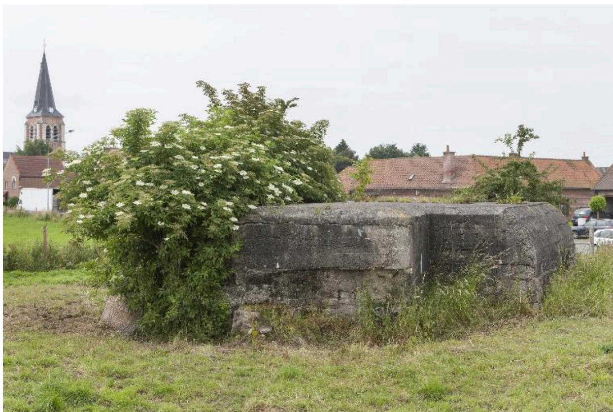
Casemate a, vers le sud-ouest