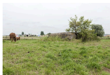
Casemate a, vers le nord-est