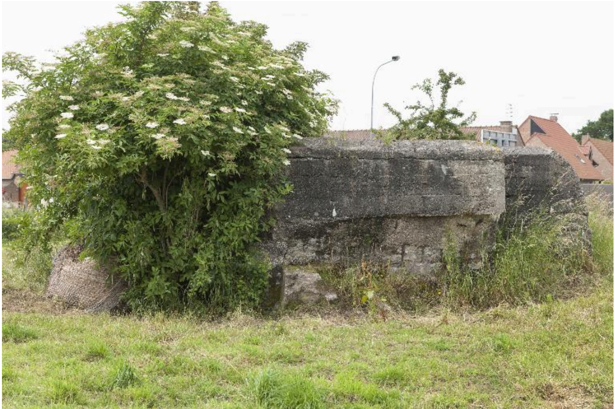
Casemate a, vers le sud-ouest