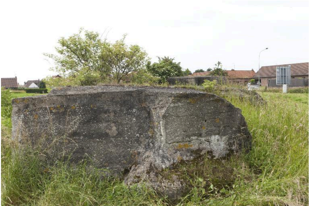
Casemate b, vers le sud