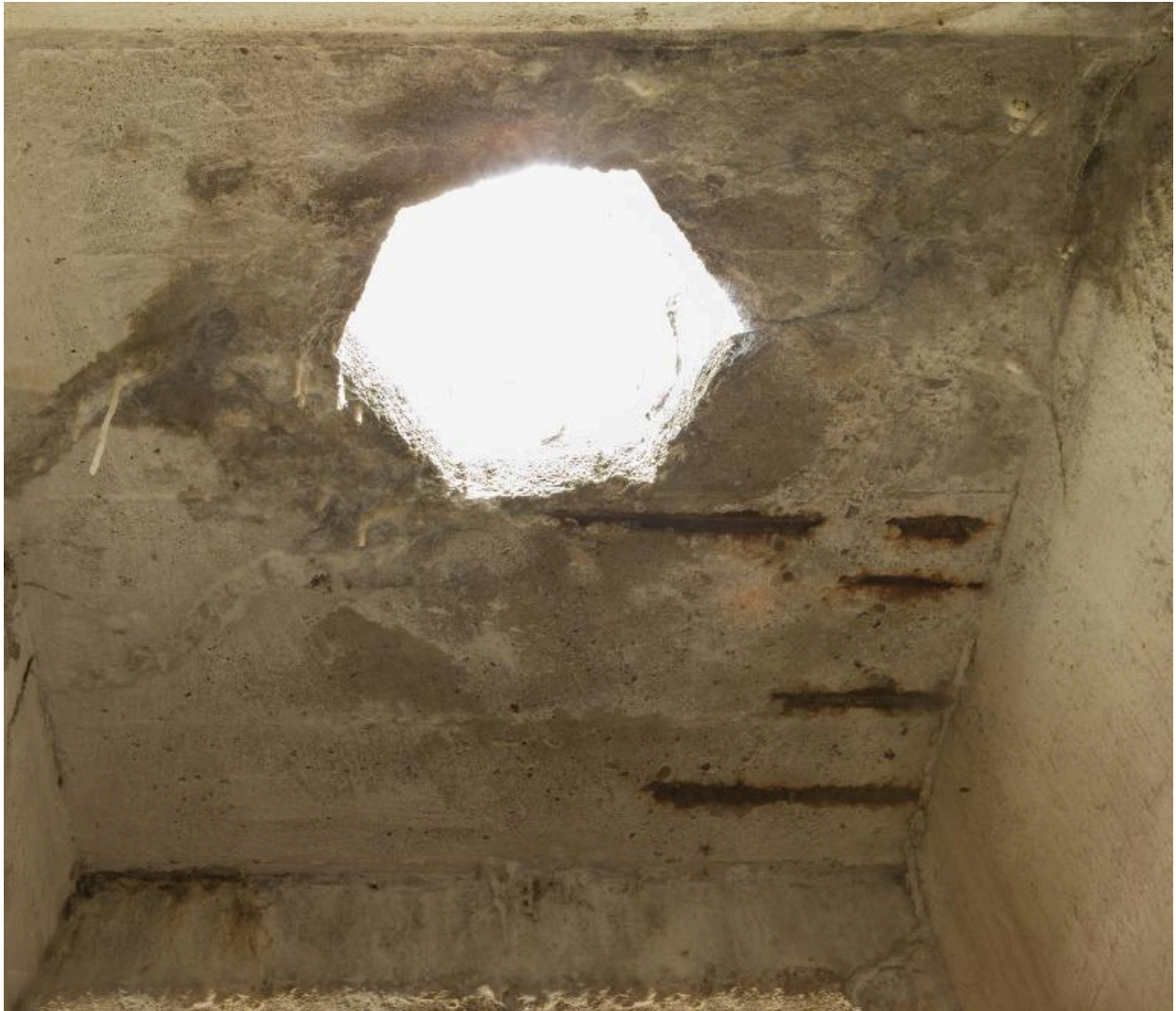
Casemate b. Vue intérieure de l'observatoire bétonné. Passage du périscope.