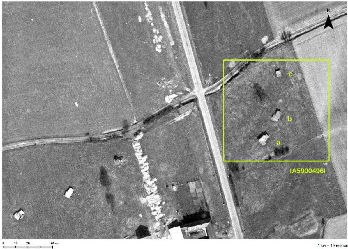
Situation des 3 casemates (a, b et c) sur une photographie aérienne du 13/03/1965.