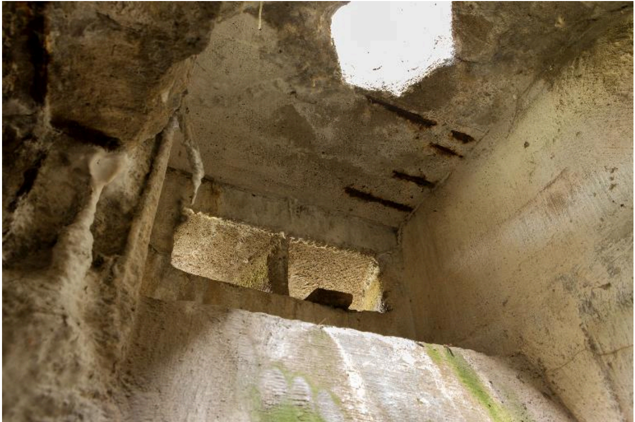
Casemate b. Vue intérieure de l'observatoire bétonné. Passage du périscopes et embrasures de surveillance, vers nord-ouest.