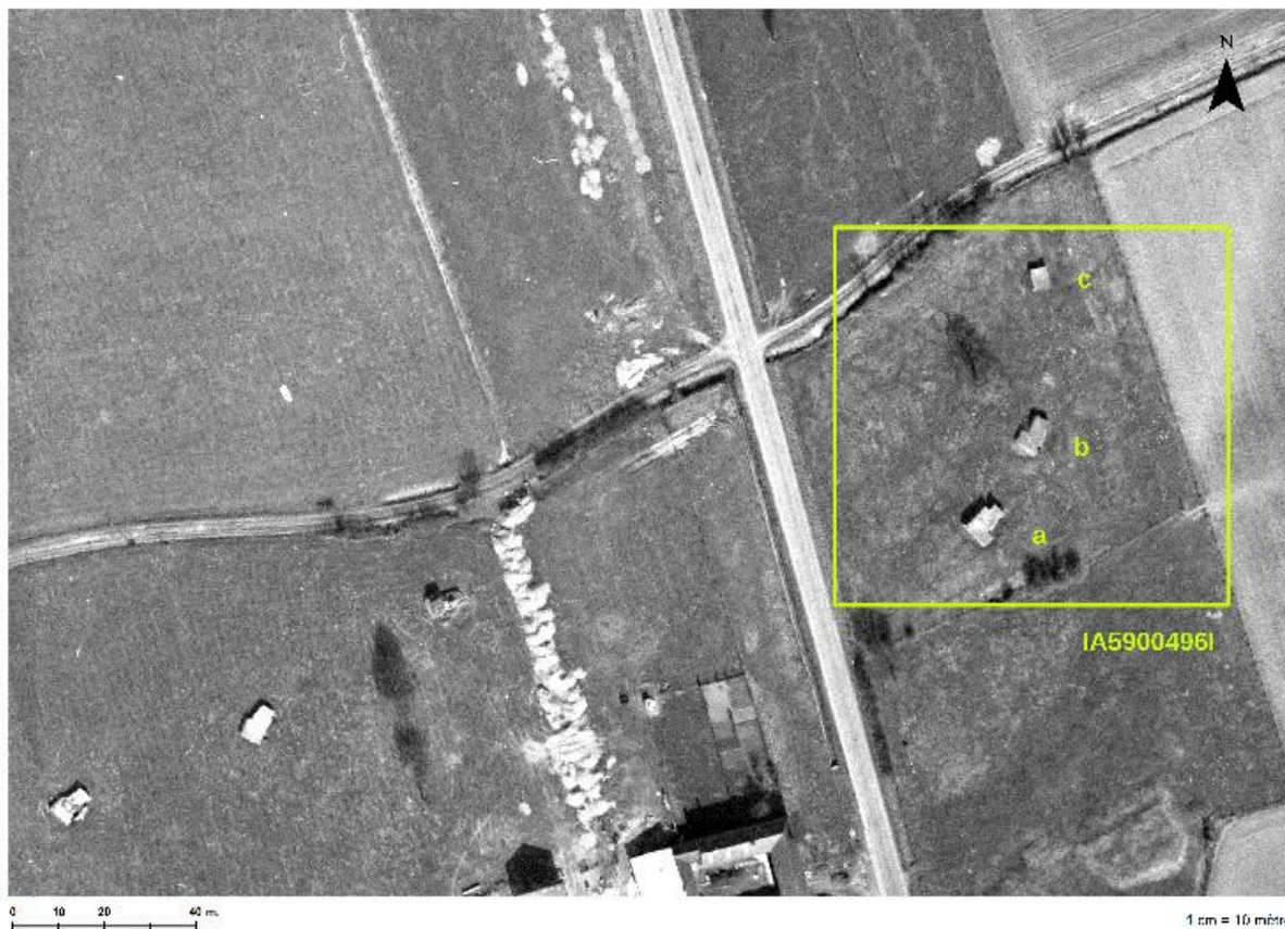
Situation des 3 casemates (a, b et c) sur une photographie aérienne du 13/03/1965.