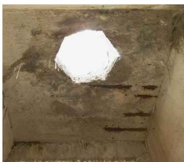
Casemate b. Vue intérieure de l'observatoire bétonné. Passage du périscopes.