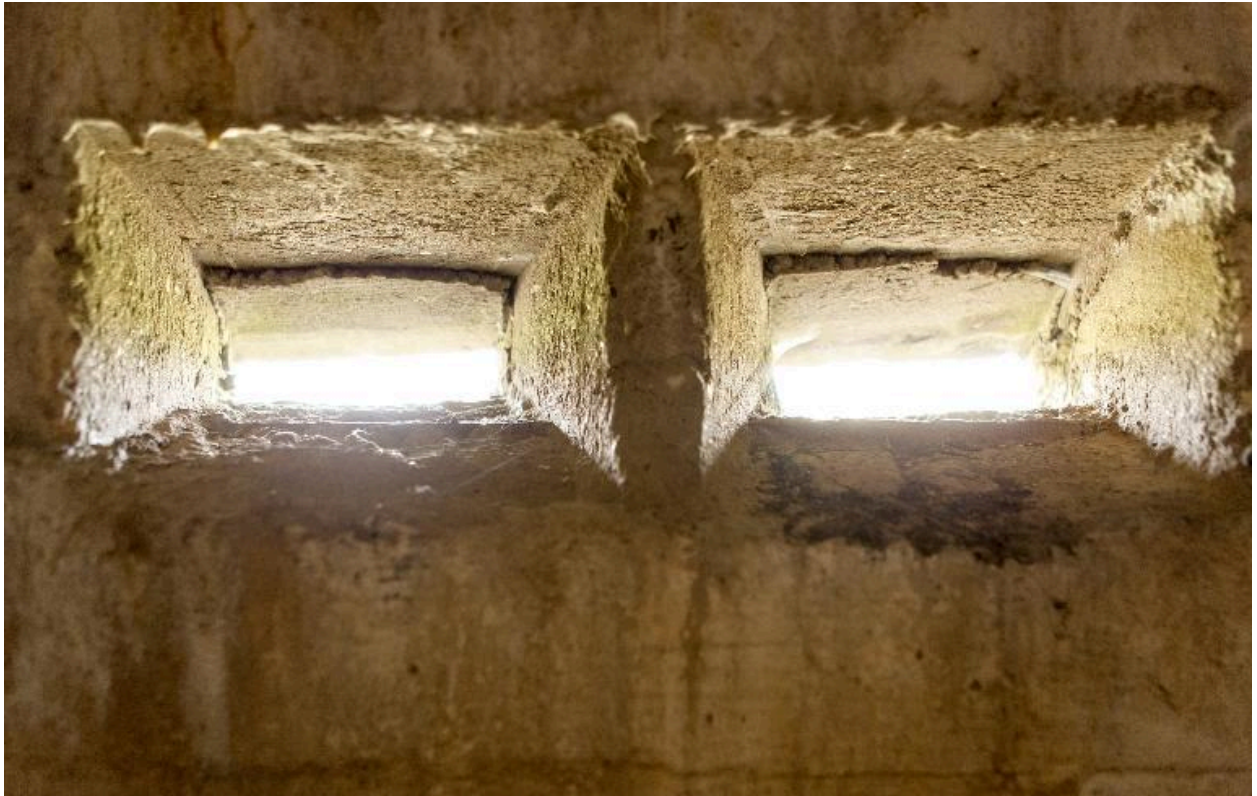
Casemate b. Vue intérieure de l'observatoire bétonné. Embrasures de surveillance