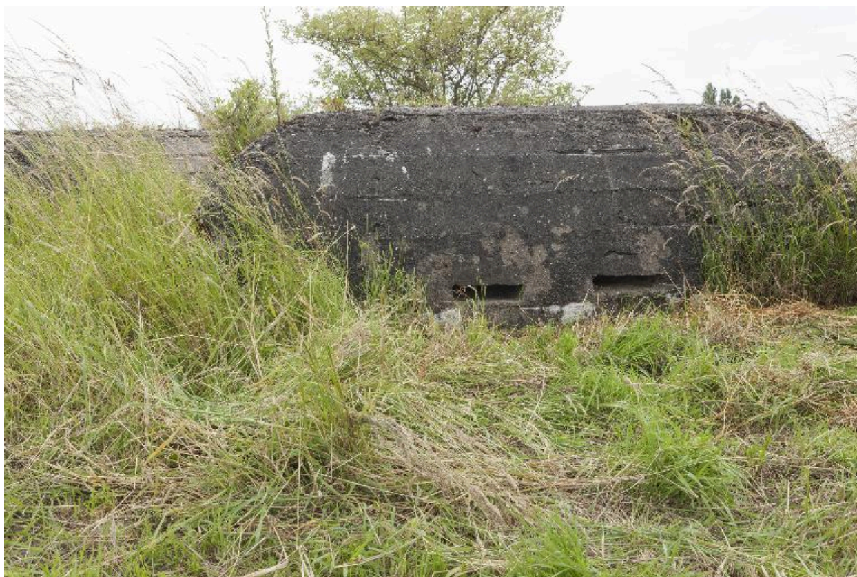
Casemate b. Elévation nord-ouest. Embrasures de surveillance