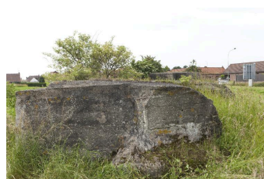
Casemate b, vers le sud IVR31_20145905592NUCA