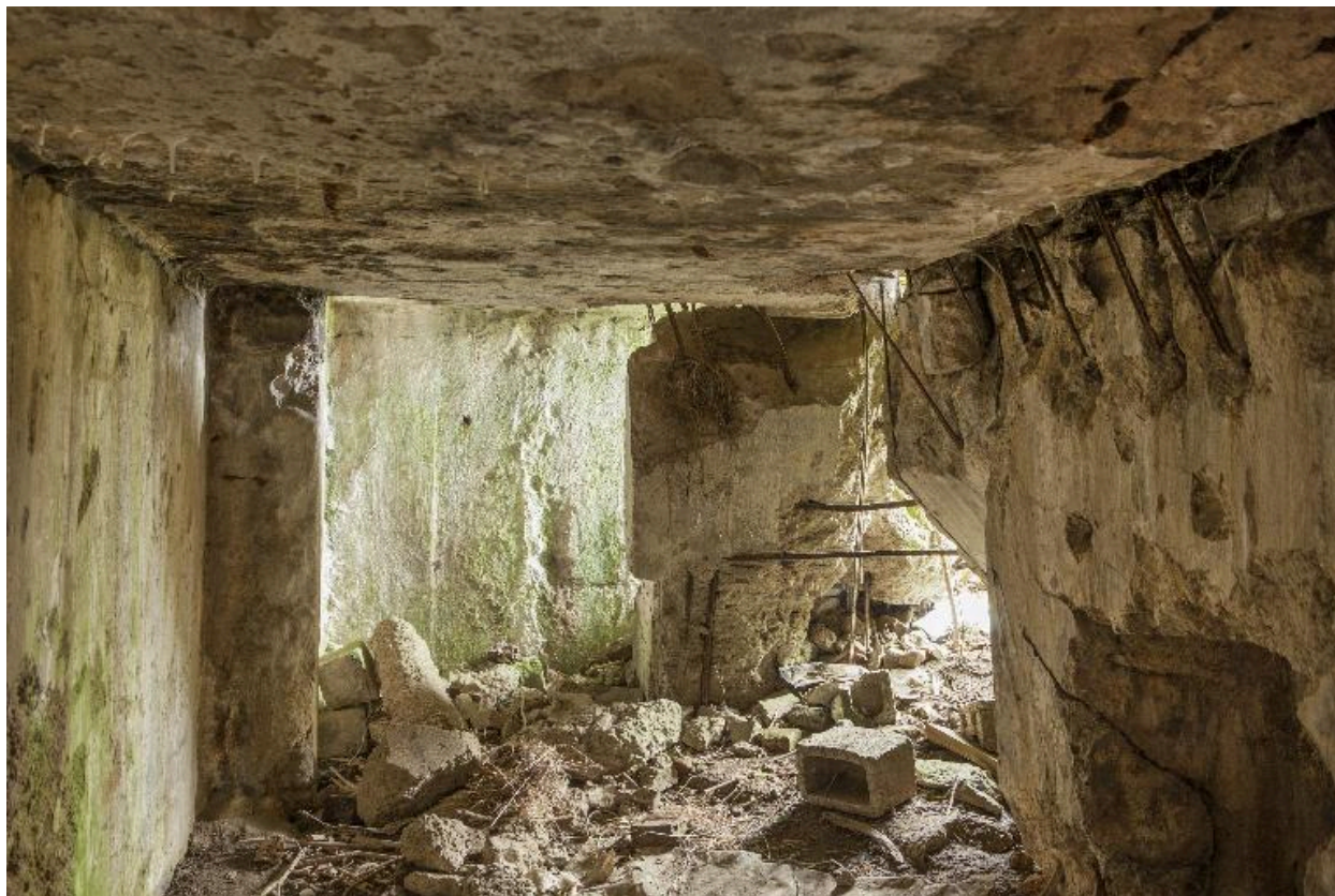
Casemate b. Casemate Vue intérieure, vers l'entrée.