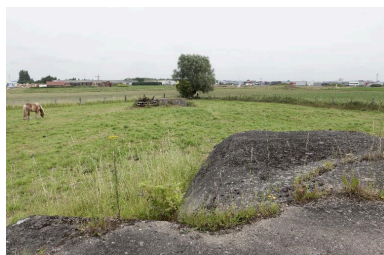
La casemate c, depuis le couvrement de la casemate b, au-dessus de l'observatoire bétonné, vers le nord. IVR31_20145905590NUCA