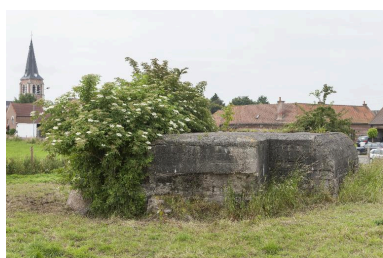
Casemate a, vers le sud-ouest IVR31_20145905594NUCA