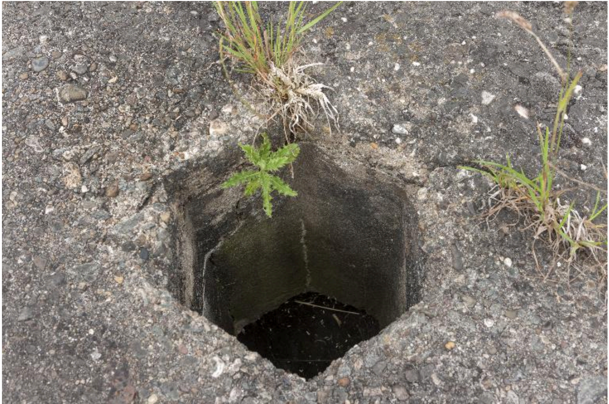
Casemate b. Cheminée du périscope sur le couverture