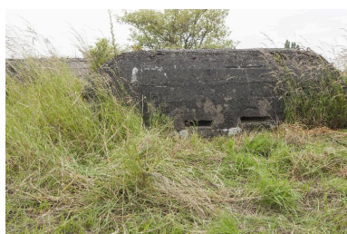
Casemate b. Elévation nord-ouest. Embrasures de surveillance IVR31_20145905597NUCA