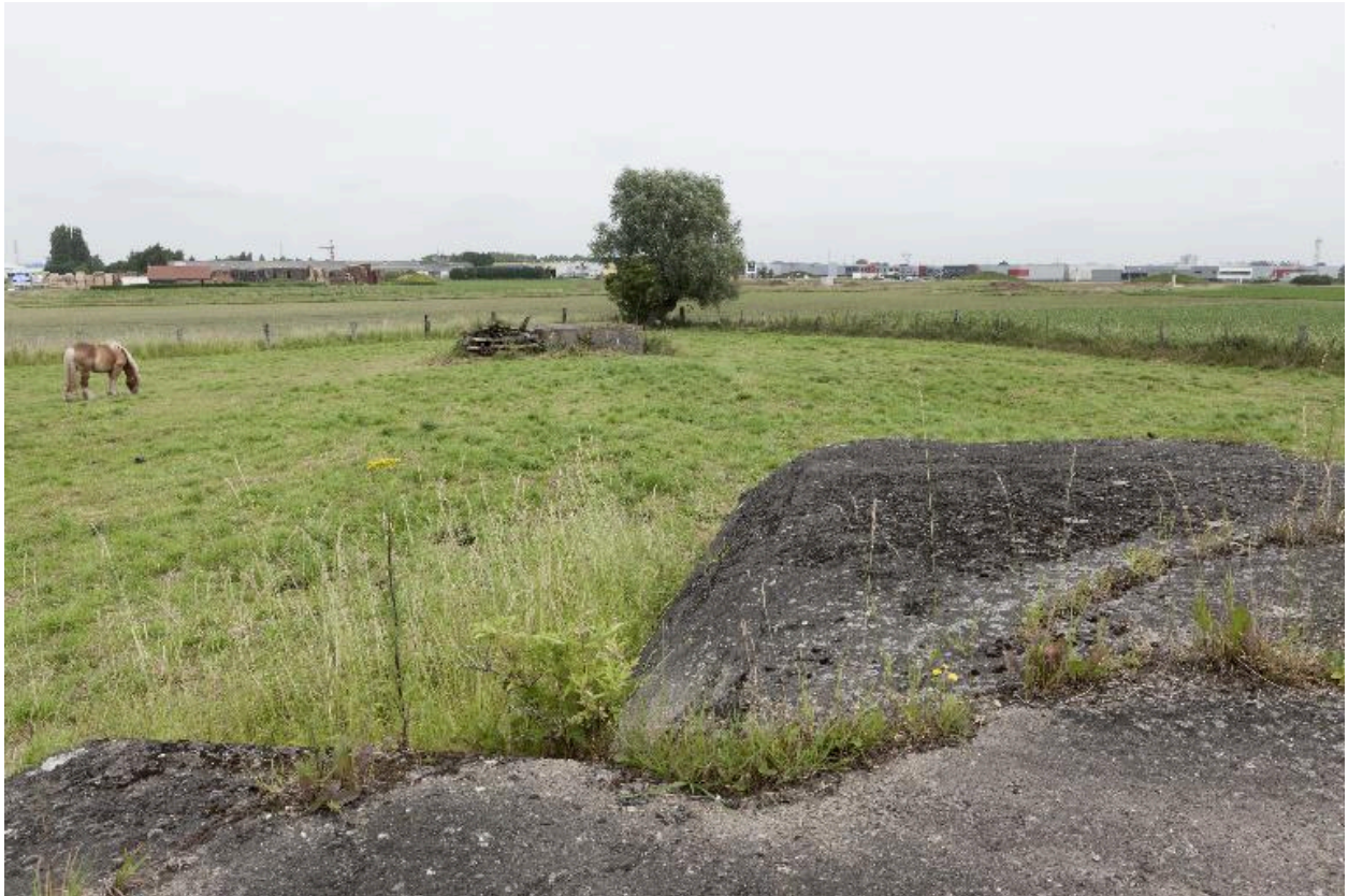
La casemate c, depuis le couverture de la casemate b, au-dessus de l'observatoire bétonné, vers le nord.