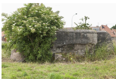
Casemate a, vers le sud-ouest IVR31_20145905599NUCA