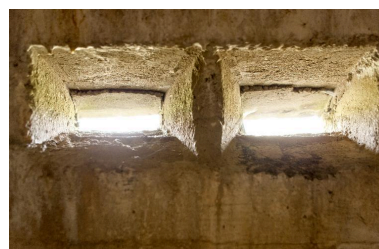
Casemate b. Vue intérieure de l'observatoire bétonné. Embrasures de surveillance IVR31_20145905603NUCA