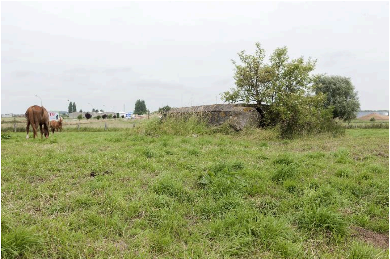
Casemate a, vers le nord-est