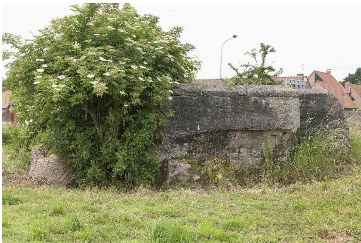
Casemate a, vers le sud-ouest