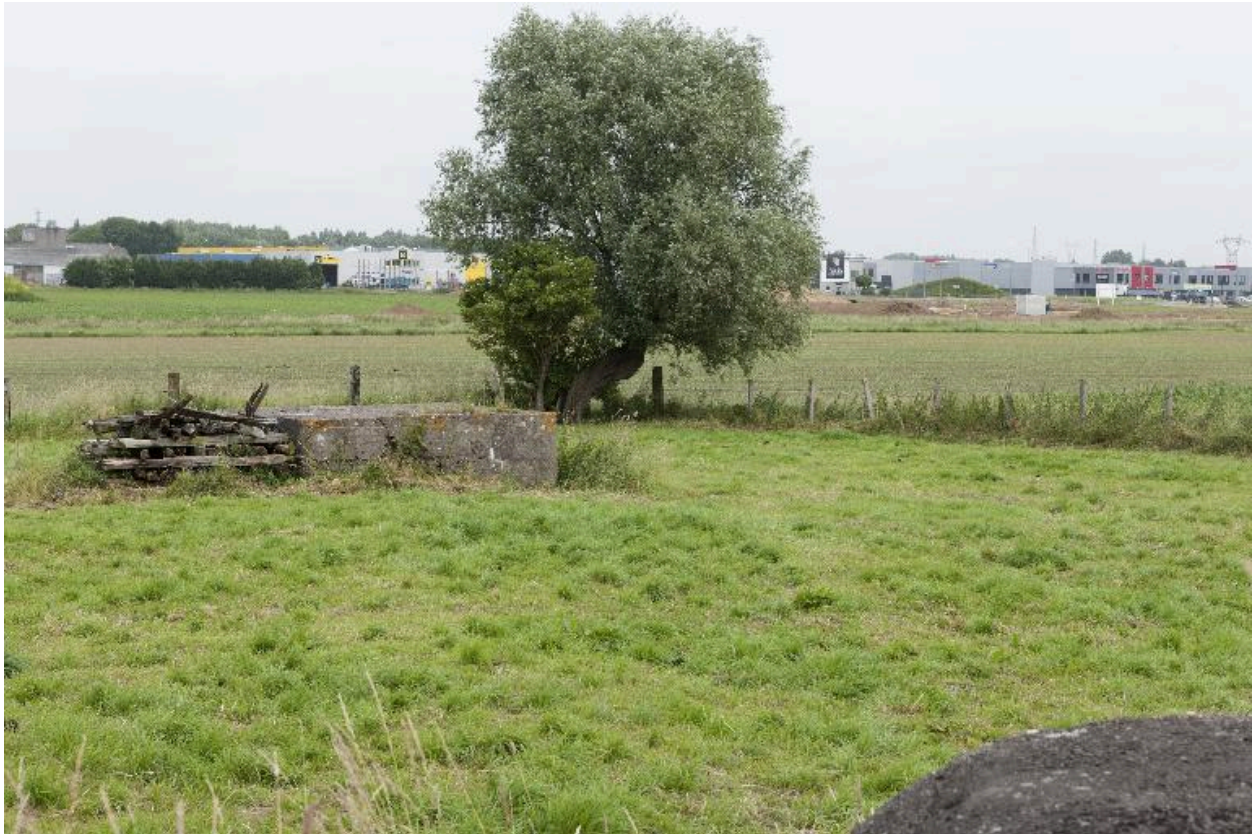
La casemate c, depuis le couverture de la casemate b, vers le nord.