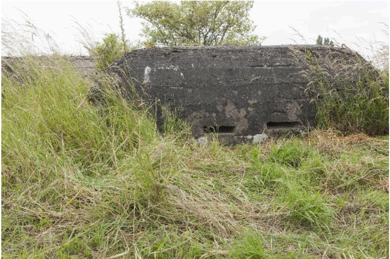
Casemate b. Elévation nord-ouest. Embrasures de surveillance