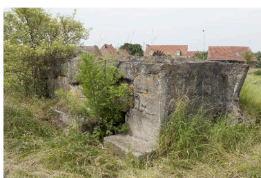
Casemate b. Banquette de tir, vers sud-ouest