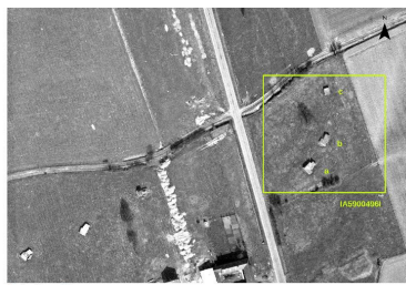
Situation des 3 casemates (a, b et c) sur une photographie aérienne du 13/03/1965.