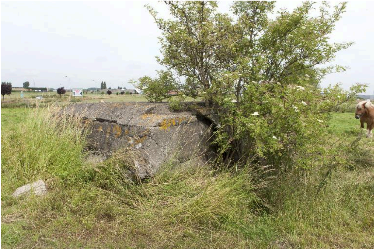
Casemate b, vue de trois-quarts vers le nord-ouest.