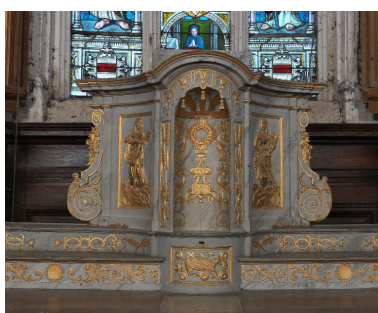
Tabernacle tournant : loge pour l'exposition de l'ostensoir.

Phot. Marie-Laure Monnehay-Vulliet IVR22_20128001344NUC2A