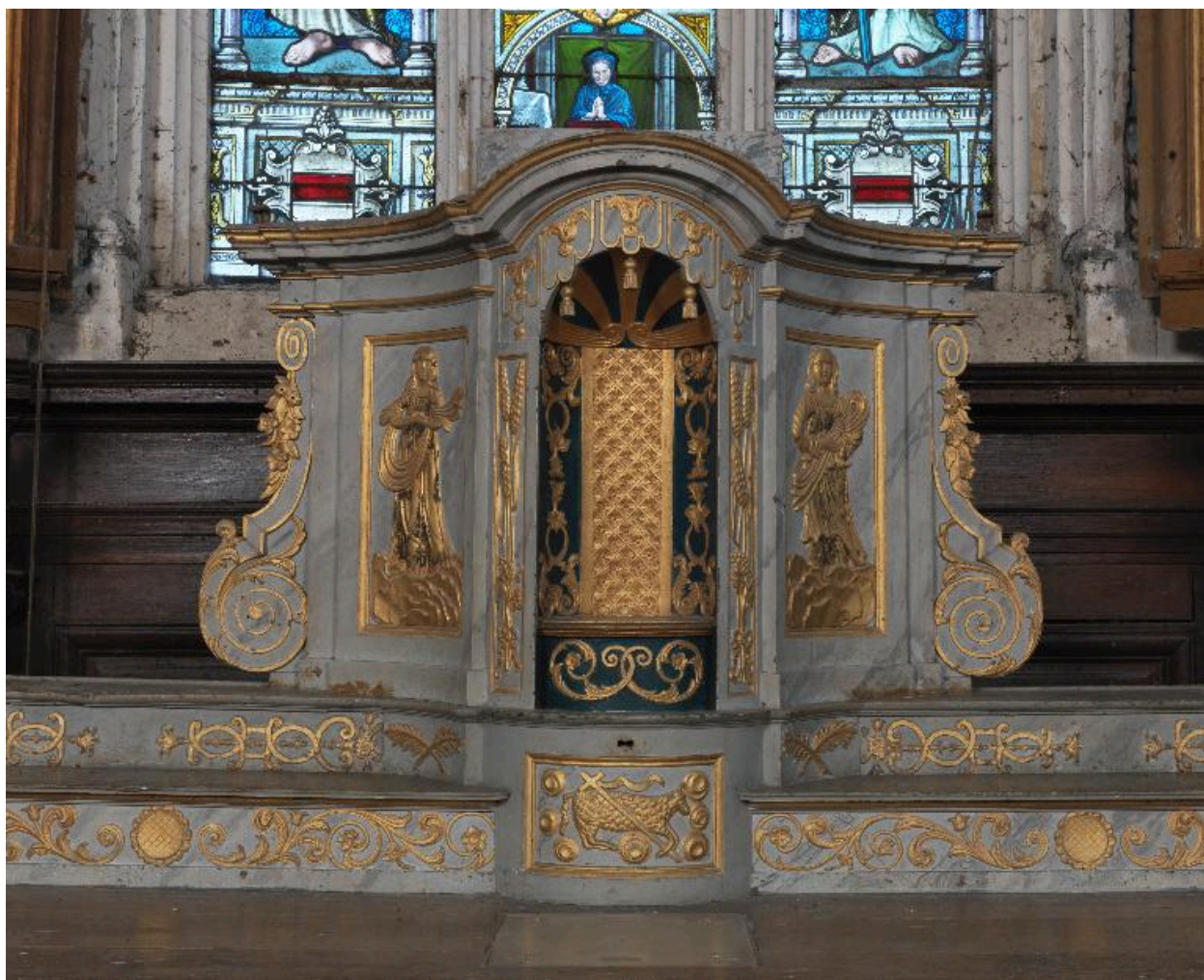
Tabernacle tournant : loge pour le rangement du ciboire.