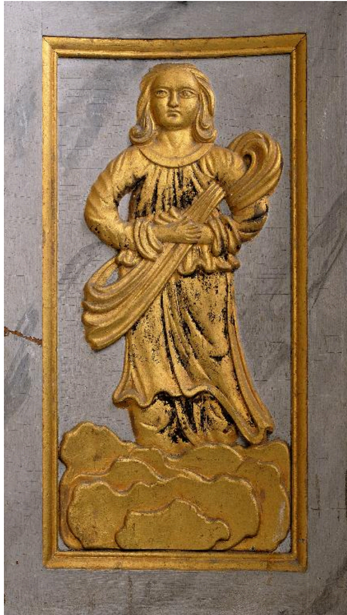
Figure féminine sur un panneau latéral du tabernacle.