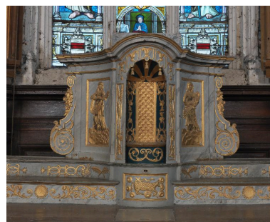
Tabernacle tournant : loge pour le rangement du ciboire.

Phot. Marie-Laure Monnehay-Vulliet IVR22_20148000082NUC2A