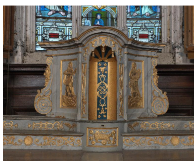
Tabernacle tournant : loge pour le rangement de l'ostensoir.

IVR22_20128001346NUC2A