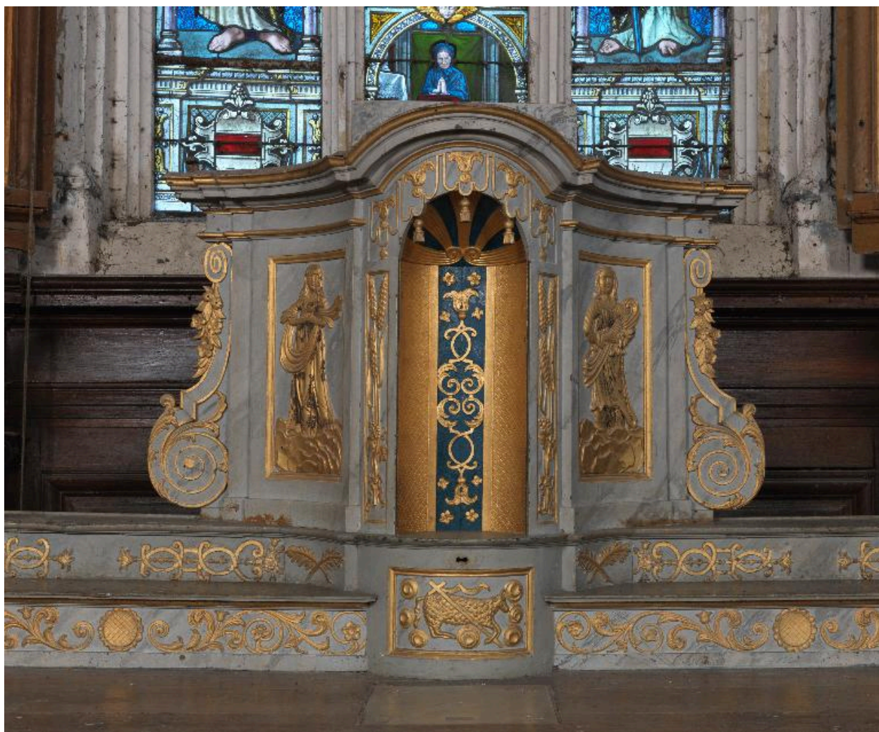
Tabernacle tournant : loge pour le rangement de l'ostensoir.