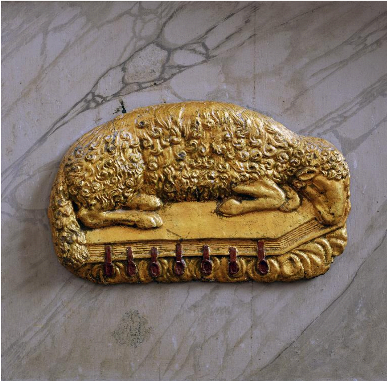
Détail du devant d'autel : agneau aux sept sceaux.