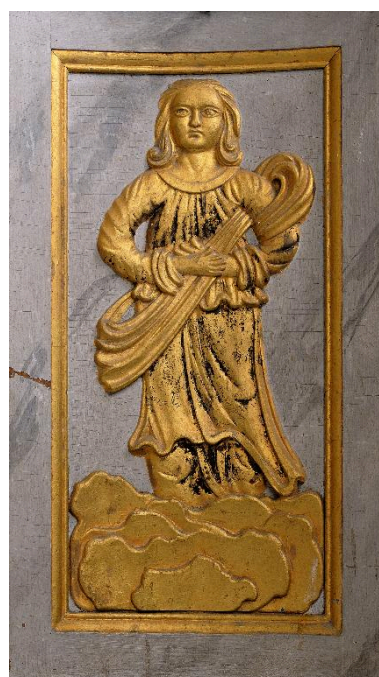
Figure féminine sur un panneau latéral du tabernacle.

IVR22_20128001345NUC2A