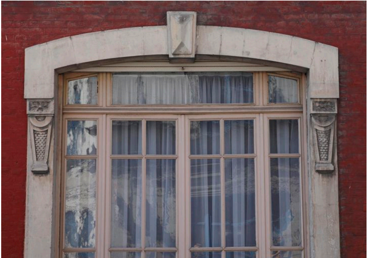
Vue sur l'encadrement sculpté d'une baie située au rez-de-chaussée.