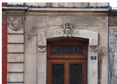
Décors sculptés de l'encadrement de la porte d'entrée. IVR31_20096200284NUCA