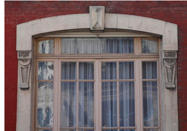
Vue sur l'encadrement sculpté d'une baie située au rez-de-chaussée. IVR31_20096200283NUCA