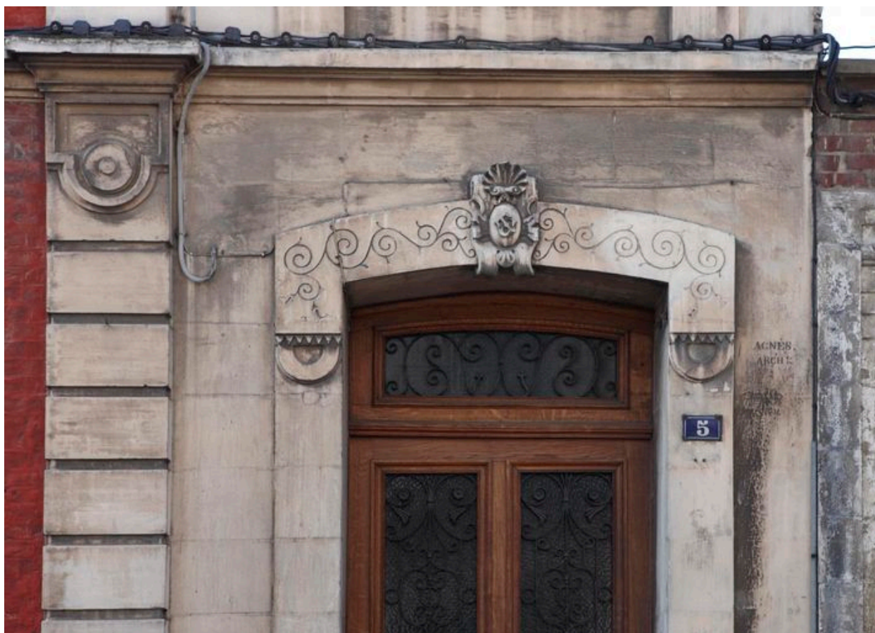
Décors sculptés de l'encadrement de la porte d'entrée.