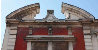
Vue sur le fronton curviligne interrompu. IVR31_20096200285NUCA