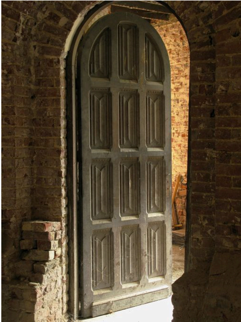
Porte de la sacristie