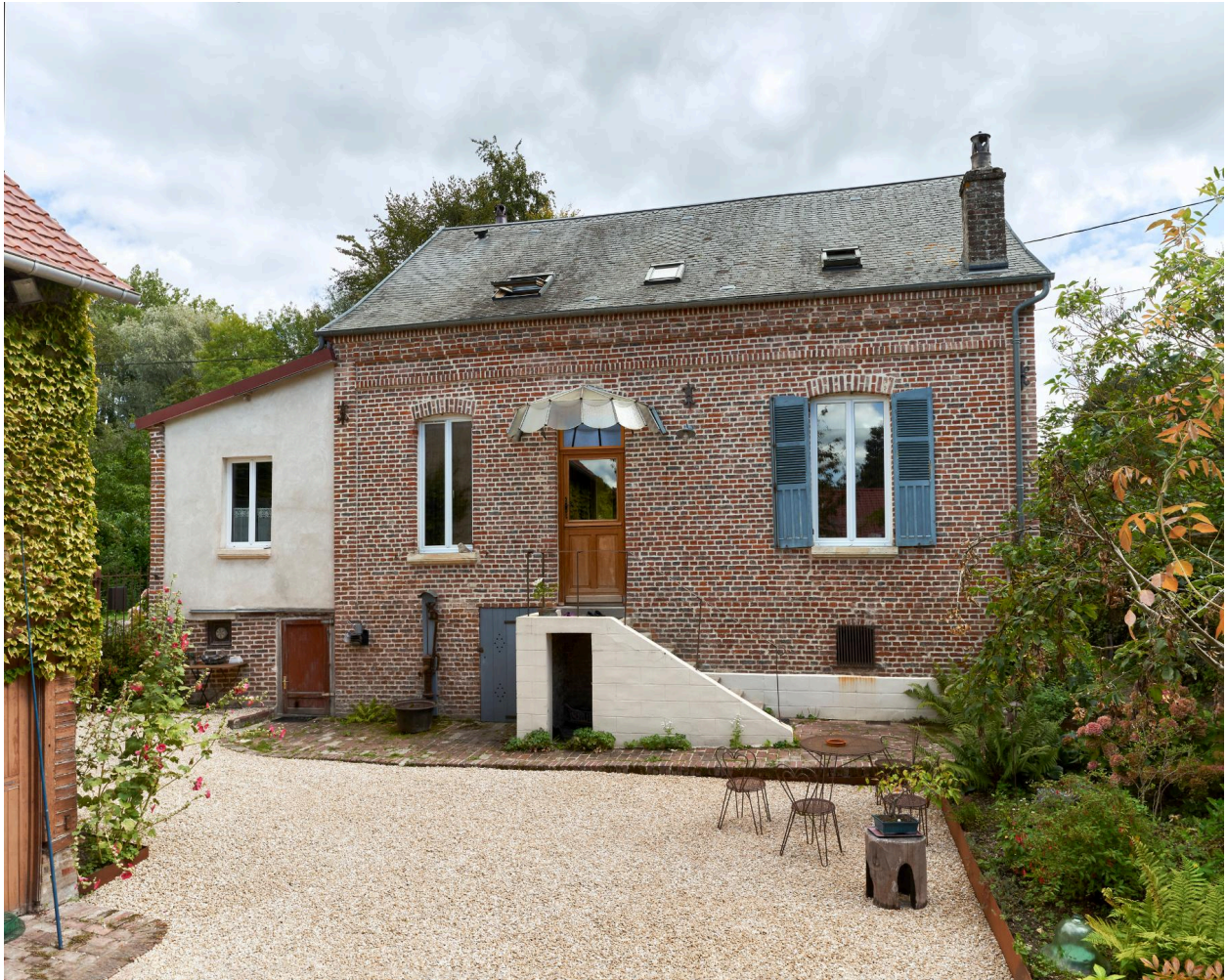
Maison d'habitation, vue prise depuis l'ouest.