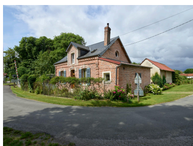
Maison d'habitation, vue prise depuis le nord-est. IVR32_20238000459NUCA