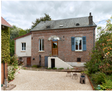
Maison d'habitation, vue prise depuis l'ouest.