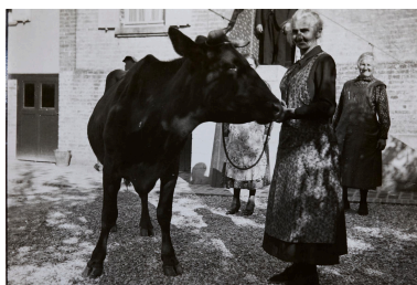
Vache dans la cour de la ferme Chevallier, début XXe siècle, photographie. IVR32_20238000466NUCA