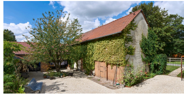
Bâtiments agricoles et cour de l'ancienne ferme, vue prise depuis l'est.