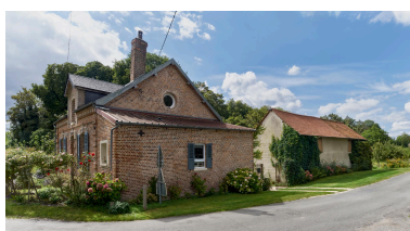
Maison d'habitation et bâtiment agricole, vue prise depuis l'est.