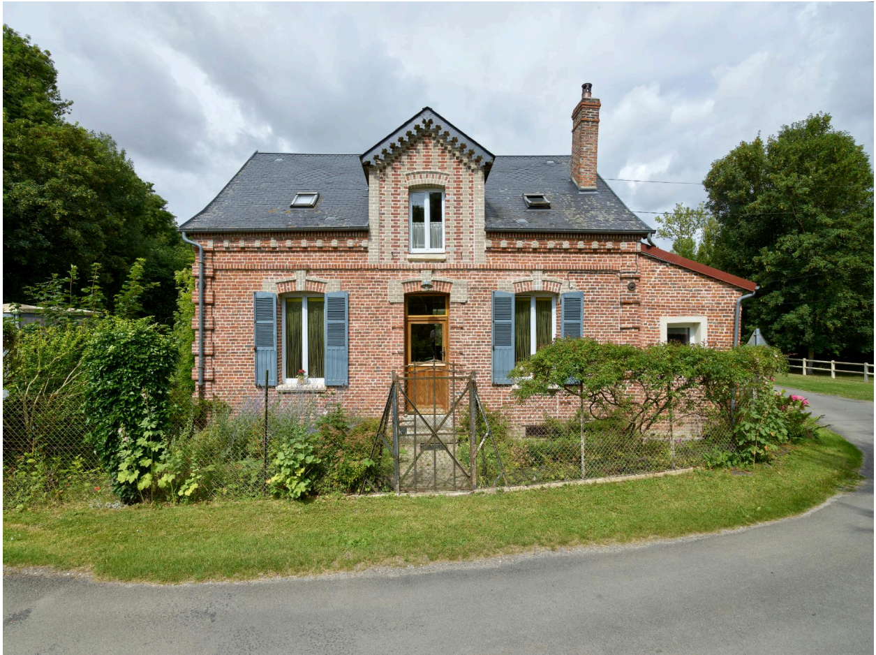
Maison d'habitation, vue prise depuis l'est.