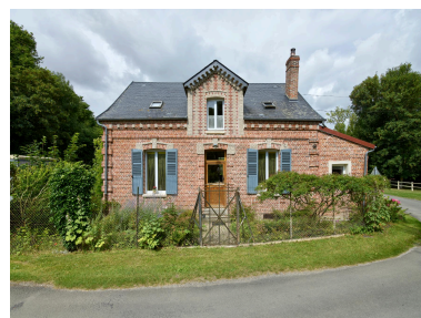
Maison d'habitation, vue prise depuis l'est.