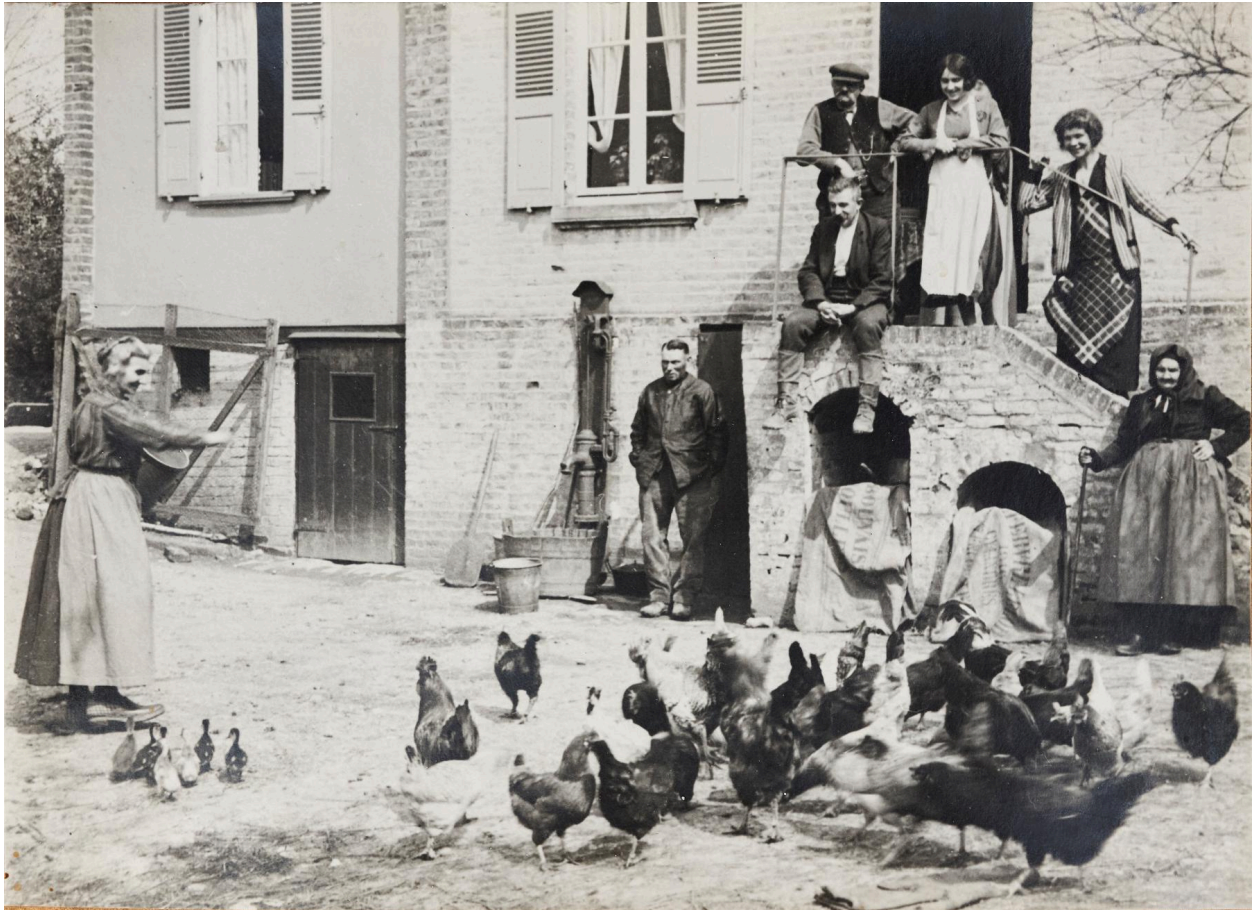
Cour de la ferme Chevallier, début XXe siècle, photographie.