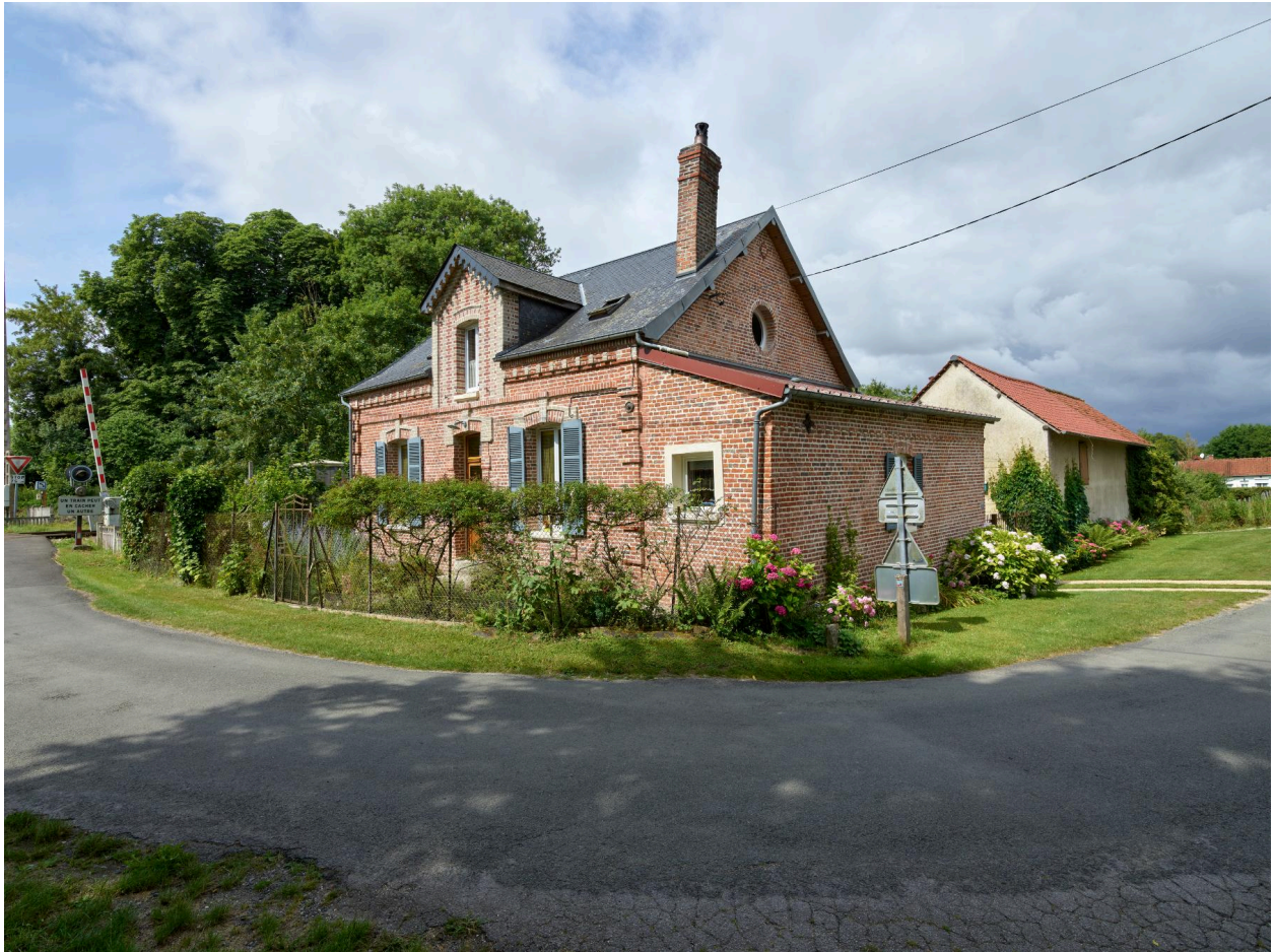
Maison d'habitation, vue prise depuis le nord-est.