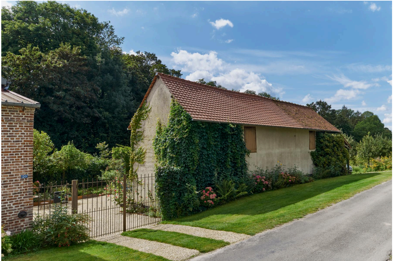
Bâtiment agricole, vue prise depuis le nord-est.