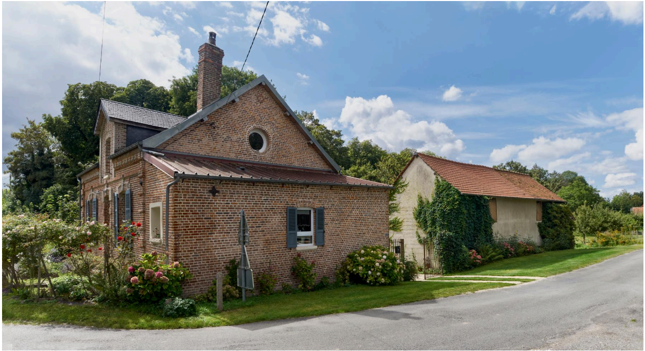
Maison d'habitation et bâtiment agricole, vue prise depuis l'est.