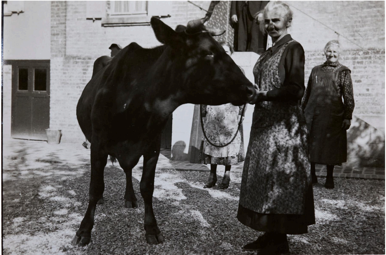
Vache dans la cour de la ferme Chevallier, début XXe siècle, photographie.