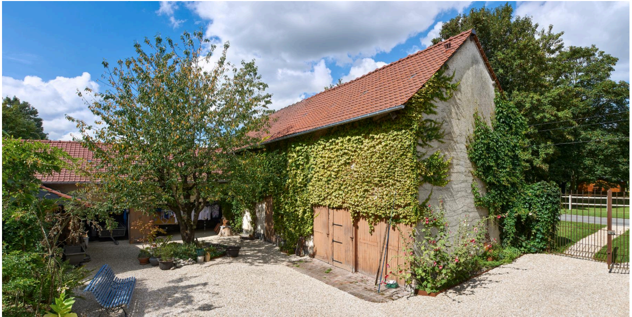
Bâtiments agricoles et cour de l'ancienne ferme, vue prise depuis l'est.