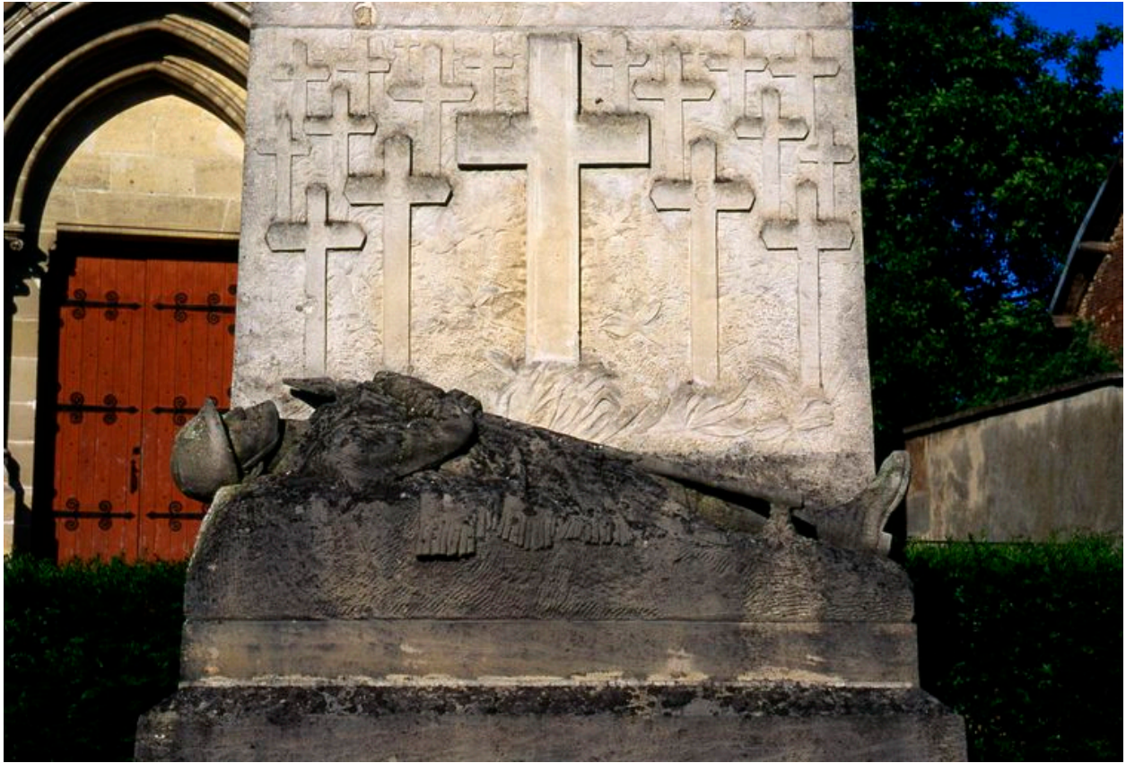
Détail de la statue.