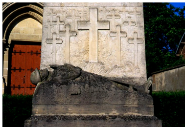
Détail de la statue. IVR22_19958001011ZA