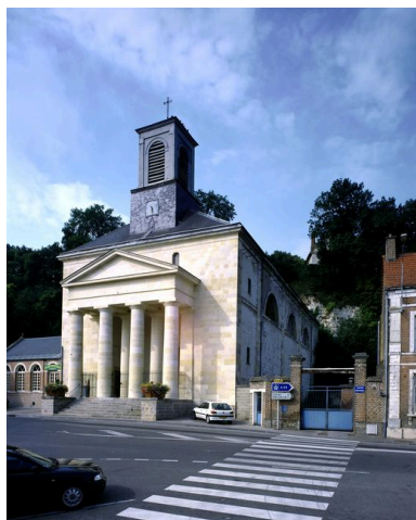
Vue générale de trois-quarts. IVR22_20038000781VA