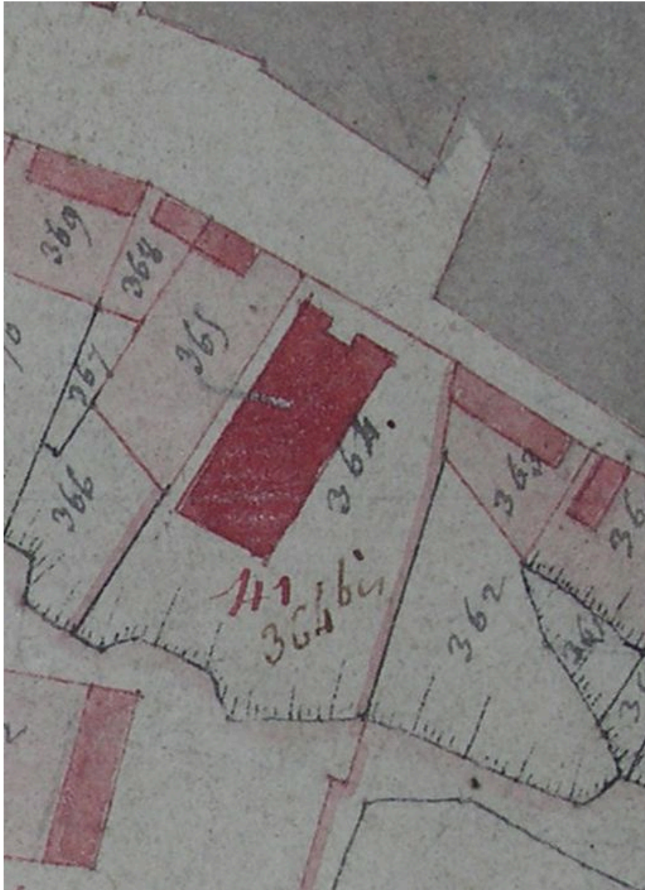
Extrait du cadastre de 1806.