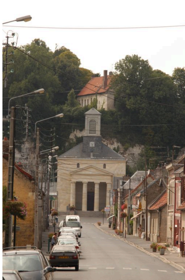
Vue de situation. IVR22_20038000818NUCA