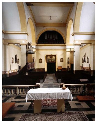
Vue intérieure vers l'entrée.