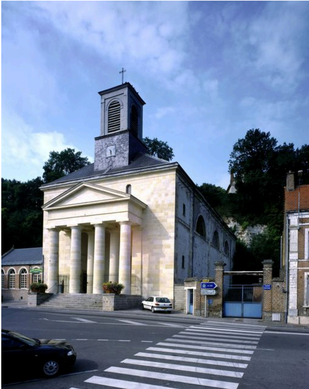
Vue générale de trois-quarts.