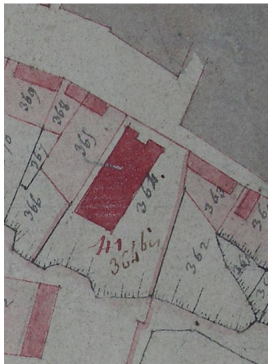
Extrait du cadastre de 1806. IVR22_20038010396NUCA