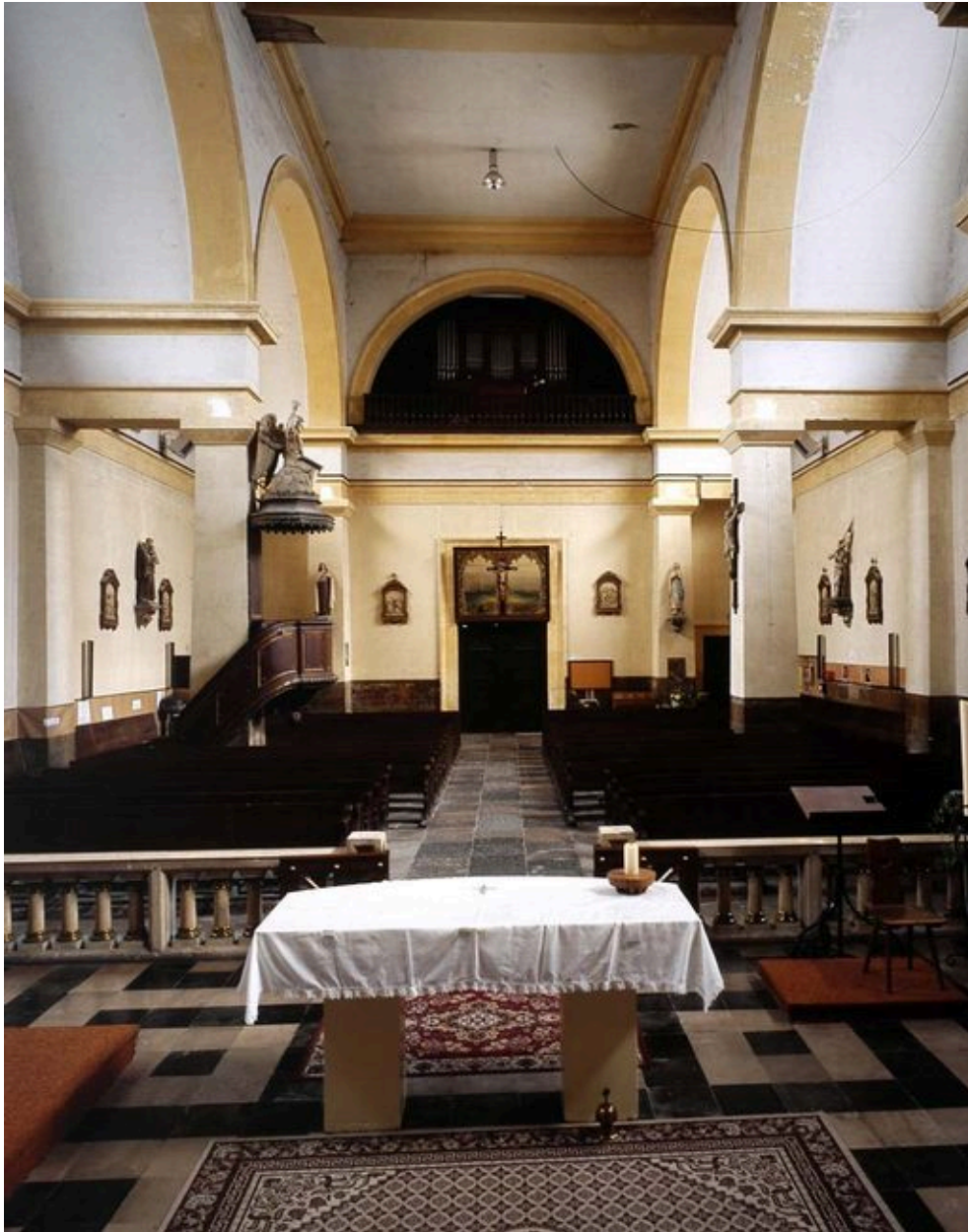
Vue intérieure vers l'entrée.