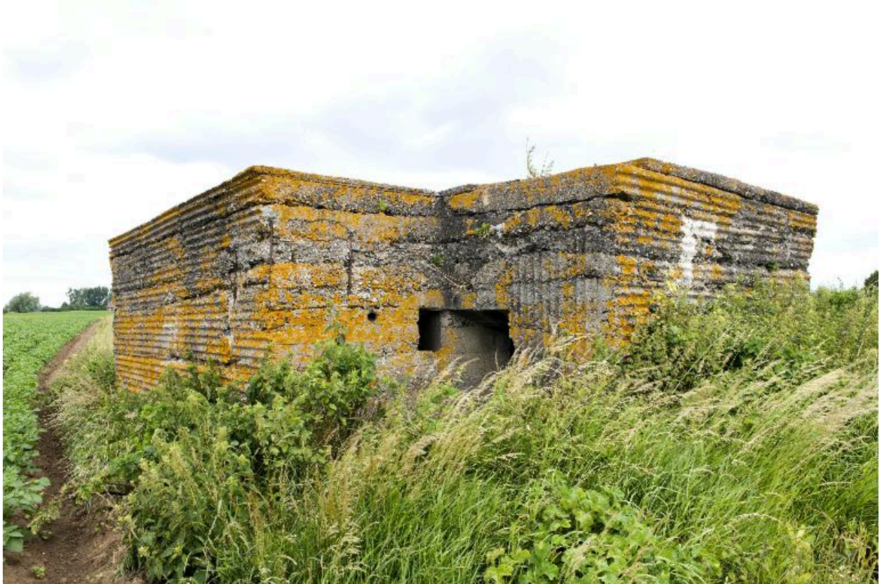
Vue de trois-quarts vers le nord. Entrée sud-ouest