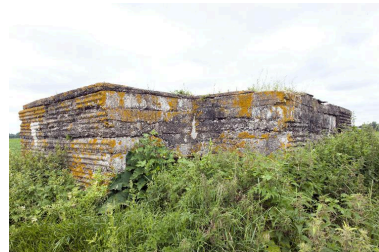
Vue de trois-quarts, vers le nord-ouest. Au premier plan, l'entrée nord-est IVR31_20145905375NUCA