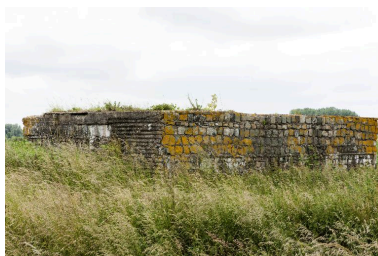
Vue de trois-quarts, vers le sud IVR31_20145905371NUCA