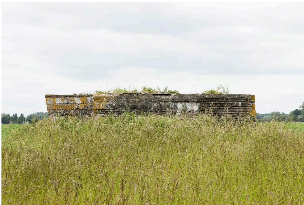
Vue latérale, vers le sud-ouest