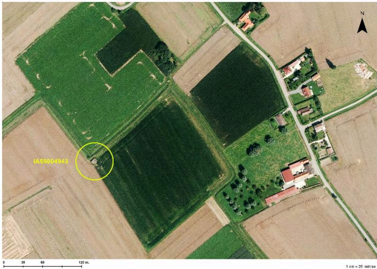
Situation de l'édifice sur une photographie aérienne de 2014