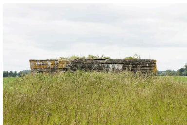
Vue latérale, vers le sud-ouest IVR31_20145905374NUCA