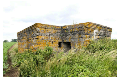
Vue de trois-quarts vers le nord. Entrée sud-ouest IVR31_20145905376NUCA