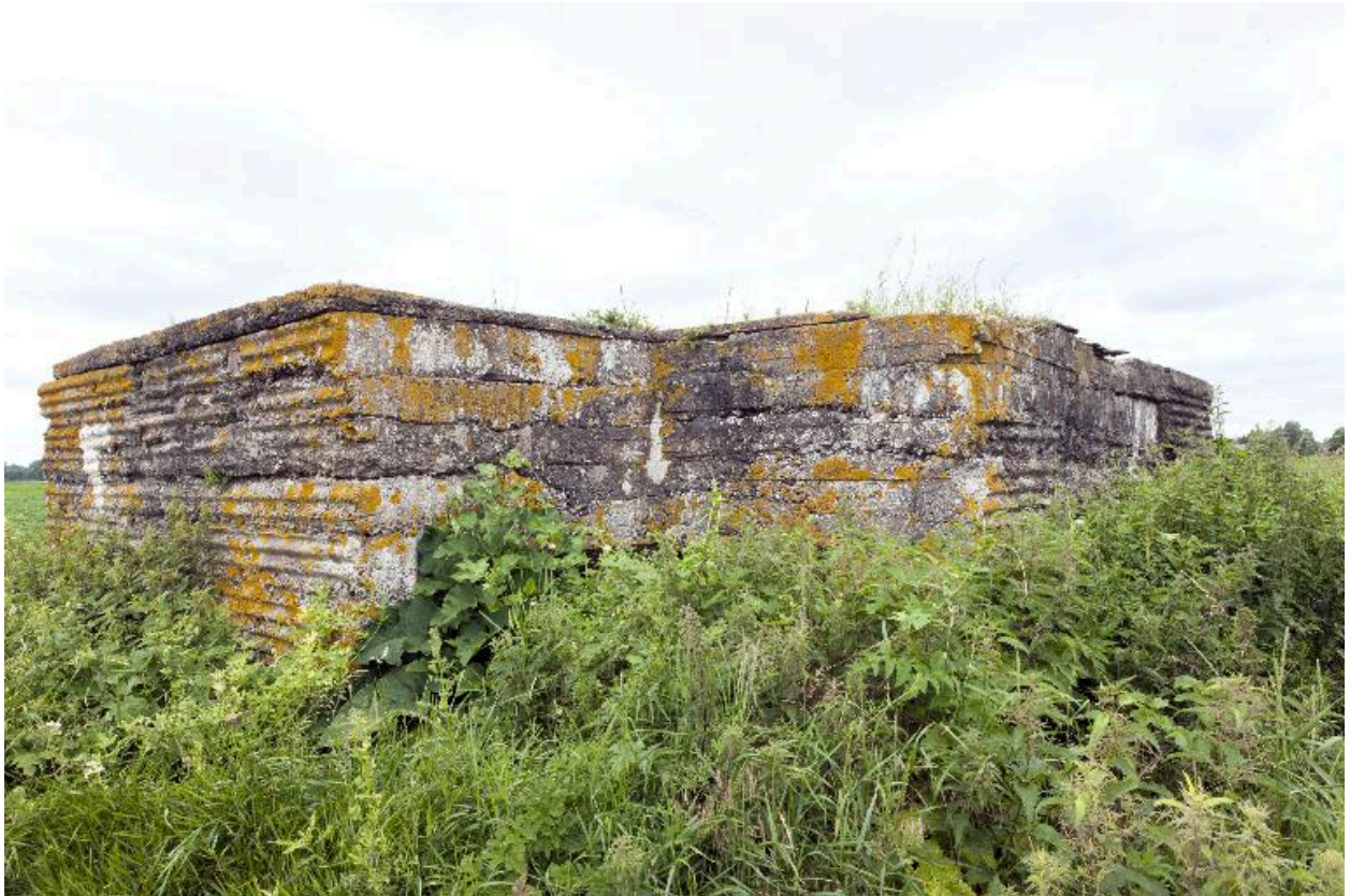
Vue de trois-quarts, vers le nord-ouest. Au premier plan, l'entrée nord-est