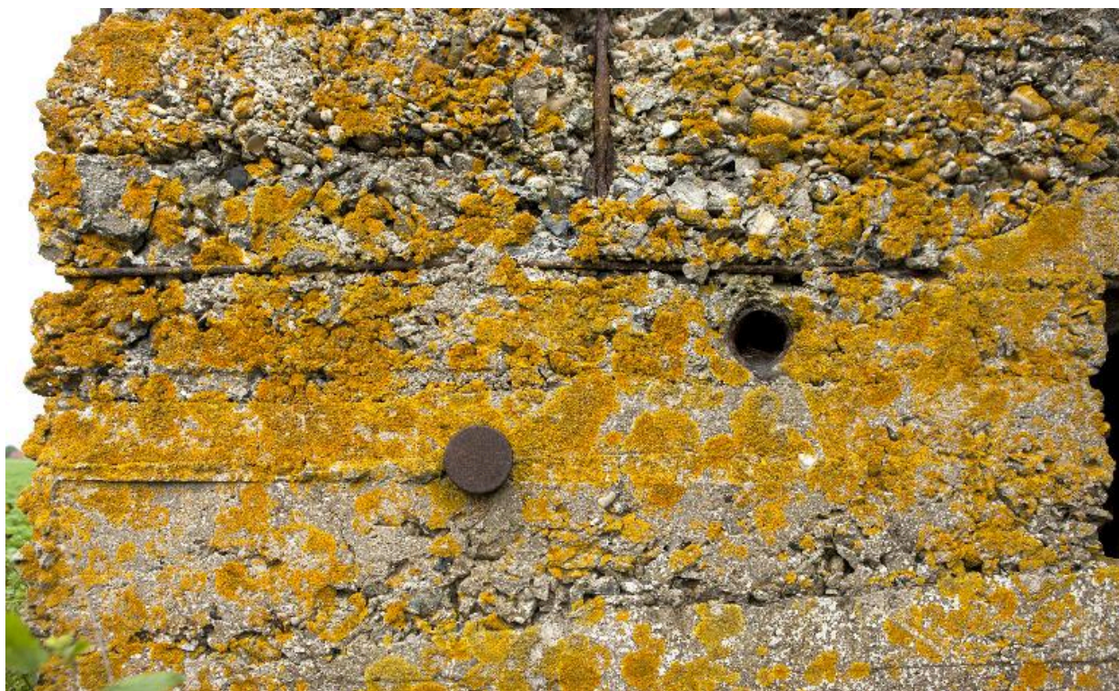
Elévation sud-ouest, détail