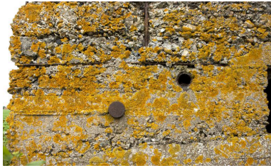
Elévation sud-ouest, détail