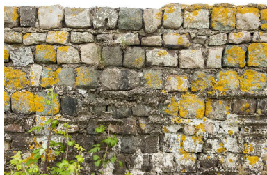
Détail de l'essentage de pavé de l'élévation nord-ouest