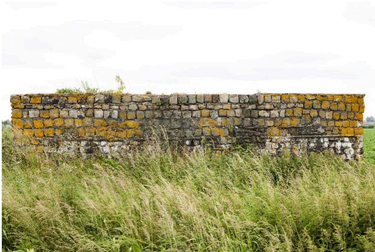
Elévation nord-ouest (face au front)