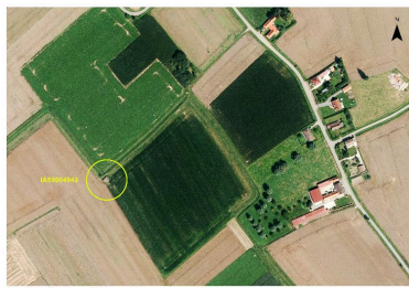
Situation de l'édifice sur une photographie aérienne de 2014 IVR32_20175900916NUCA