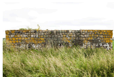
Élévation nord-ouest (face au front) IVR31_20145905373NUCA