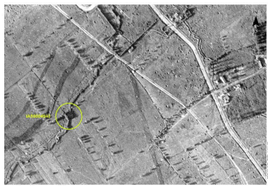
Situation de l'édifice sur une photographie aérienne britannique du 15/09/1918. IVR32_20175900915NUCA