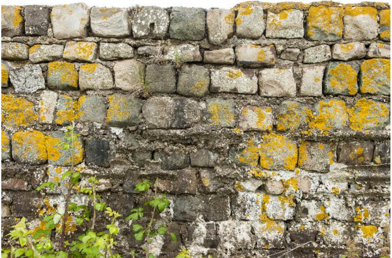
Détail de l'essentage de pavé de l'élévation nord-ouest