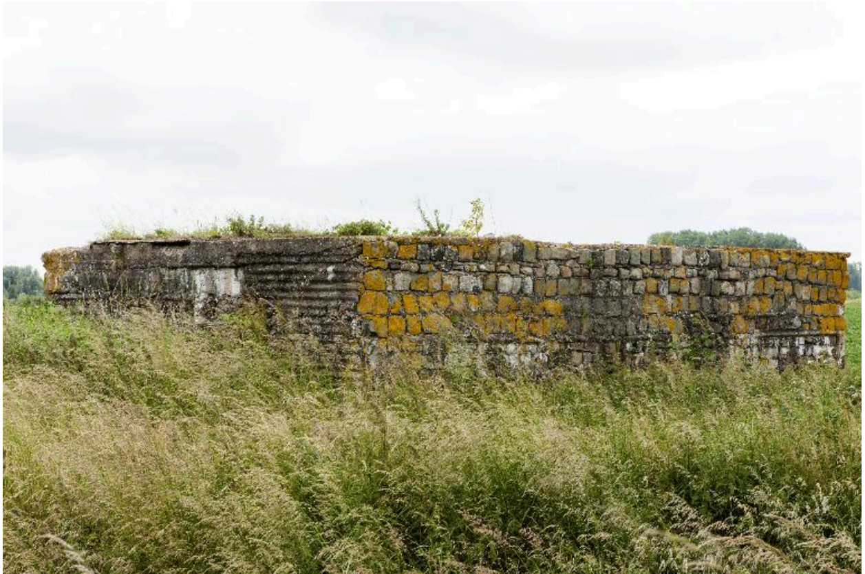
Vue de trois-quarts, vers le sud