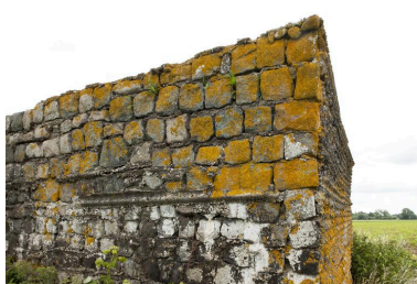
Angle nord-ouest IVR31_20145905377NUCA