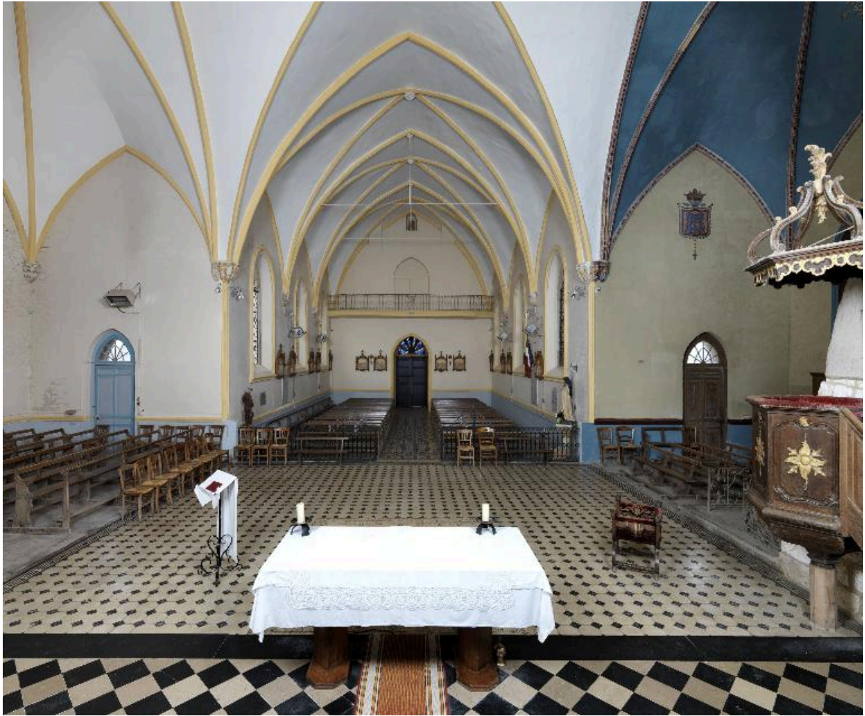
Vue de la nef et des chapelles depuis la chœur.