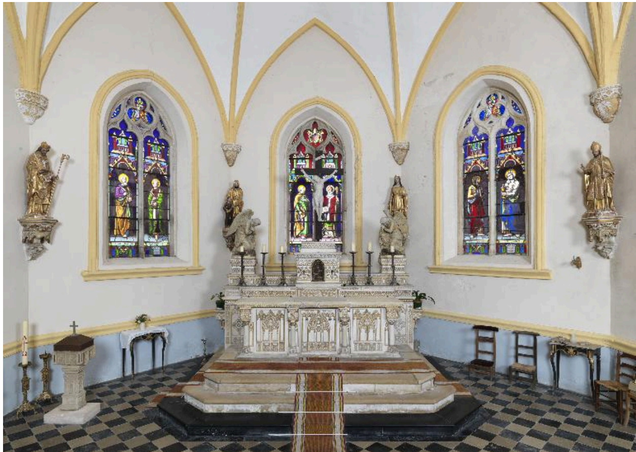
Vue du chœur.