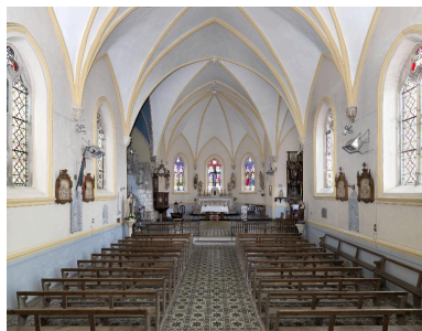
Vue de la nef et du chœur. IVR22_20158001253NUC2A