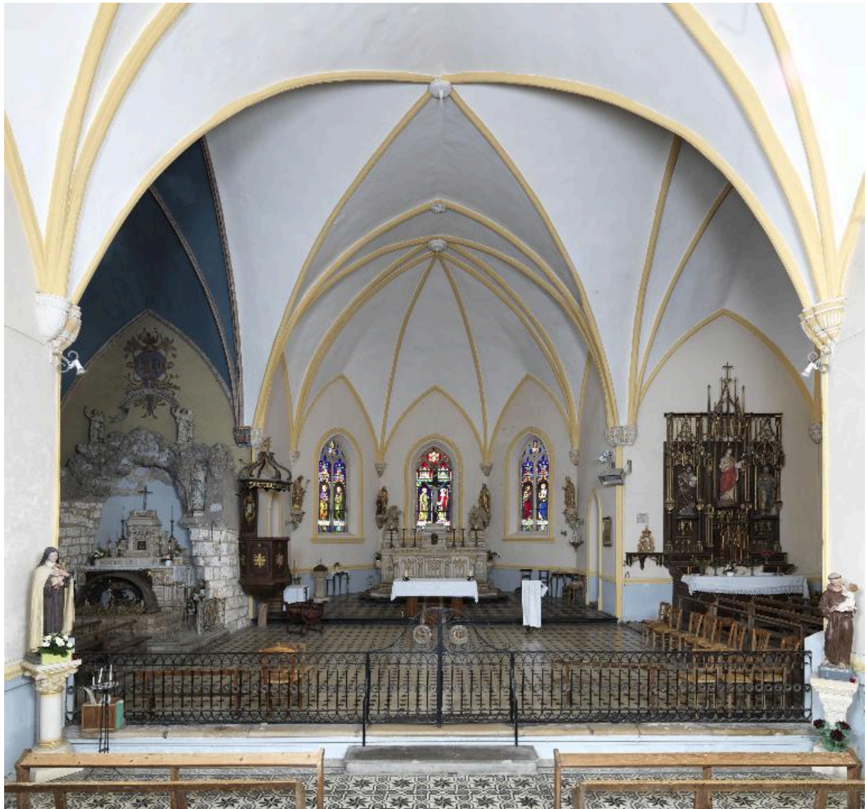
Vue du choeur et des chapelles depuis la nef.