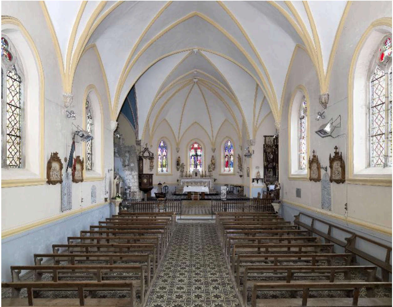
Vue de la nef et du chœur.