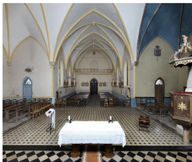
Vue de la nef et des chapelles depuis le chœur.