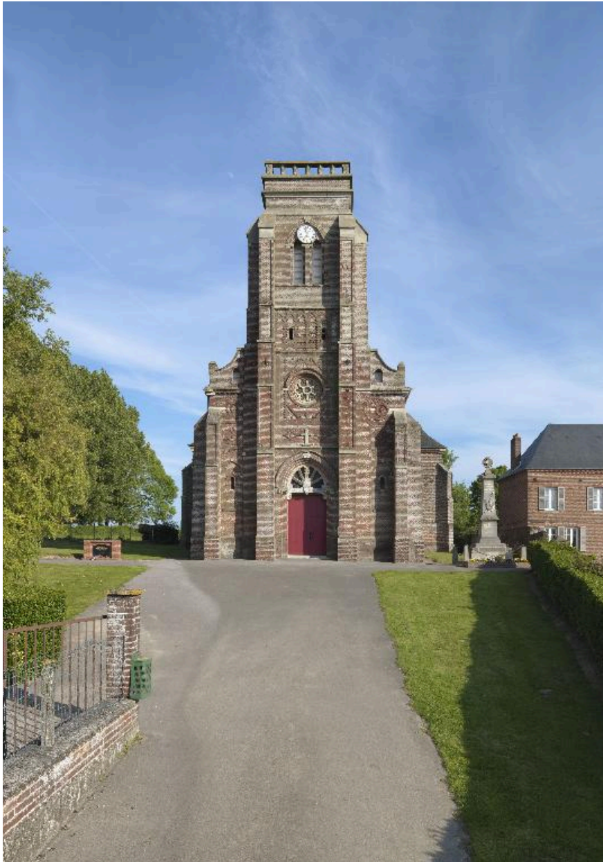
Vue depuis la place Camille-de-Mons.