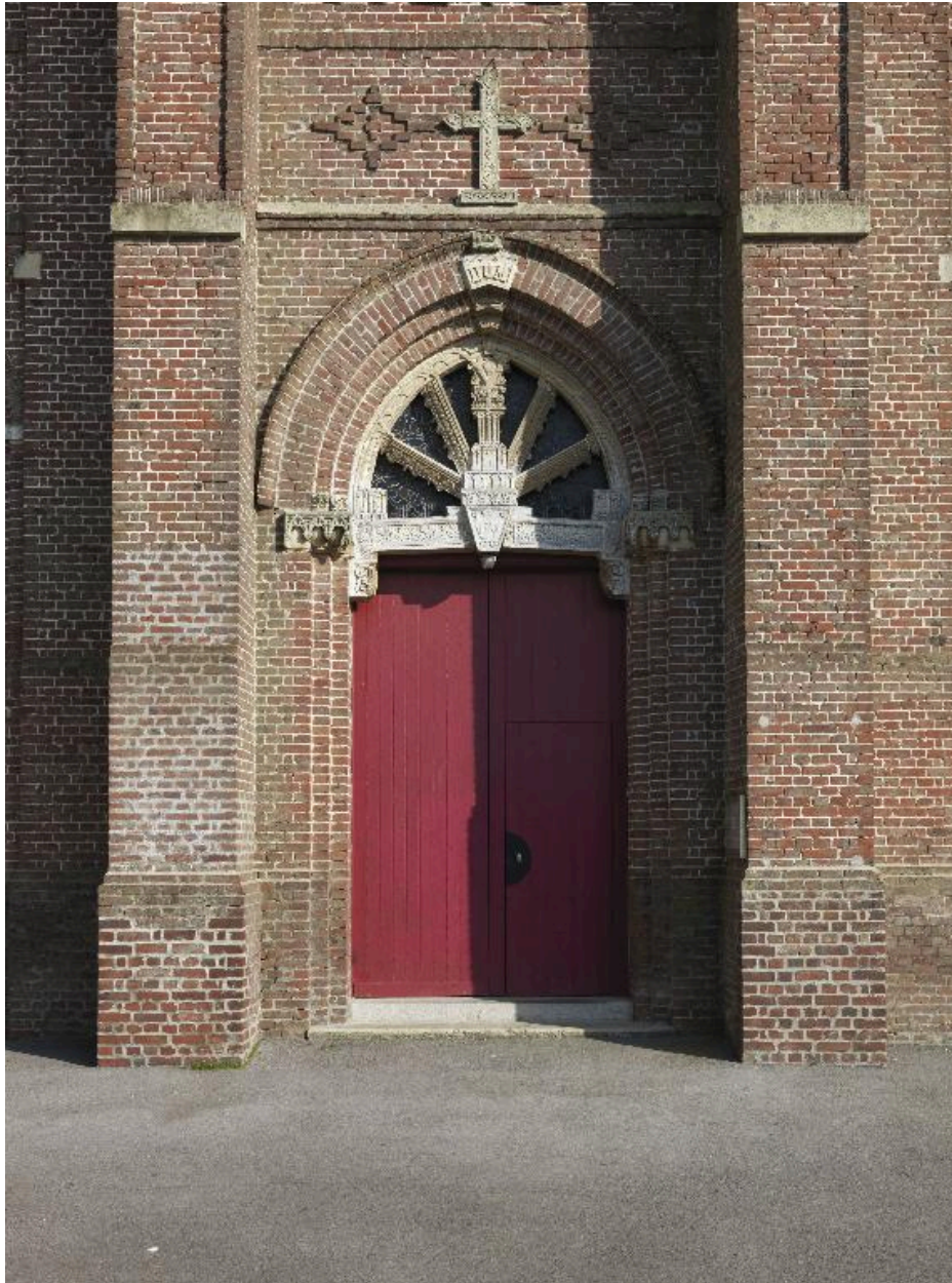
Détail du portail.