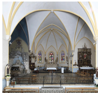
Vue du chœur et des chapelles depuis la nef.