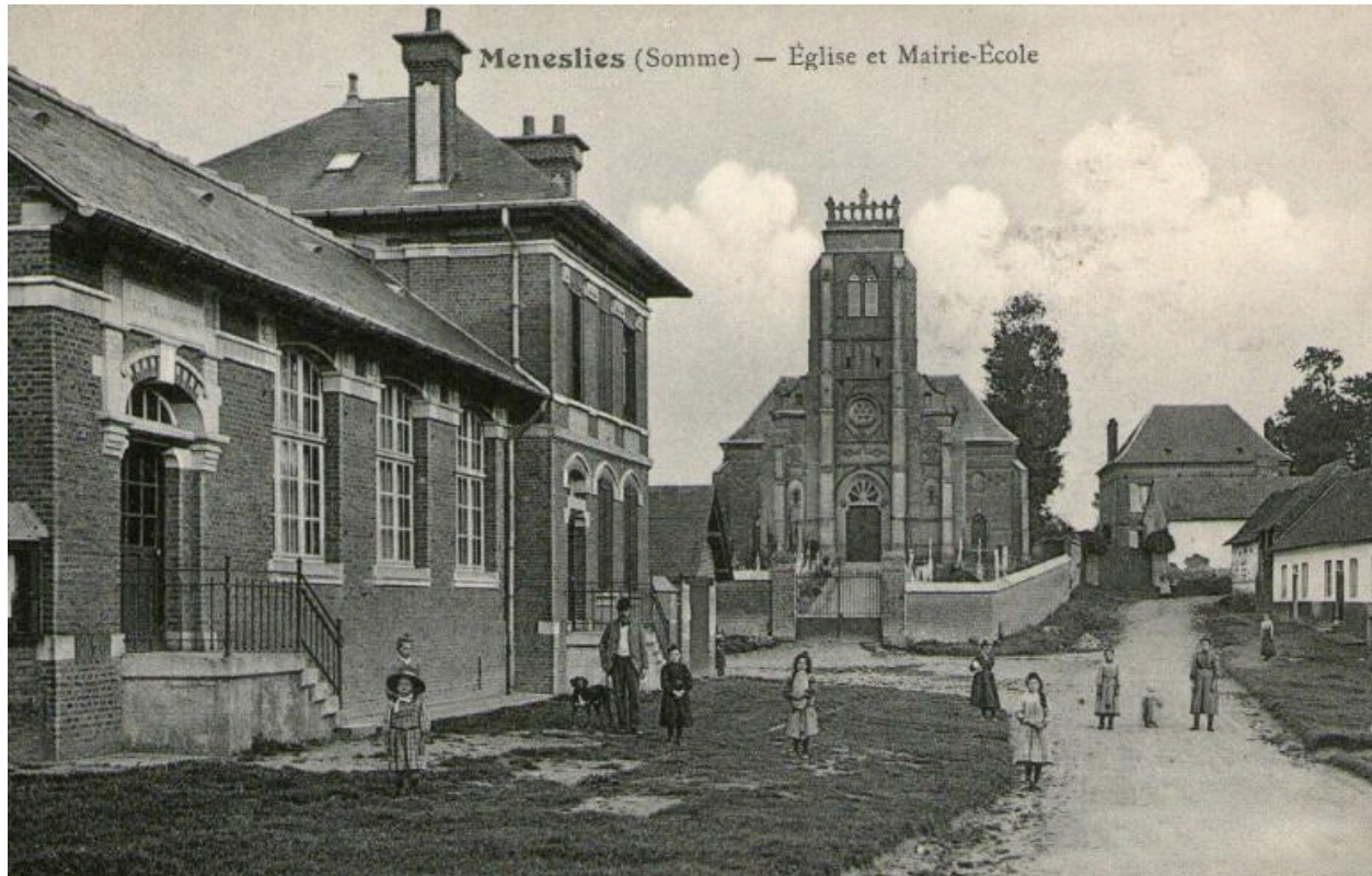
Vue de la place Publique et de l'église, début du 20e siècle.