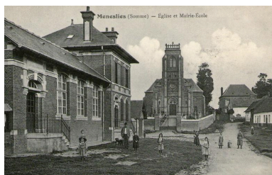
Vue de la place Publique et de l'église, début du 20e siècle (coll. part.). IVR22_20158006440NUCA