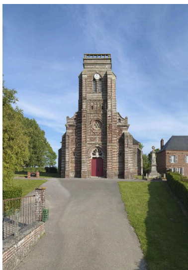
Vue depuis la place Camille-de-Mons.