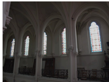
Vue générale et de situation IVR31_20106204371NUCA