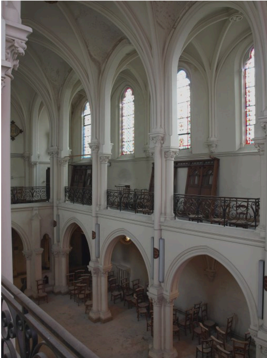
Vue générale et de situation