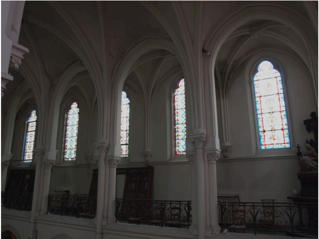
Vue générale et de situation