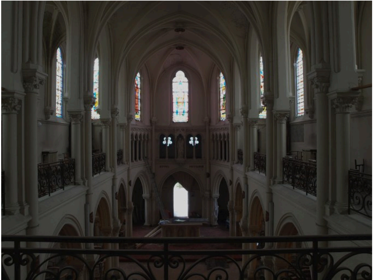
Vue générale et de situation