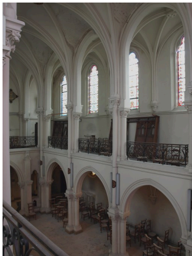
Vue générale et de situation IVR31_20106204370NUCA