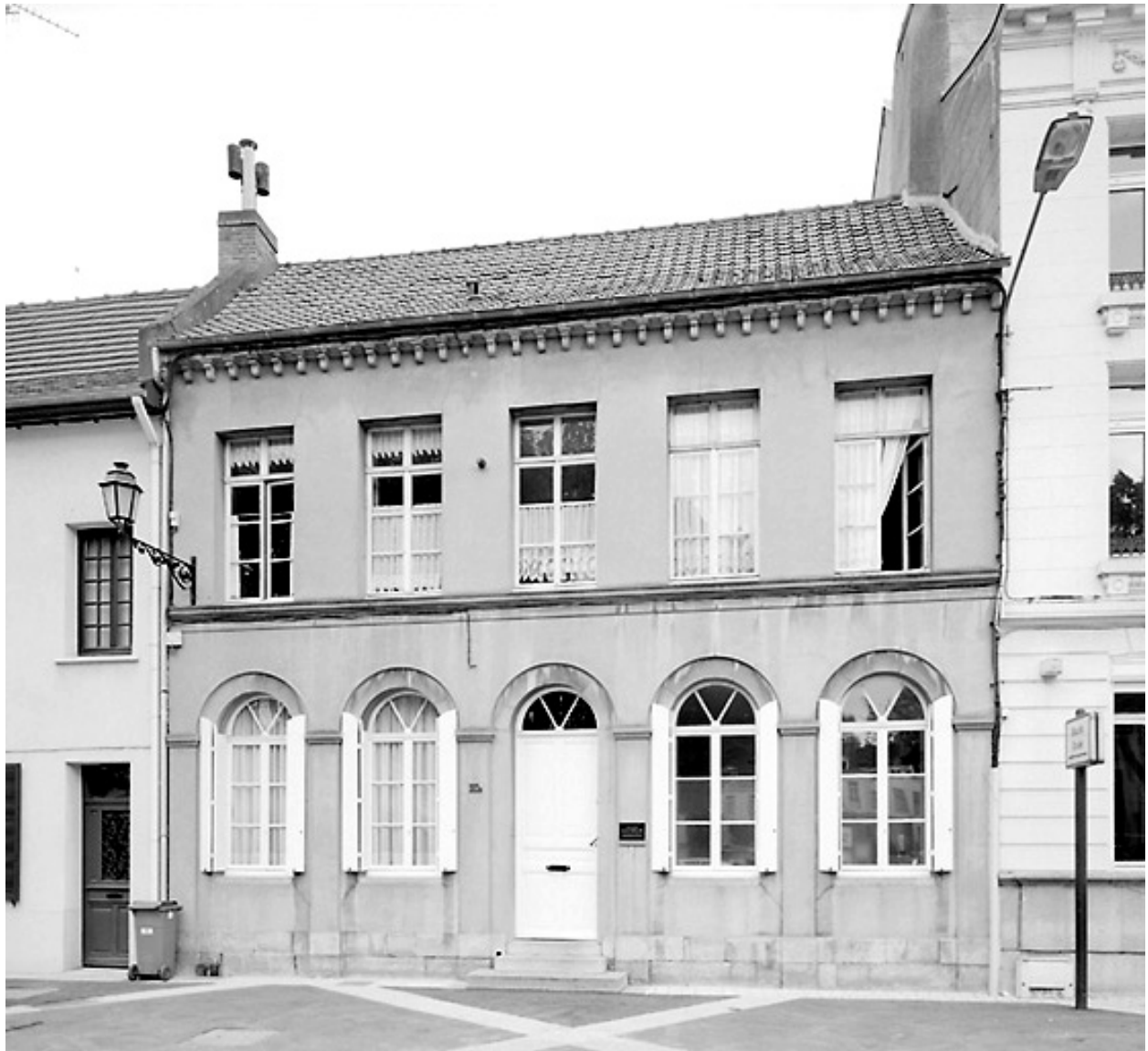
Vue générale (état en 2001).