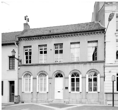
Vue générale (état en 2001).

Projet de reconstruction : élévation, coupe, plans du rez-de-chaussée et du 1er étage, 1839.