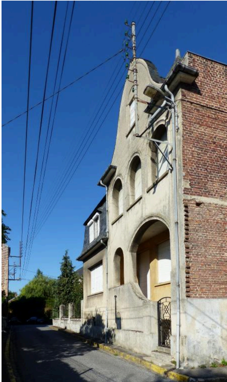
Accès rue des Chanoines.