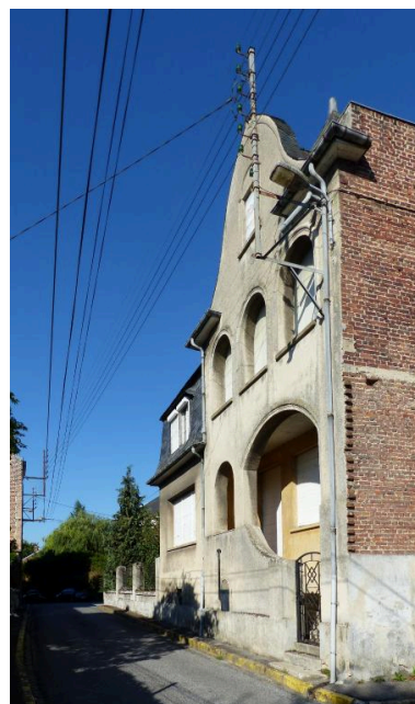
Accès rue des Chanoines.