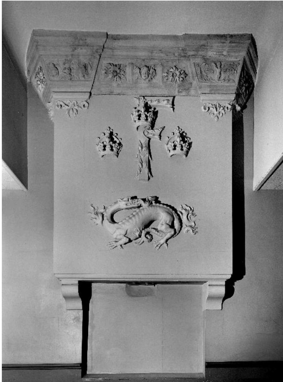
Vue générale de la cheminée.