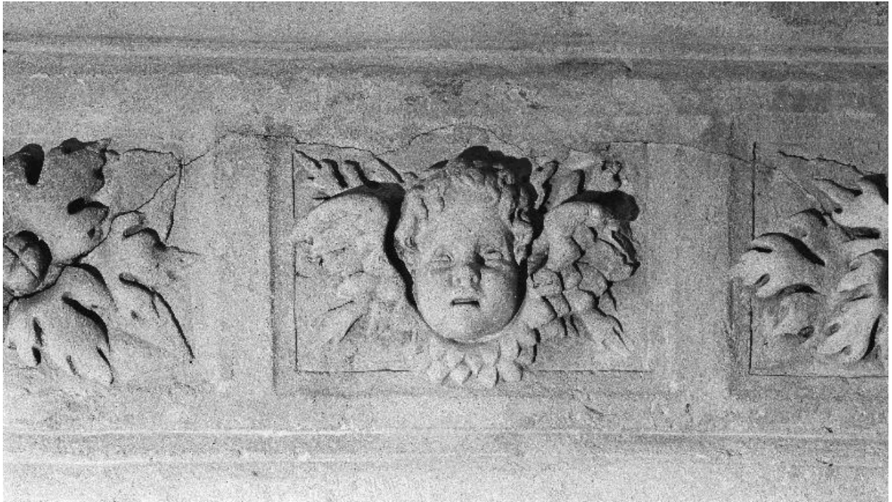
Détail de l'entablement de la hotte : chérubin et feuillage.