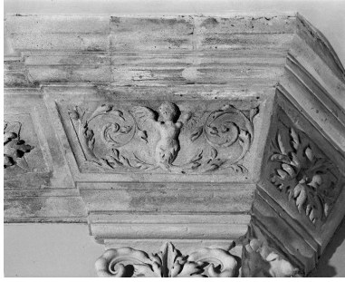
Détail de l'entablement de la hotte : femme ailée et rinceaux.

Phot. Thierry Lefébure IVR22_19910200428X