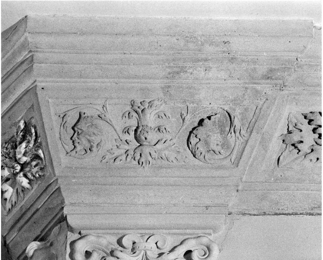
Détail de l'entablement de la hotte : rinceaux et têtes feuillues.