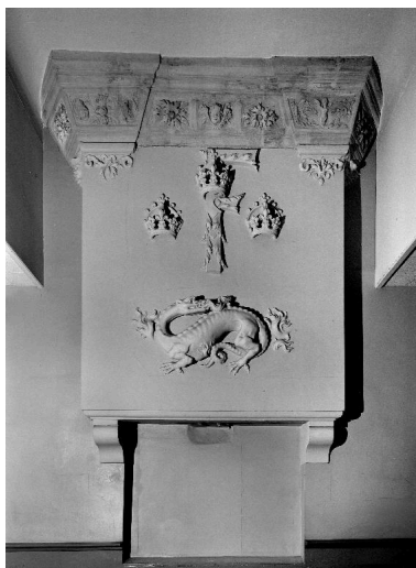
Vue générale de la cheminée. IVR22_19910200099V

IVR22_19880202006ZB