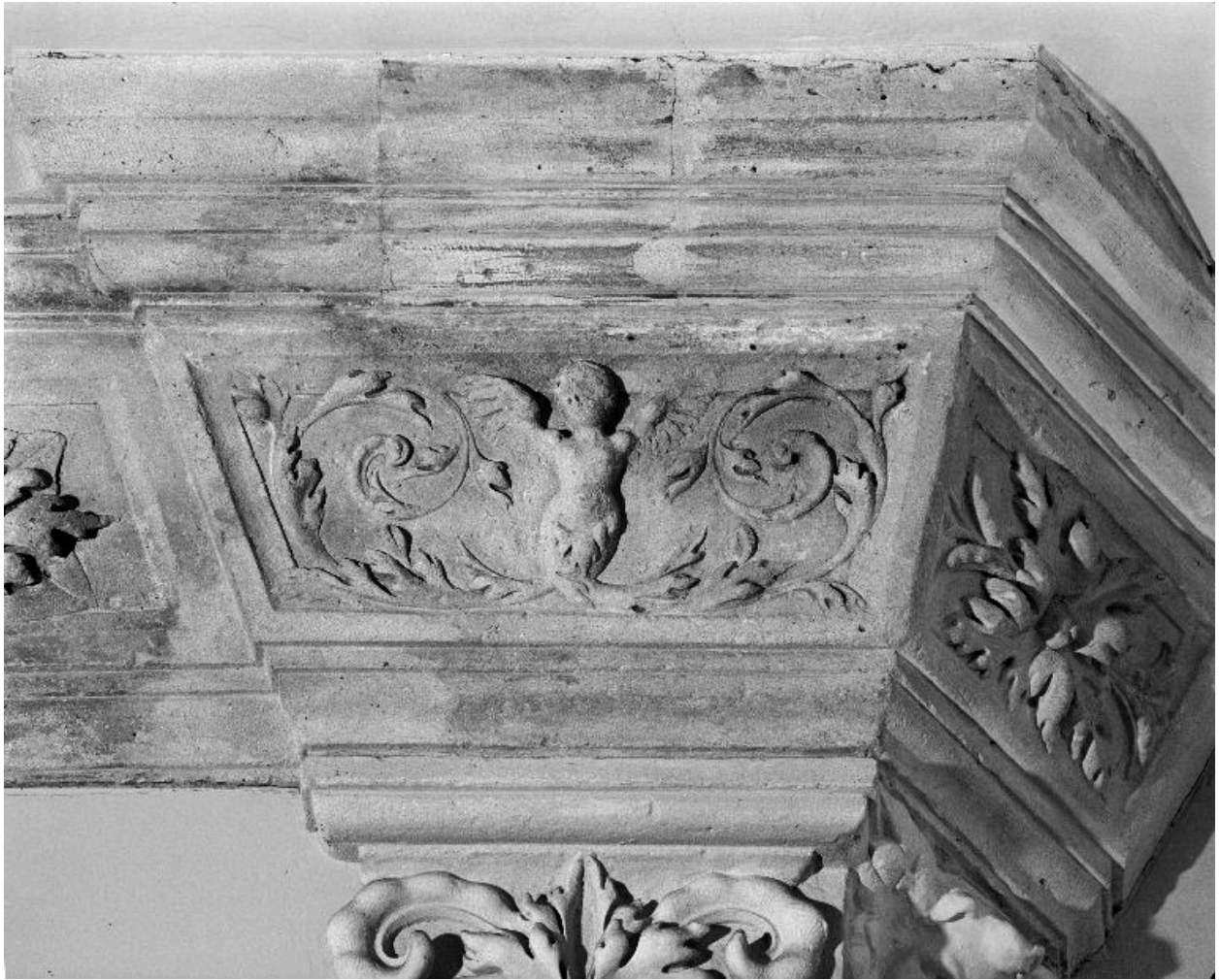
Détail de l'entablement de la hotte : femme ailée et rinceaux.