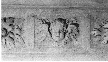
Détail de l'entablement de la hotte : chérubin et feuillage.

IVR22_19910200428X