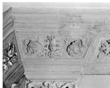
Détail de l'entablement de la hotte : rinceaux et têtes feuillues. IVR22_19910200429X