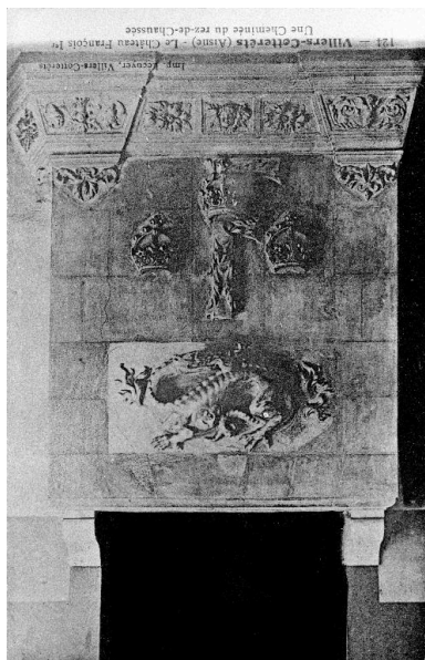
Carte postale éditée dans les premières années du 20e siècle, représentant la cheminée (AD Aisne : 18 Fi Villers-Cotterêts).

Phot. Glotain Patrick IVR22_19880202006ZB