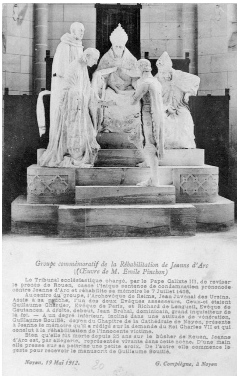
Carte postale représentant le monument commémoratif de la réhabilitation de Jeanne d'Arc par E. Pinchon en 1912.