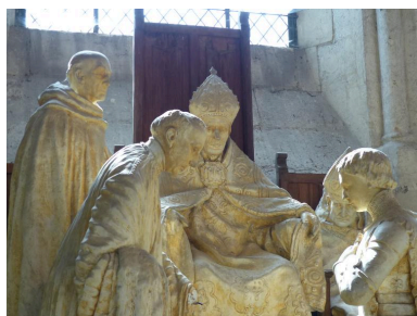
Vue de détail. IVR32_20166005004NUCA