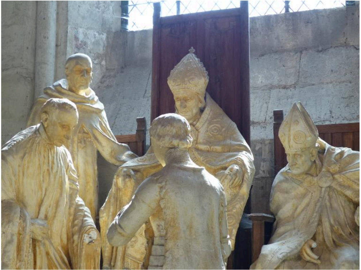
Vue de détail.