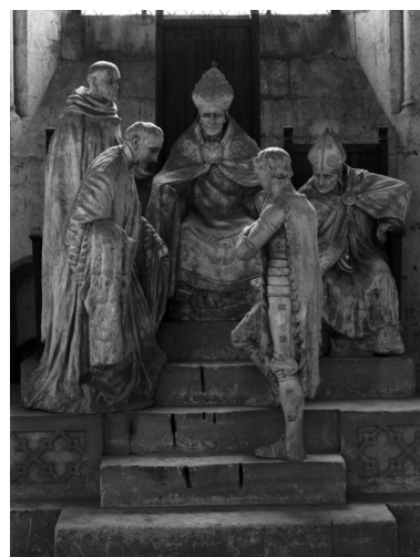
Vue de face. IVR22_19846000765X