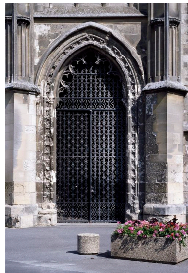
Vue générale du portail. IVR22_20110200033XA