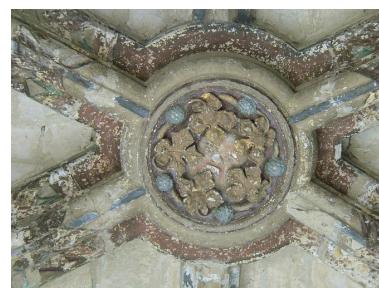
Vue de la clef de voûte du porche. IVR22_20110201116NUCA