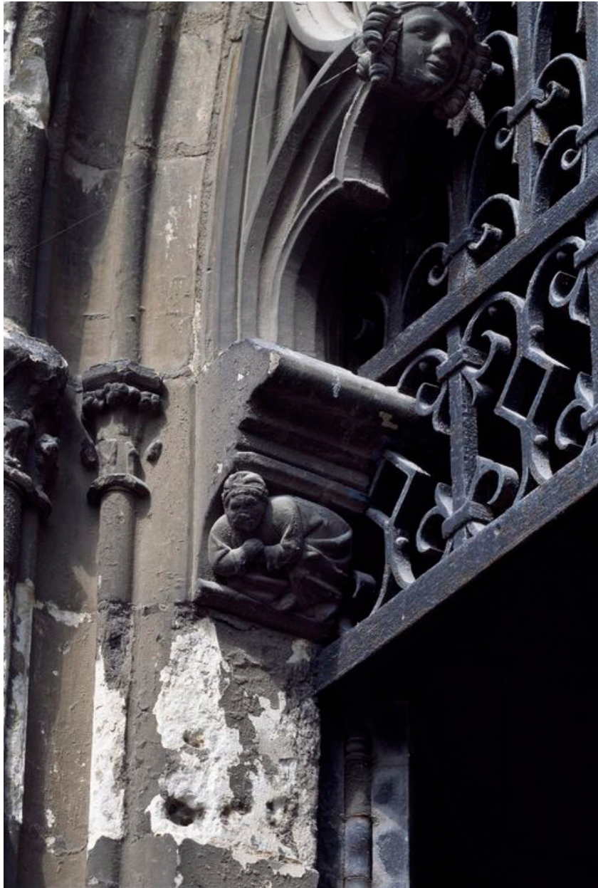
Vue d'un corbeau figuré.