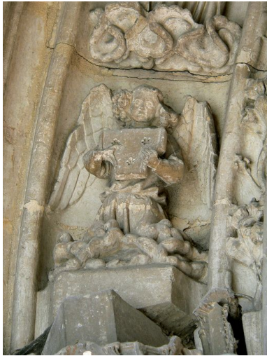
Vue d'un ange jouant du psaltérior. IVR22_20110201070NUCA