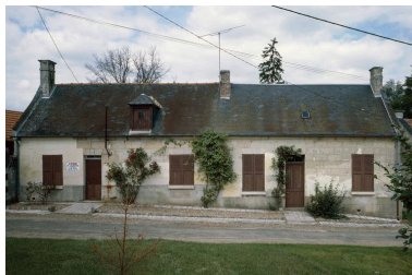
Logis. Élévation antérieure. IVR22_19846001125XA

Plan de situation. Extrait du plan cadastral de 1982, section CI 37. IVR22_20096000175NUCA