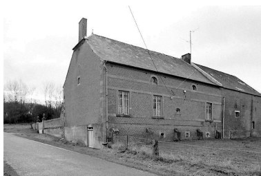
Élévation postérieure du logis. IVR22_19970202381Z

IVR22_19970202390Z