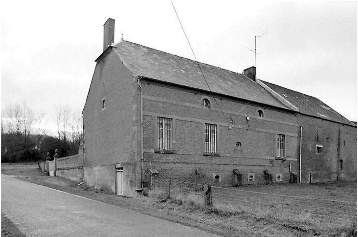
Elévation postérieure du logis.