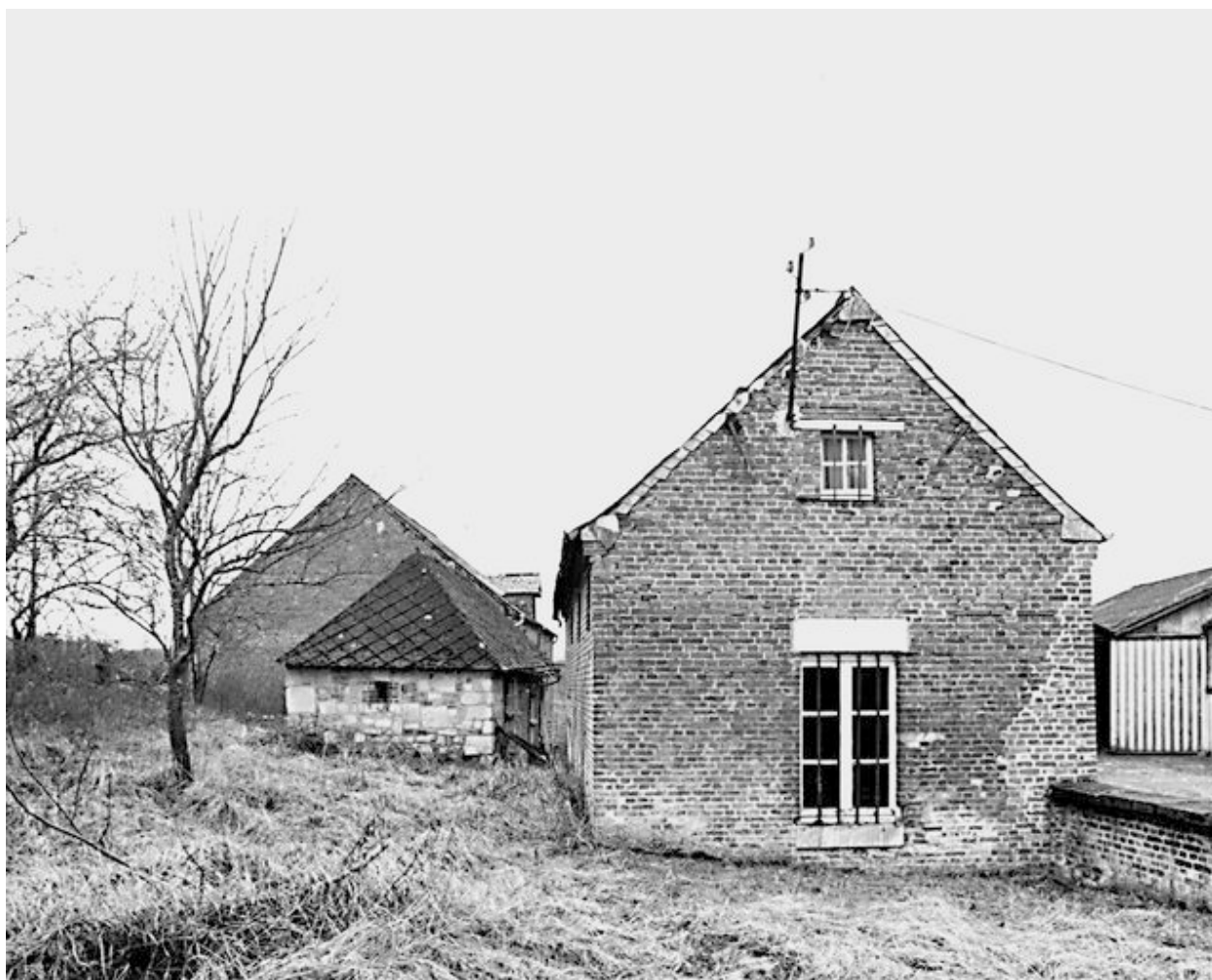
Logement agricole, petite dépendance et étable à l'arrière-plan.