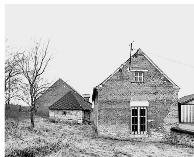
Logement agricole, petite dépendance et étable à l'arrière-plan. IVR22_19970202386Z