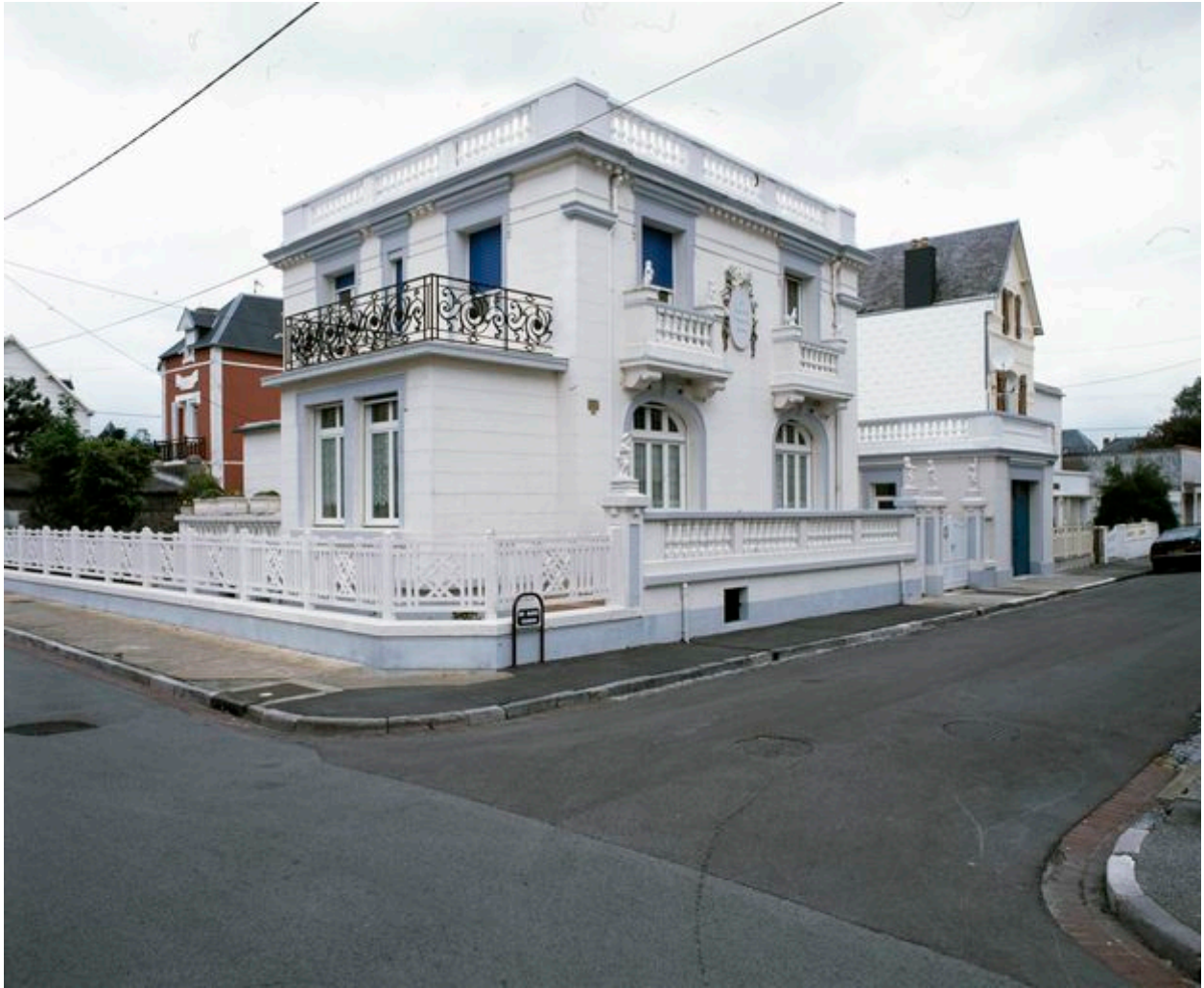
Vue générale de trois quarts, les façades sud et est.