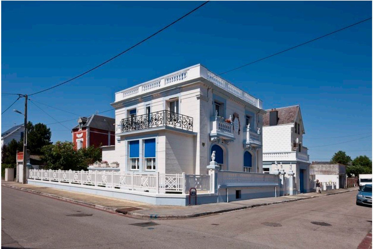
Vue générale de trois quarts, en 2013.