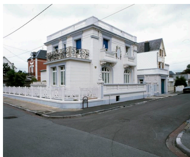
Vue générale de trois quarts, les façades sud et est. IVR31_20076200051XA