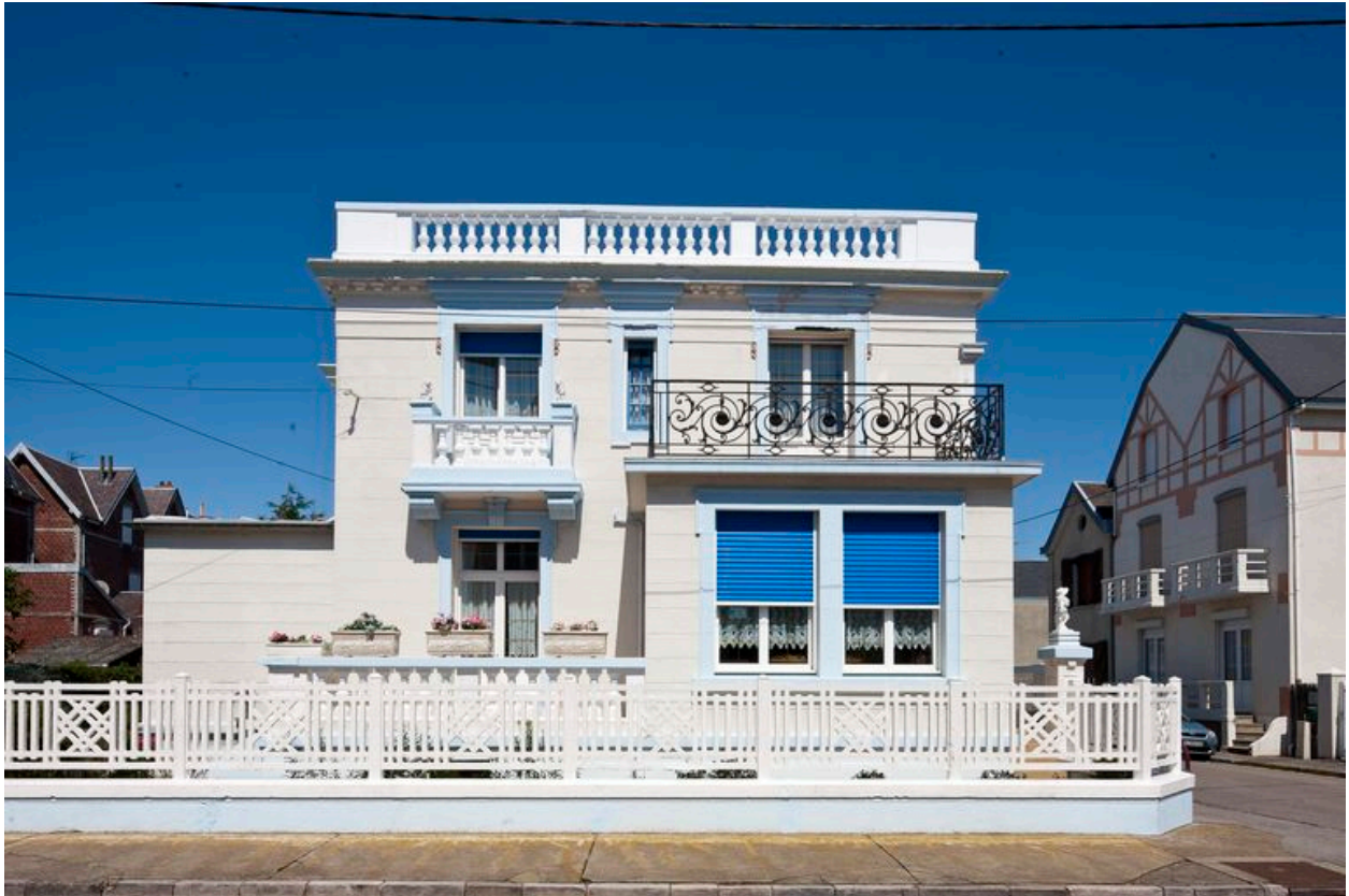
Vue générale de la façade méridionale.