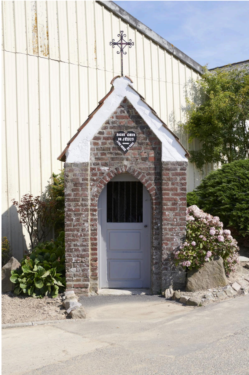
Façade principale de la chapelle.