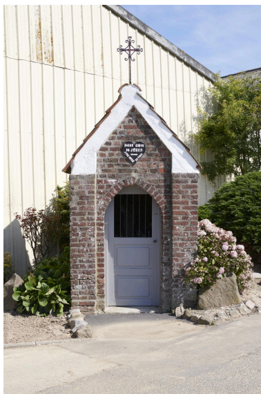
Façade principale de la chapelle.