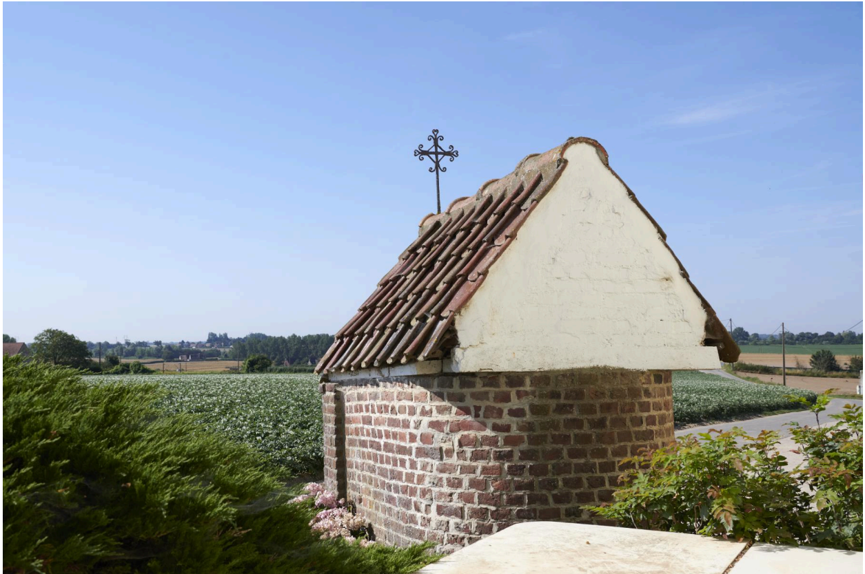
Vue arrière de la chapelle.