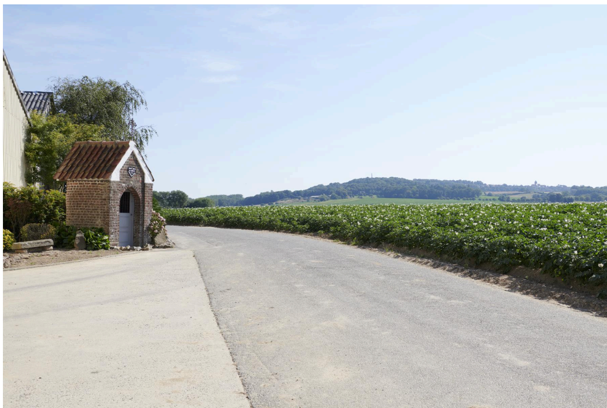
Vue d'ensemble de la chapelle avec le Mont Cassel en arrière-plan.