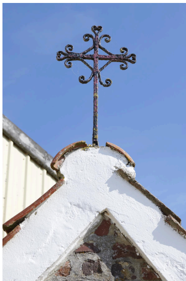
Détail de la croix sommitale en fer forgé.

IVR32_20245902782NUCA