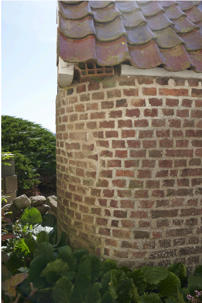
Détail de la maçonnerie "arrondie" à l'arrière de la chapelle.