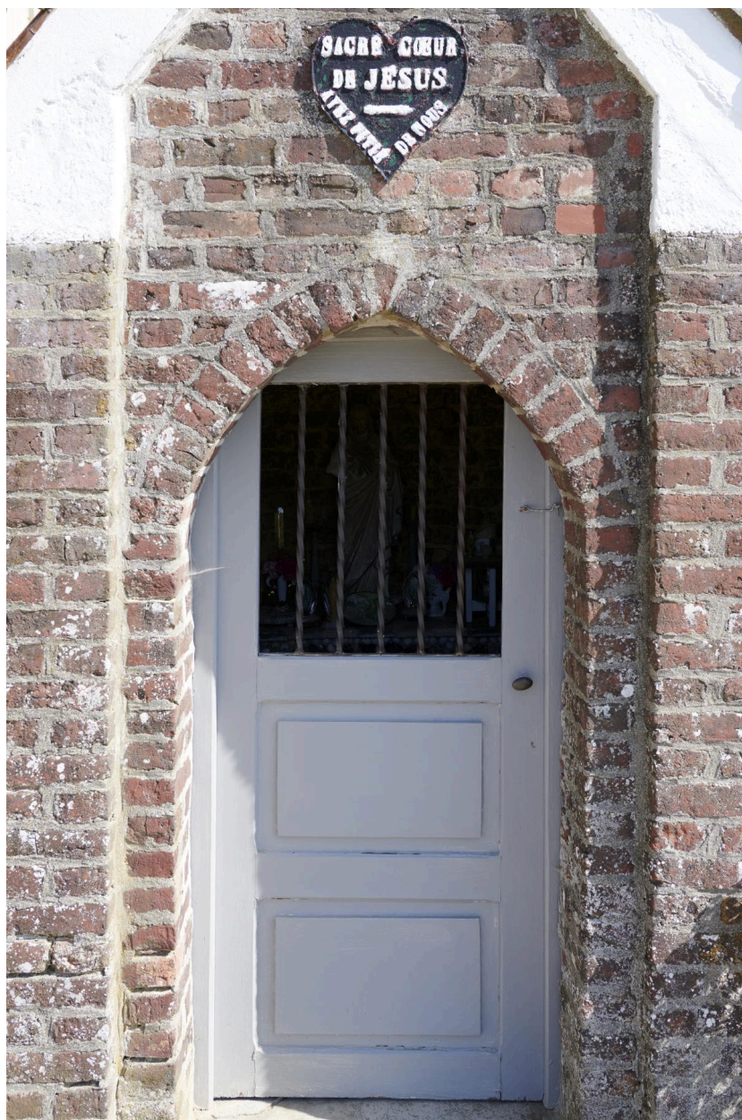
Détail de la porte.