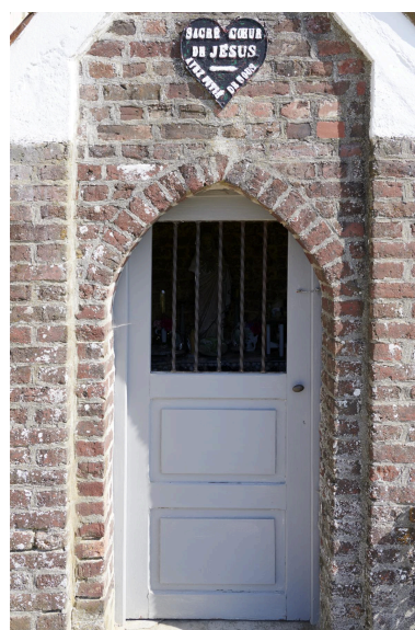
Détail de la porte.