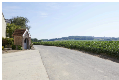
Vue d'ensemble de la chapelle avec le Mont Cassel en arrière-plan.