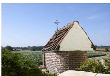
Vue arrière de la chapelle. IVR32_20245902785NUCA