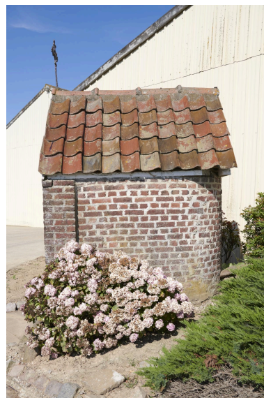
Côté gauche de la chapelle. IVR32_20245902784NUCA