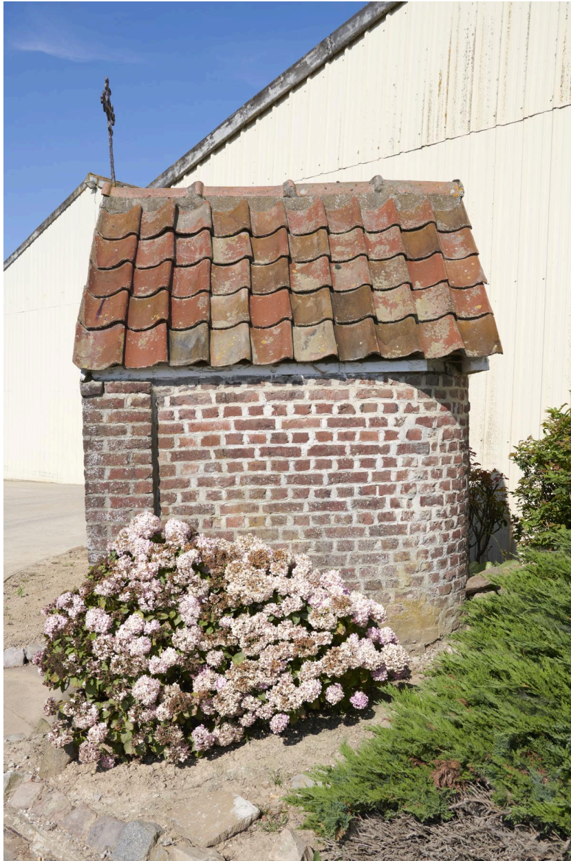
Côté gauche de la chapelle.