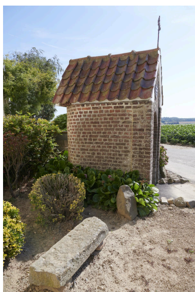
Côté droit de la chapelle. IVR32_20245902786NUCA