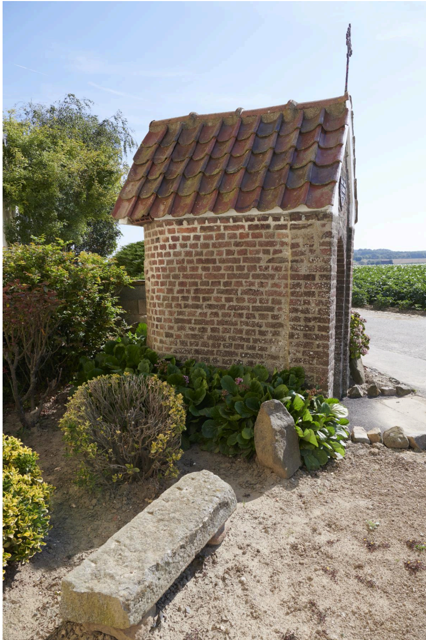
Côté droit de la chapelle.