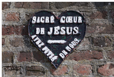
Détail de la plaque métallique en forme de cœur "SACRÉ COEUR DE JÉSUS - AYEZ PITIÉ DE NOUS".

IVR32_20245902782NUCA