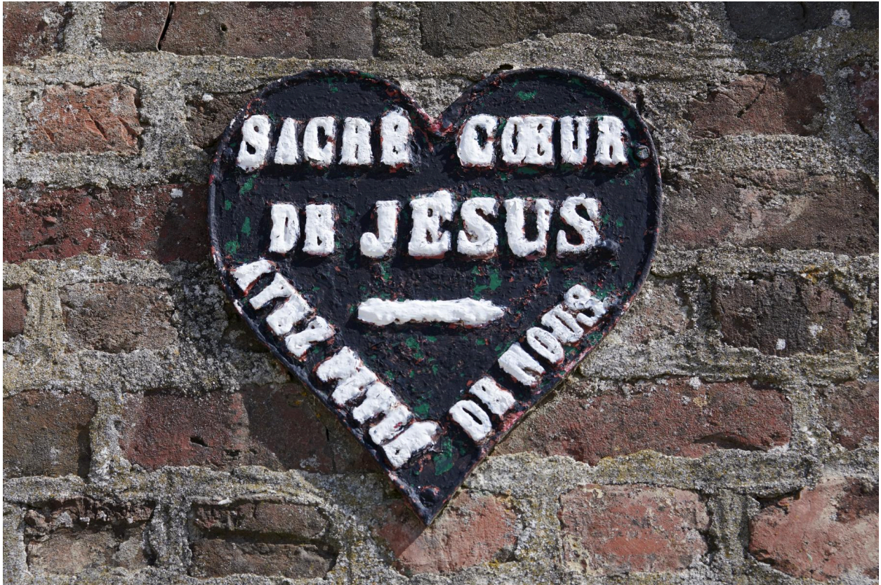
Détail de la plaque métallique en forme de cœur "SACRÉ COEUR DE JÉSUS - AYEZ PITIÉ DE NOUS".