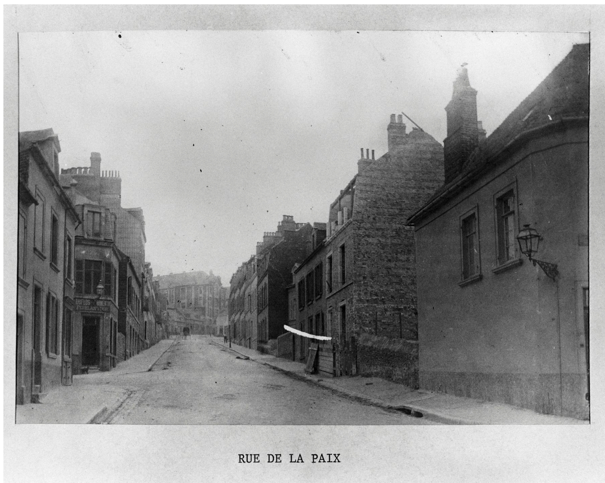
RUE DE LA PAIX

Boulogne-sur-Mer - Rue de la paix, carte postale [ca 1900].