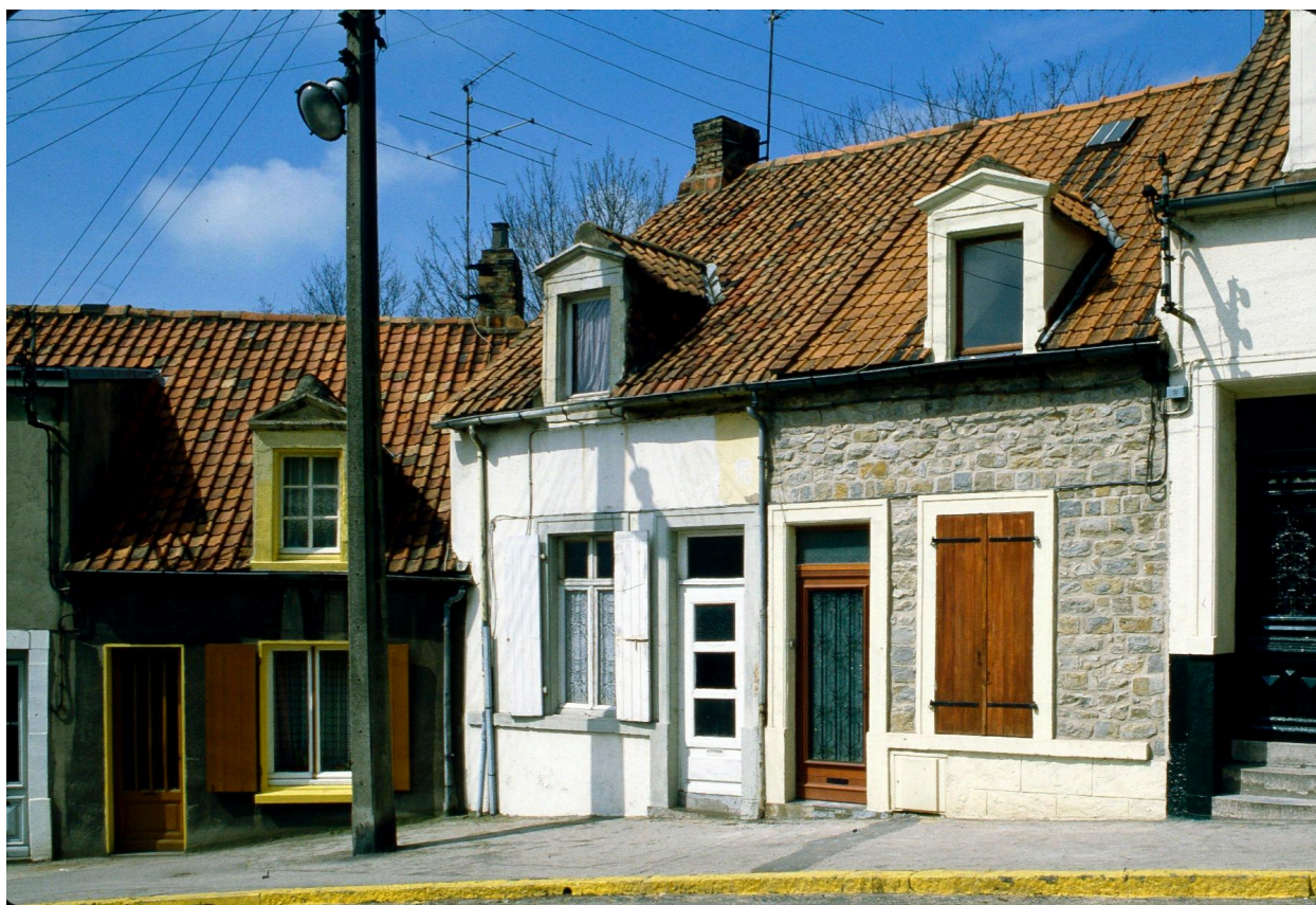
Vue d' angle sur voie.