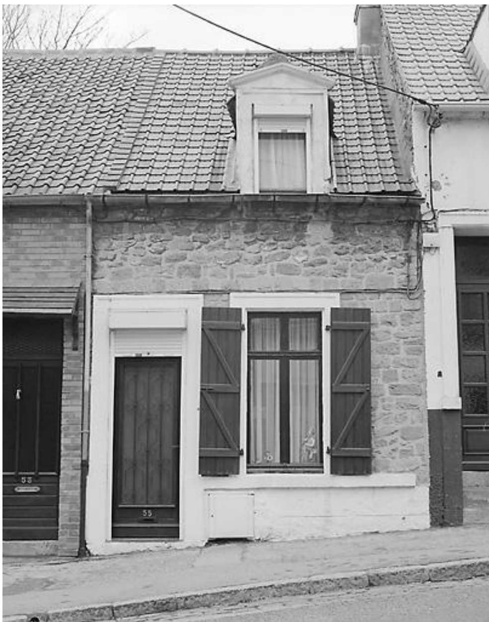
Façade sur voie.