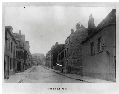
Boulogne-sur-Mer - Rue de la paix, carte postale [ca 1900]