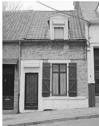
Façade sur voie.