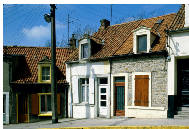
Vue d'angle sur voie. IVR31_19836200107ZA