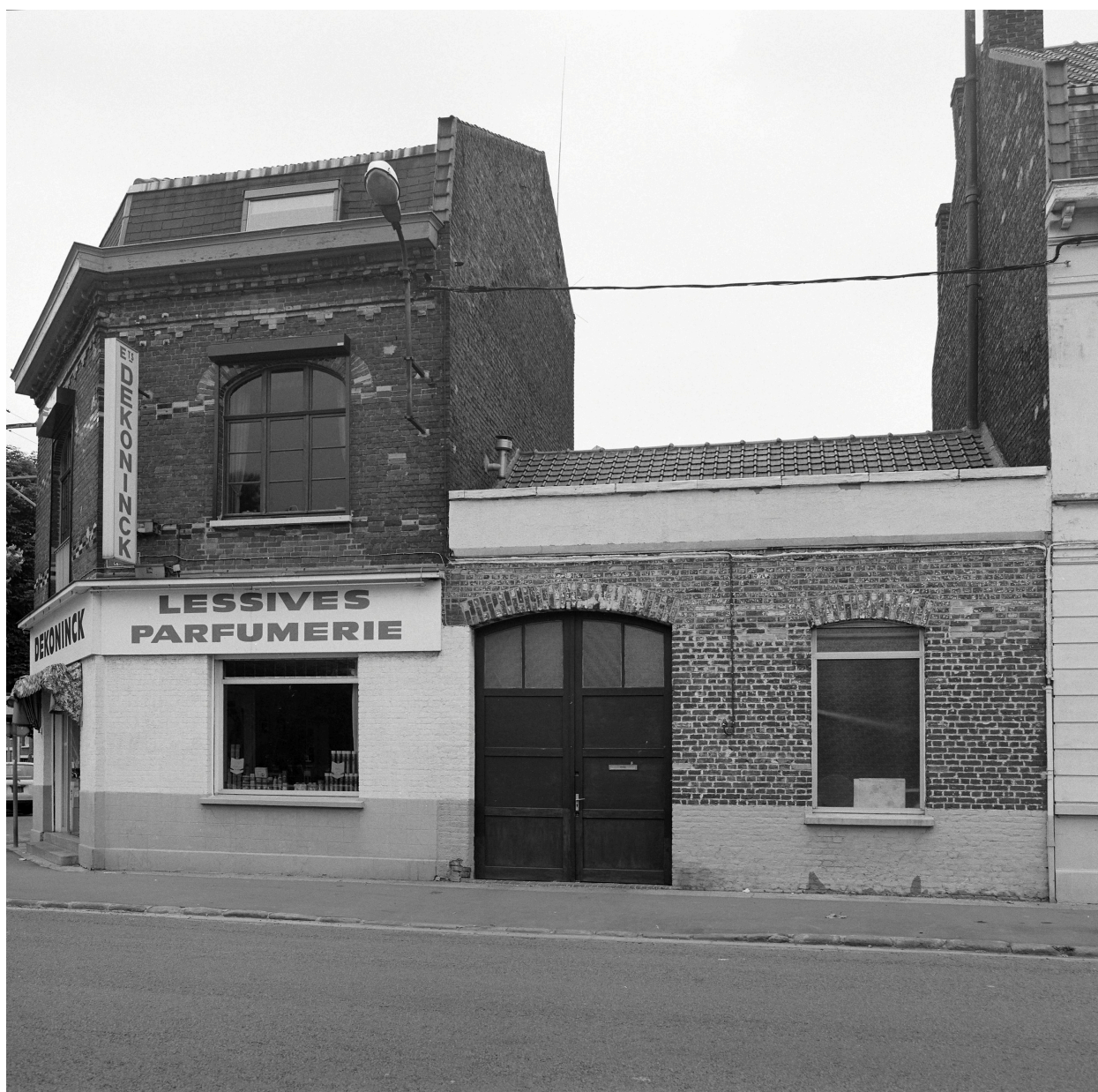
Élévation rue Gambetta.