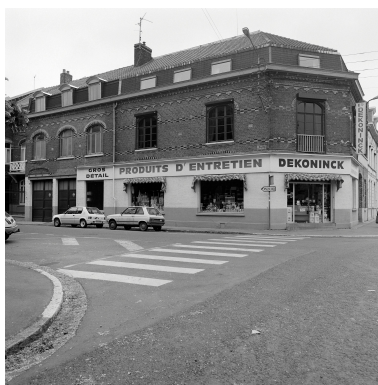
Logement patronal à l'angle de la place Victor-Hugo et de la rue Gambetta.