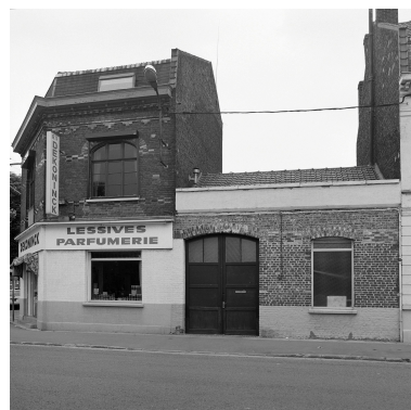
Élévation rue Gambetta. IVR31_19885900784X