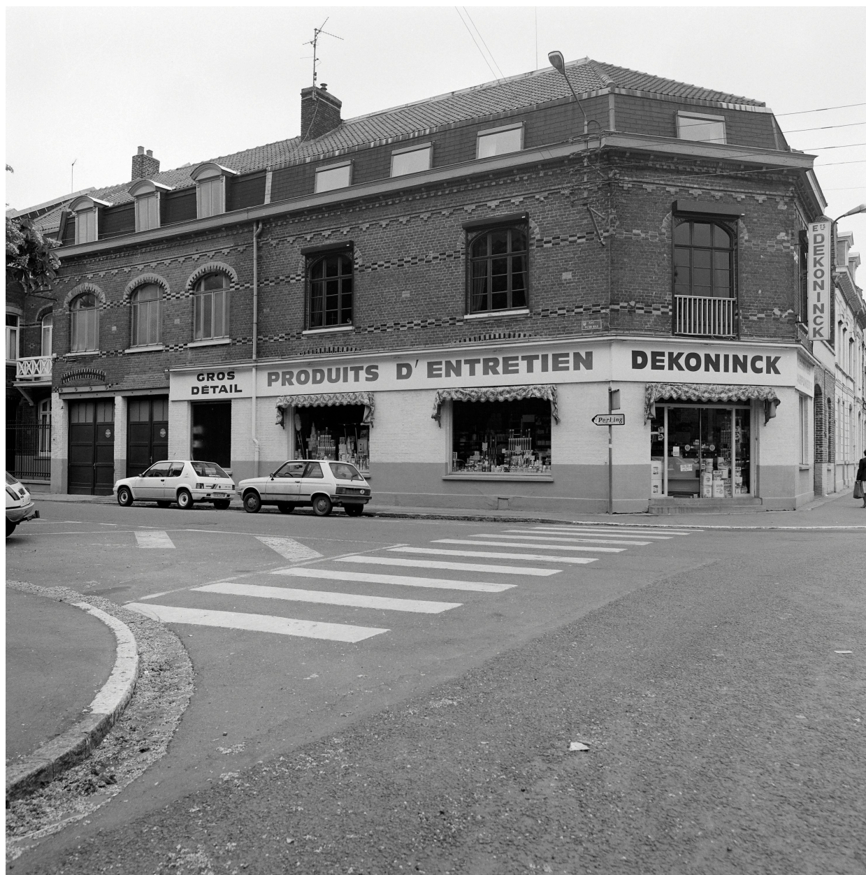
Logement patronal à l'angle de la place Victor-Hugo et de la rue Gambetta.