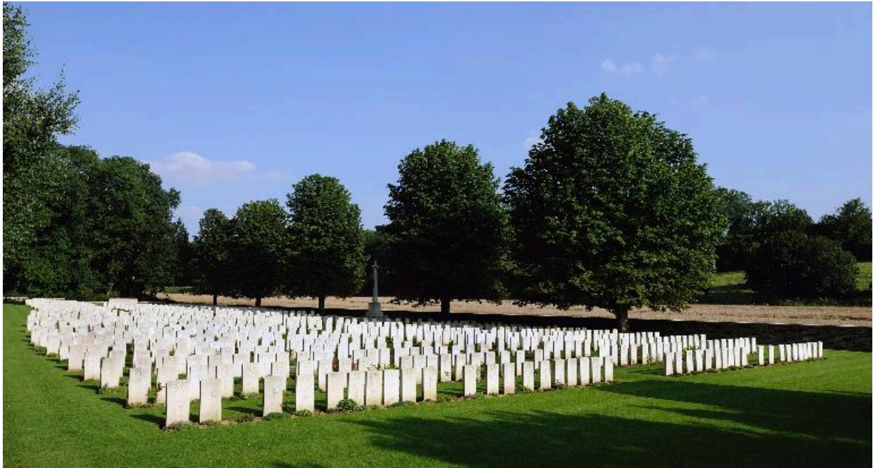
Vue vers le sud, la croix du sacrifice à l'arrière-plan.