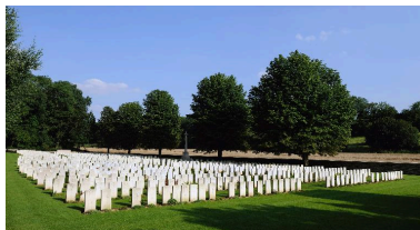
Vue vers le sud, la croix du sacrifice à l'arrière-plan.