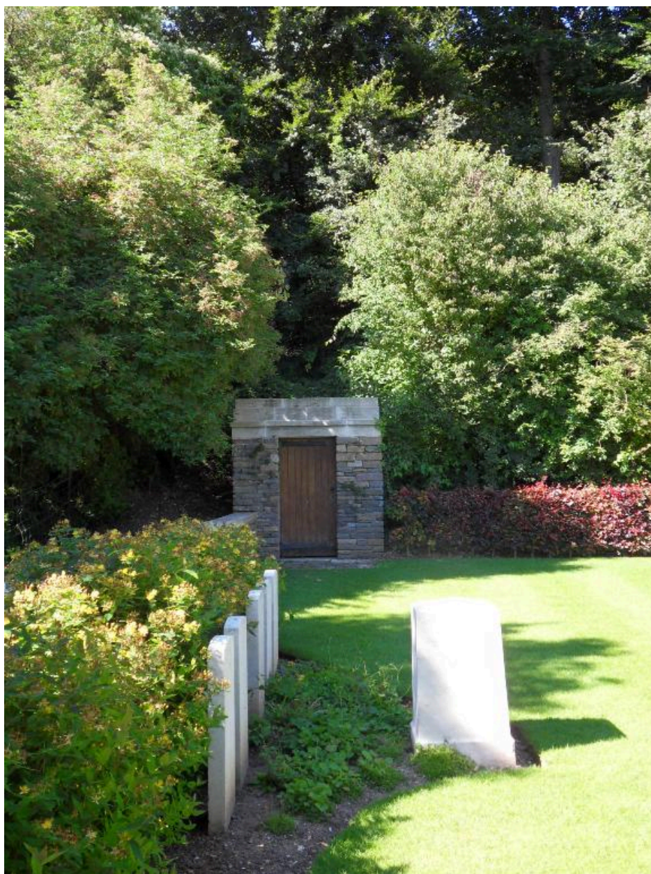
Vue du dépositaire.