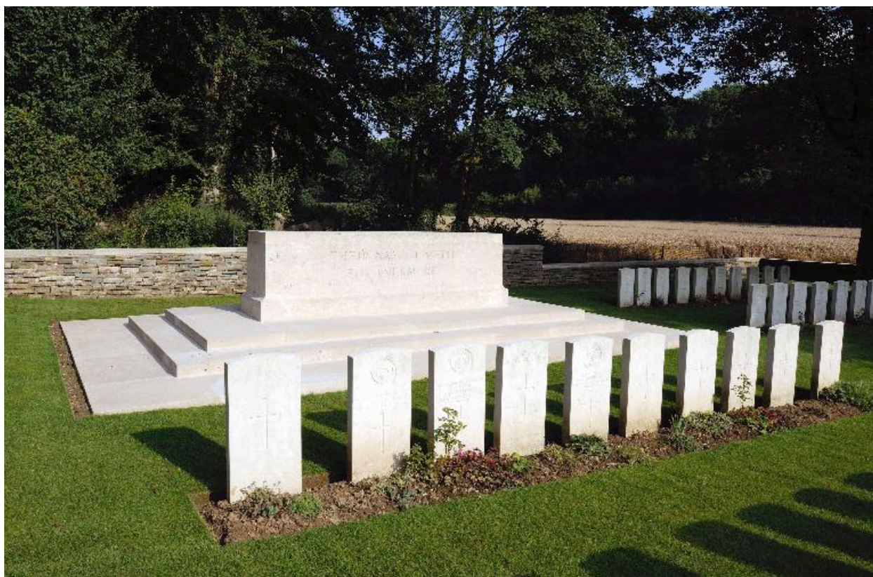
Vue de la pierre du sacrifice