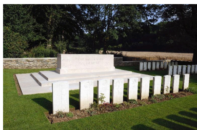
Vue de la pierre du sacrifice IVR22_20128000958NUC2A