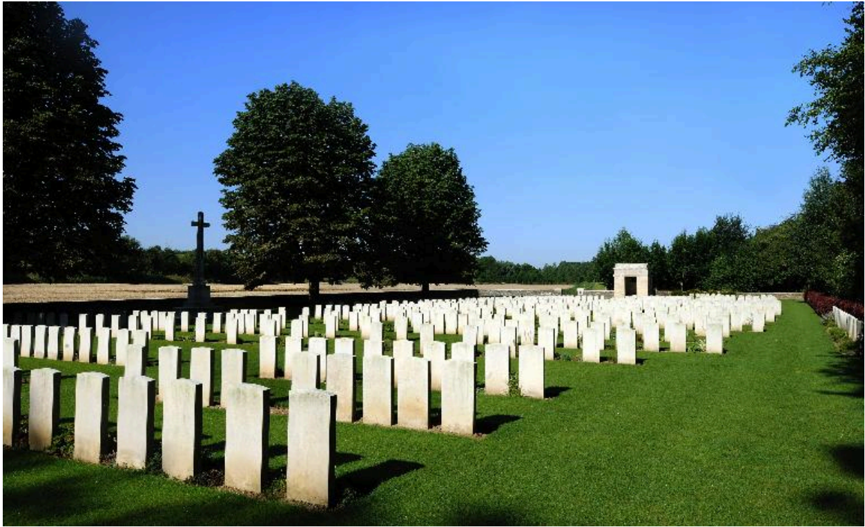
Vue générale, depuis le sud.

IVR22_20128000963NUC2A