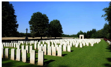
Vue générale, depuis le sud. IVR22_20128000963NUC2A