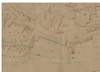
Extrait du cadastre napoléonien (AD Somme ; 3P 2065/4) IVR32_20178005213NUCA