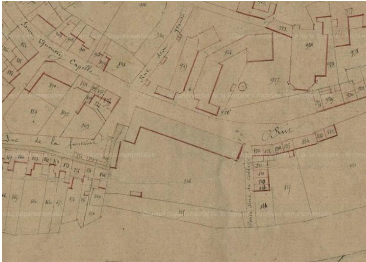
Extrait du cadastre napoléonien (AD Somme ; 3P 2065/4)