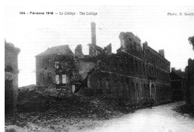
Le Collège en ruines, en 1918